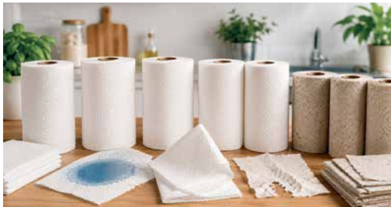
TESTY ukázaly, že chemikáliemi mohou být zatíženy především recyklované výrobky.

Významnou část testu tvořilo mikrobiologické a chemické hodnocení. Laboratoř zjistila, že část papírových utěrek obsahovala vysoké množství bakterií. U šesti výrobků bylo množství aerobních