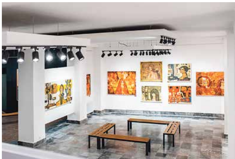
EXPOZICE je instalována u příležitosti 100. výročí narození autora a najdete ji v Michalské ulici.

A jak to celé začalo? Na konci 60. let koupil Antonín Černoch jeden ze Sedliského obrazů. Dílo viselo v obývacím pokoji v Chebu celá desetiletí a stalo se součástí rodinné paměti. Po otcově smrti se obraz proměnil v něco víc. Pro jeho syna Václava se stal impulsem začít sbírat malířovo dílo systematicky a cíleně. Z jediného obrazu v obývacím pokoji vyrostla kolekce 115 děl, která se nyní poprvé představuje veřejnosti v ucelené podobě. „Nejde o kolekci určenou k prodeji, ale o snahu uchovat a zpřístupnit