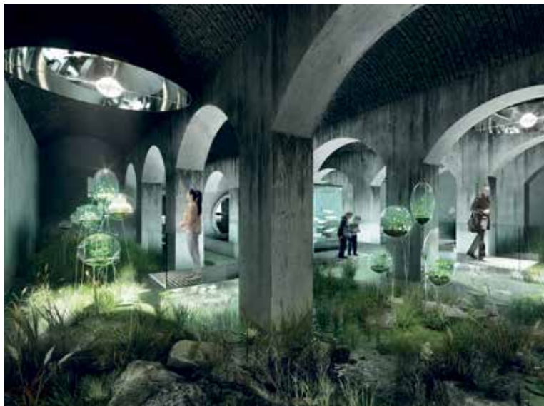
V PRÁVĚ rekonstruovaném areálu bývalé Vinohradské vodárny vznikne unikátní vodárenské osvětové centrum Hydropolis.

Oproti původnímu plánu došlo k mírnému zpoždění prací, nicméně se předpokládá zahájení instalace expozice ve vodojemu do konce roku a slavnostní otevření veřejnosti na podzim roku 2027. „Hydropolis není jen rekonstrukce unikátní technické památky, ale také příležitost ukázat veřejnosti, co všechno stojí za tím, než po otočení kohoutkem začne téct pitná voda,“ dodal pražský náměstek pro oblast infrastruktury Michal Hroza (TOP 09). (PVS, red)