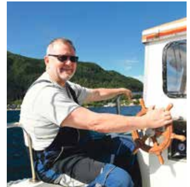
VOLNÝ ČAS nejraději tráví se svoji rodinou, cestováním – třeba i po vodě – a četbou.

mínám na své předchůdce. Například na Michala Baše, který byl v komunální politice mým velkým učitelem. A pak je trojlístek, který jsem Praze daroval: píseň o Praze 2, hymna Prahy 2 a fanfára Prahy 2. Jsou tu ale i hmotné věci, což jsou všechny stavby, které se za mého působení realizovaly a doufejme ještě realizují. Těch je celá řada a doufám, že si lidi vzpomenu, že jsem na nich nějakou kapičku podílu měl.