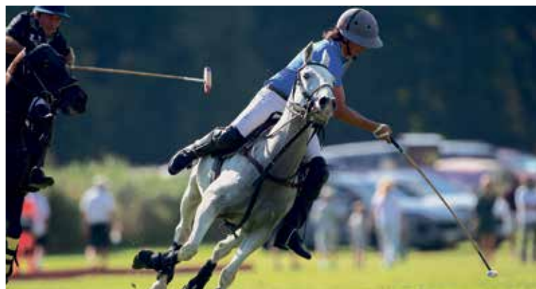
KOŇSKÉ pólo má v českých zemích historické kořeny sahající do období česko-rakouské slechty. Jeho moderní rozvoj však začal až v posledních dvou desetiletích.

■ Praha se v létě stane poprvé hostitelem Royal Golf & Polo Cup, který se uskuteční 8. srpna v areálu Prague City Golf na Zbraslavi. Tento jedinečný turnaj spojuje golf a koňské pólo a přivede do české metropole mezinárodní účast z řad nejlepších profesionálních hráčů póla z celého světa. Divákům v sobotu nabídne inovativní formát zápasů i doprovodný program.