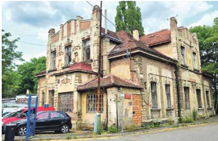
AREÁL ledáren chřadne a chřadne...

Zkuste si představit povozy s ledem, tažené koňmi, kteří tu měli stáje, jak křížují Prahu, tu vyloží náklad u hospody, tu u výroby potravin, tu u nemocnice... Ano, bylo tady velice rušno. Jenže, co s ledárnami dál, když v roce 1954 vznikla Slapská přehrada a pak už řeka nikdy dlouhodobě nezamrzala? Obrázek Vltavy s bruslaři, ale i s ledaři, kteří dobývali led a tyčemi jej posunovali k ledárně, odkud jej vyzvedly výtahy k obří lednici, to vše, i s kolárnou a kovárnou, se stalo rázem minulostí, zachycenou na dávných zažloutlých fotkách. Přírodnímu ledu začal konkurovat led umělý a opravdové lednice, zkrátka, starou éru nahradila moderní doba.