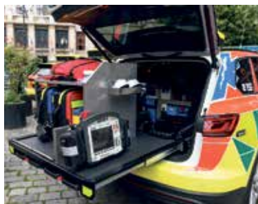
ZÁSTAVBA vozidla zároveň umožňuje vhodnější uložení zdravotnického vybavení, například přístroje LUCAS, který slouží pro automatické stlačování hrudníku pacientů při resuscitaci.

Praha – Výjezdové skupiny rychlé lékařské pomoci začnou v Praze