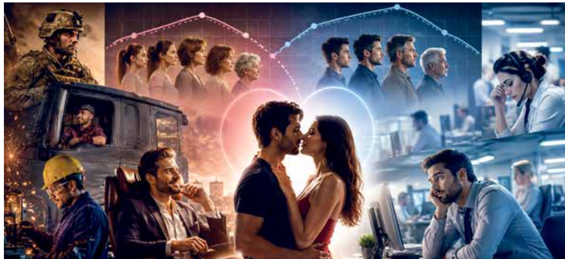
IKDYŽ hladina testosteronu u mužů začíná klesat již od jejich třicátých let, studie naznačuje, že mužské libido ještě zhruba deset let dále roste. Ilustrace: AI

Vztahový status měl také rozdílný vliv podle pohlaví. „Muži v partnerských vztazích uváděli vyšší libido než single muži, zatímco u žen byl trend opačný – svobodné ženy hlásily vyšší sexuální touhu než ženy v partnerství,“ popsala Lucie Slováčková. (RS, red)