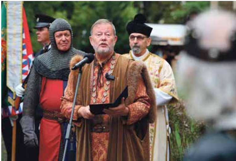
ZAHÁJENÍ tradiční historické oslavy na Karlově, která připomíná založení kláštera a chrámu Nanebevzetí Panny Marie a sv. Karla Velikého, se neobejde bez dobových kostýmů.

Takže jste zároveň organizátor, psycholog, psychiatr, rodinný příslušník... Zároveň je třeba říct, že čím je člověk výš, tím má být pokornější. To je moje krédo.