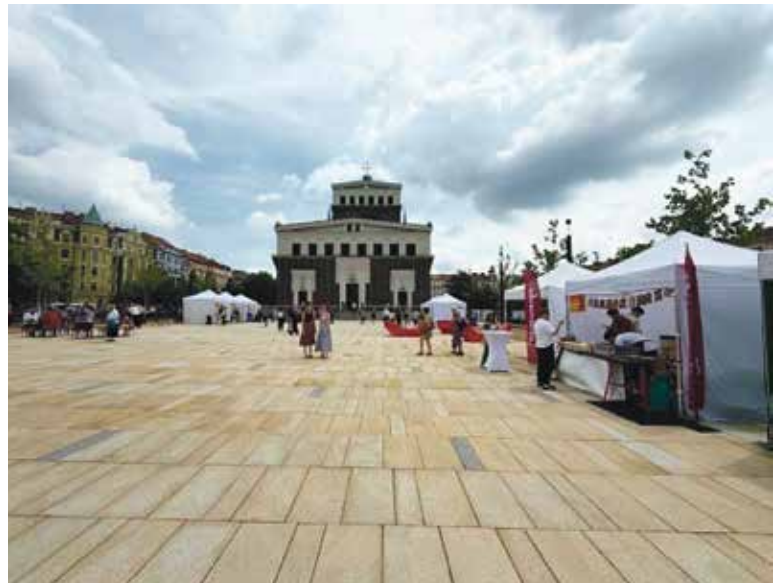
NÁMĚSTÍ je podle názoru zodpovědných architektů nejen upravenější, ale také lépe připravené na horko, sucho i přivalové deště.

„Rekonstrukce náměstí Jiřího z Poděbrad je ukázkou toho, jak má vypadat moderní přestupní uzel 21. století. Nová podoba náměstí nabídne chodcům, cyklistům i všem lidem, kteří sem dorazí za odpočinkem nebo nákupy, bezpečný, přehledný a plně bezbariérový prostor. Mám velkou radost, že se nám podařilo zkoordinovat povrchové úpravy s rozsáhlou modernizační stanicí metra a vybudováním nových výtahů. Díky propustným povrchům, speciálním klimaticky odolným trávníkům a systému pro zasakování a akumulaci dešťové vody bude mít maximální péči i 120 nově