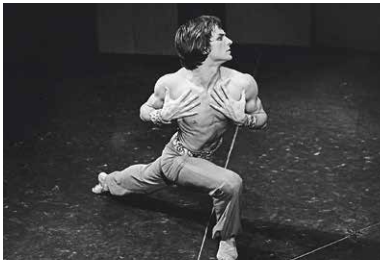
VLASTIMIL Harapes od roku 1966 působil v Baletu Národního divadla, jehož se v roce 1971 stal sólistou.

Vyšehrad – Ve středu 24. června se na Vyšehradském hřbitově uskutečnil pietní akt, při kterém byly do hrobu uloženy ostatky Vlastimila Harapese (24. července 1946 – 15. května 2024), jedné z nejvýznamnějších osobností českého baletního umění. Součástí vzpomínkových akcí je také veřejná sbírka na platformě Donio, jejímž cílem je financovat vznik a instalaci památníku Vlastimila Harapese na tomto hřbitově. Vybrané prostředky budou využity rovněž na dlouhodobou péči o hrobové místo a na vytvoření webové prezentace věnované životu a dílu tohoto muže, který se nesmazatelně zapsal do podvědomí filmových diváků ve stále populárním snímku Jak vytrhnout velrybě stoličku. Sběrka potrvá do 30. září. (red)