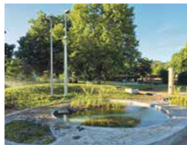
FLUVIZEM láká k zastavení.