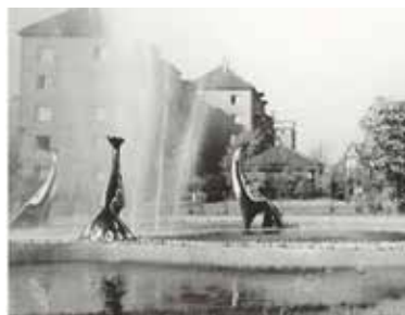
PŮVODNÍ brouzdaliště s pávy z roku 1961, které bylo v 90. letech zrušeno.

Komplexní umělecké pojetí prostoru nabízí nový pobytový prostor s lavicí, vodní plochu s rostlinami v původní fontáně, umělecké pítko či novou cestu, která usnadní trasu od zastávky do ulice U Školičky a zároveň připomene původní cestu podél Rokytky z 19. století. (P9, red)