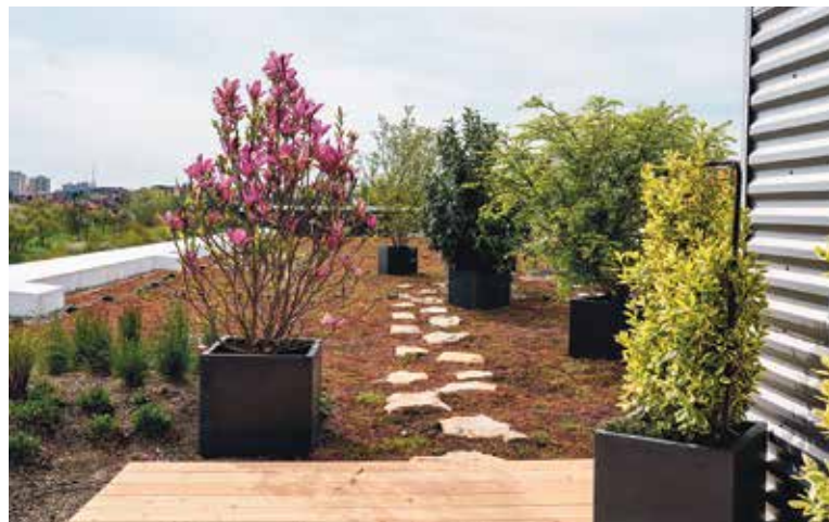
ZAHRADNICE a zahradníci Pražských služeb provádějí pravidelnou kontrolu vlastní zelené střechy zhruba jednou za dva týdny.

Travniny, trvalky a keře jsou tu vítaným pomocníkem, zvláště v horkých měsících. Udržují totiž vlhkost v prostředí, zpomalují odpar dešťové vody a pomáhají s izolací budovy. „Podobných projektů v hlavním městě přibývá. Nedávno jsme se aktivně podíleli na proměně jedné ze střech Křižkovicých pavilonů na Výstavišti na zelené bytové terasy pro