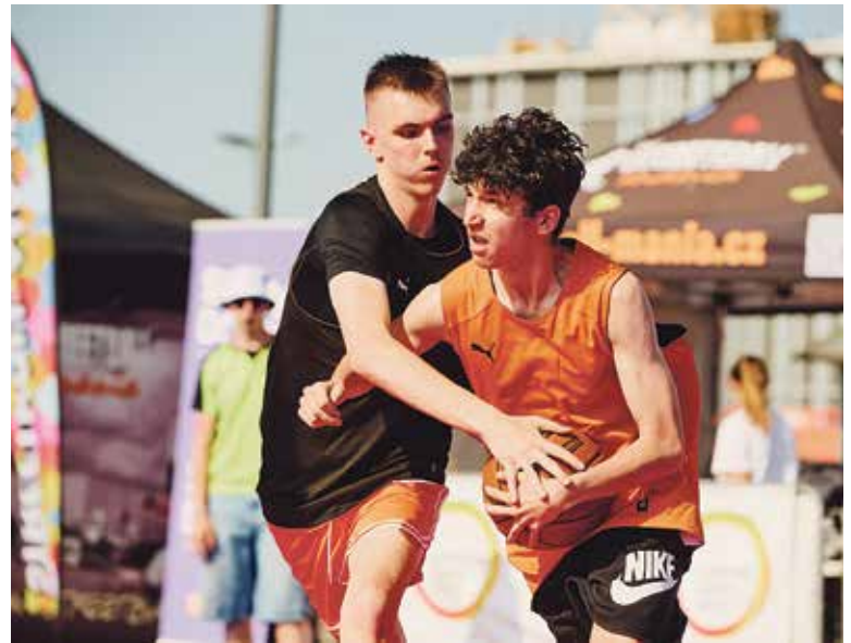
TÝMY se mohou přihlásit do 18. června.

Černý Most – Basketbaloví fanoušci a sportovní nadšenci si nesmí nechat ujít další ročník Streetball manie, která letos slaví úctyhodných 31 let své existence. Ve dnech 20. a 21. června se tradičně utká basketbalová elita na střeše Westfield Černý Most. Během dvou dnů se zde představí a o titul zaboují nejlepší týmy z celé země v rámci pražského kola, a především v nedělním napínavém republikovém finále. Tento projekt, který před třemi dekádami vznikl v Děčíně, hostil již více než 180 turnajů po celé České republice a přibližuje městskou formu basketbalu. V roce 2015 se Streetball mania do tehdejšího Centra Černý Most vrátila po jeho modernizaci a navázala tím na dlouholetou tradici, kterou zde započala již v roce 1999. (CČM, red)