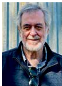
MICHAL Prokop je český rocker, bluesman a bývalý politik.