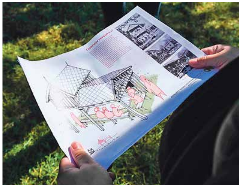
TAKTO by měla vypadat obnovená venkovní učebna.

Na místě historické farmy nyní vznikne obnovená venkovní učebna, která nabídne zázemí školám, dětem i veřejnosti. Prostor bude sloužit nejen