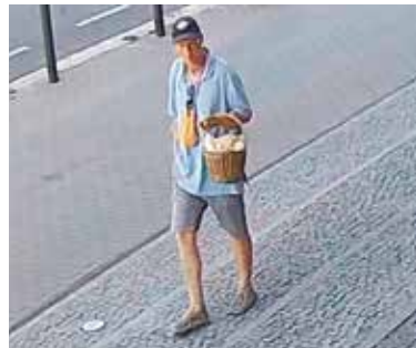
S TÍMTO „hodným“ pánem by si policisté rádi popovídali...

Policisté šetřením zjistili, že se mělo jednat o muže ve věku kolem čtyřiceti let s krátkými světlými