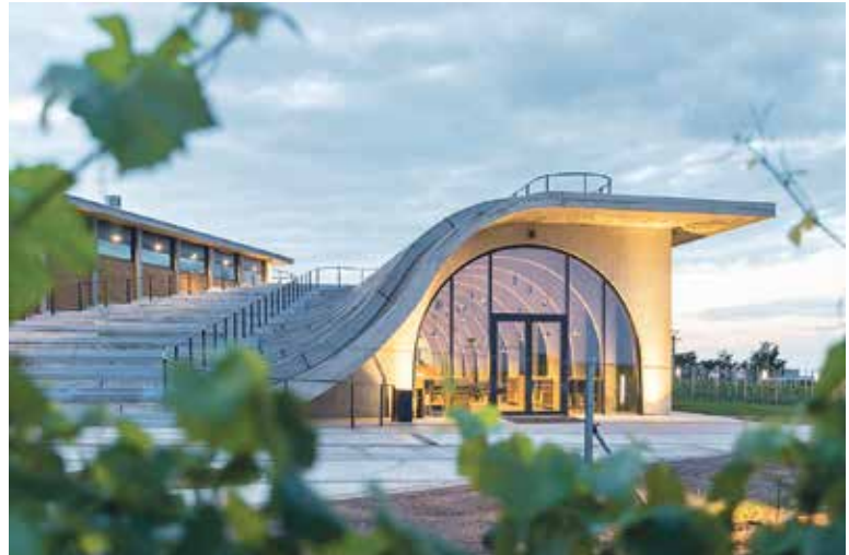
JEDNA z možných budoucích podob holešovické stanice.

Holešovice – Okolí stanice Nádraží Holešovice, kterým denně projdou desetitisíce lidí, a které dnes patří k nejzanedbanějším místům širšího centra Prahy, čeká zásadní proměna. Do závěrečného kola mezinárodního urbanisticko-architektonického workshopu postoupilo pět studií: tři zahraniční a dvě česká. Porota tak vybrala jak týmy, které mají zkušenosti z velkých evropských městských projektů, tak ty s důvěrnou znalostí pražského prostředí. Vítězný koncept pro projekt Nové Holešovice se stane východiskem pro budoucí podobu celého území. Cílem soutěže je vytvořit živé městské prostředí s kvalitním veřejným prostorem, lepší dostupností a přehledným propojením jednotlivých druhů dopravy. Součástí zadání jsou mimo jiné