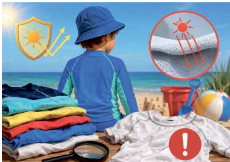
VYSOKÉ koncentrace bisfenolů, které jsou spojovány s negativními dopady na vývoj dětí, odhalila laboratoř v tričkách značek Nordblanc, Takko a Tchibo. Ilustrace: AI

Řada výrobků nedosáhla ani minimální doporučené ochrany UPF 30, kterou odborníci považují za základ pro dětské ochranné oděvy. Nedostatečné hodnocení si kvůli nízkému UV faktoru odnesly značky Primark, Quicksilver, Reserved, Takko, Wouki i výrobky z platform Temu a Shein. Nejhůře dopadlo bílé tričko Quicksilver, které navzdory deklarovanému faktoru 50+ poskytlo ochranu pouze UPF 15. Zdroj: dTest