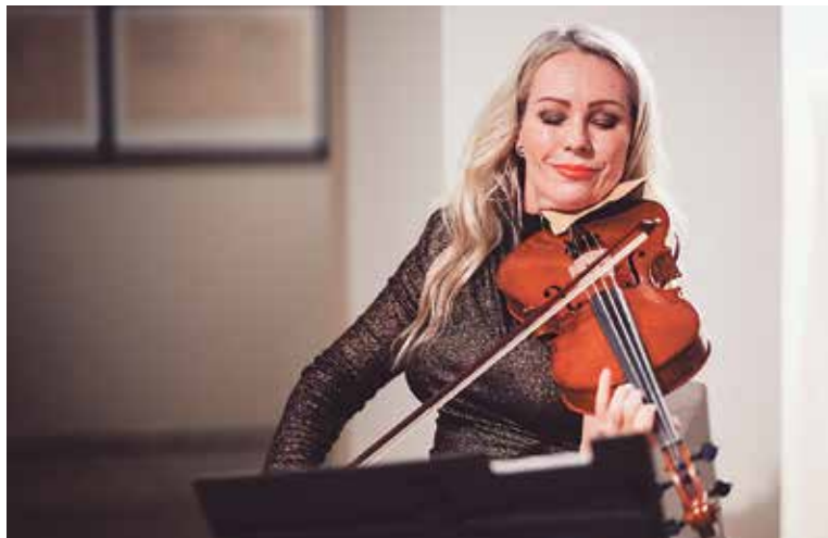
„ HUDBA je řehole, kterou bez hlubokého zanícení prostě nelze zvládnout, “ říká první dáma české violy.

Co vám pomohlo neztratit sebevědomí v těžkých časech? S každou zvládnutou situací sebevědomí roste. Hodně mi pomohlo duchovní hledání. Věci,