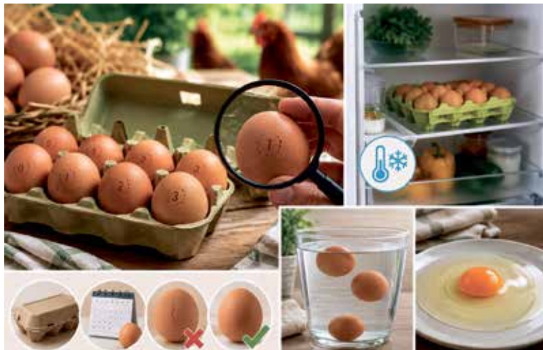
PŘI skladování citlivých potravin, jakými jsou vejce, jsou spolehlivé chlazení a stabilní teplota naprostým základem. Ilustrace: AI

Čerstvost vajec si můžete jednoduše ověřit i doma. Nejznámější je test s vodou – pokud vejce po vložení do nádoby klesne ke dnu, je čerstvé. Starší vejce se začne mírně nadnášet a velmi staré může dokonce plavat na hladině. Mnohé napoví i samotný vzhled po rozklepnutí. Čerstvé vejce má pevný žloutek a hustý bílek, který se neroztéká. Pokud je bílek příliš řídký a žloutek ztrácí svůj tvar, jde o známku toho, že vejce už není v nejlepší kondici. Zdroj: MORA