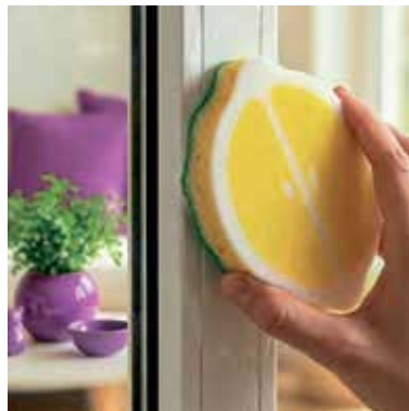
TAHLE houbička zvládne očistit i nepřílnavé pánve, nádoby, pracovní desky, dřezy, dlaždičky a zahradní nábytek.

Snad každý z nás používá kuchyňské houbičky, pro většinu domácností se staly nepostradatelným pomocníkem. Na trhu se nyní objevila novinka jménem Punch ve třech provedeních a vlnách. Zakoupit je lze ve variantě Apple, Orange i Lemon. Každá z nich má svou specializaci, ale všechny spojuje jedno. Čistí bez poškrábání a jejich vůni aktivuje prostým stisknutím. A od stejné firmy Vileda se po tříleté odmlce opět vrací na pulty velice oblíbený žlutý hadřík na okna s maximální savostí. Nabízí výhodu 3 v 1 – čistí, suší a leští jediným tahem bez nutnosti použití chemikálií. (md)