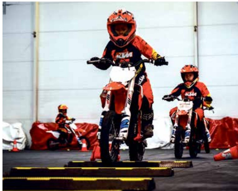
MALÉ elektrické motorky jsou přizpůsobené právě dětem – jsou lehké, bezpečné a velmi dobře ovladatelné.

Pitland ale není jen pro dospělé. Velmi oblíbené jsou také dětské moto kurzy, které umožňují dětem bezpečně poznat svět