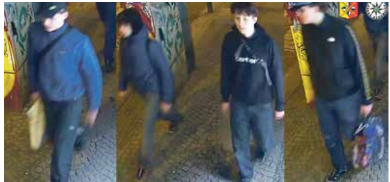
TITO MLADÍCI jsou podezřelí ze spáchání trestného činu poškození cizí věci, za což jim v případě dopadení a odsouzení hrozí až tříletý pobyt za mřížemi.

Letná – Skupina mladých mužů poškodila zeď v Letenských sadech, a to tak, že na ni nasprejovali několik nápisů v celkové délce bezmála pánácti metrů. K poškození došlo 6. dubna mezi půlnocí a jednou hodinou ranní a způsobená škoda byla předběžně odhadnuta na jeden milion korun. Policisté s kriminalisty zajistili kamerové záznamy a jejich vyhodnocením zjistili, že celý skutek mají na svědomí čtyři mladí muži, po kterých začali okamžitě pátrat. Kamery je zachytily i na zastávce MHD, kde je jejich podoba velmi dobře zachycena. Jelikož se je kriminalistům do současné doby