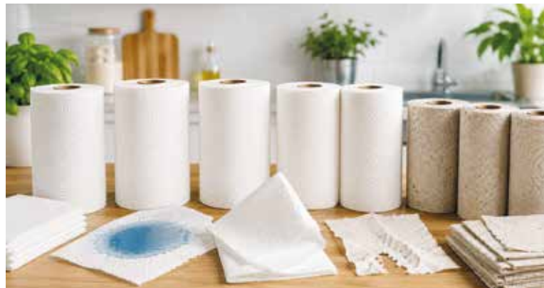
TESTY ukázaly, že chemikáliemi mohou být zatíženy především recyklované výrobky.

Významnou část testu tvořilo mikrobiologické a chemické hodnocení. Laboratoř zjistila, že část papírových utěrek obsahovala vysoké množství bakterií. U šesti výrobků bylo množství aerobních