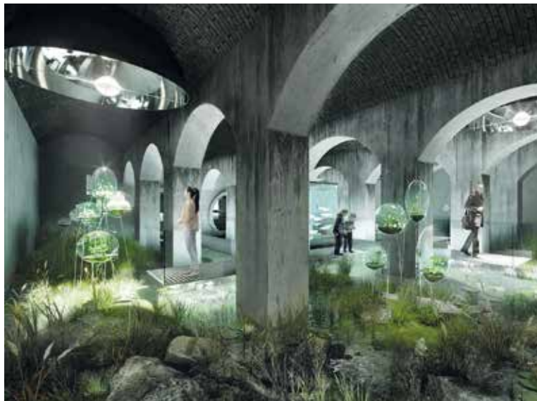
V PŘÁVĚ rekonstruovaném areálu bývalé Vinohradské vodárny vznikne unikátní vodárenské osvětové centrum Hydropolis.

Oproti původnímu plánu došlo k mírnému zpoždění prací, nicméně se předpokládá zahájení instalace expozice ve vodojemu do konce roku a slavnostní otevření veřejnosti na podzim roku 2027. „Hydropolis není jen rekonstrukce unikátní technické památky, ale také příležitost ukázat veřejnosti, co všechno stojí za tím, než po otočení kohoutkem začne téct pitná voda,“ dodal pražský náměstek pro oblast infrastruktury Michal Hroza (TOP 09). (PVS, red)