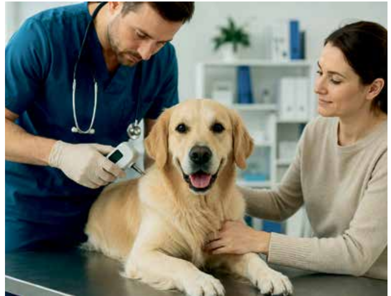
VETERINÁRNÍ lékař není povinen automaticky registrovat psa při jeho ošetření, chovatel o to musí požádat. Ilustrace: AI

ČR – CEP je státní registr, který pomáhá chránit zdraví zvířat i veřejnosti a usnadňuje vyhledání ztracených psů. Chovatel musí zajistit zápis psa při označení štěněte mikročipem před předáním novému majiteli nebo nejpozději při nejbližším očkování nebo přeočkování proti vzteklině. Po objednání a uhrazení služby veterinární lékař provede zápis do registru nejpozději do 7 pracovních dnů. Poplatek za zápis do CEP hradí chovatel veterinárnímu lékaři a zápis není automatický – chovatel musí o tuto službu veterinárního lékaře požádat! Některé údaje, například kontaktní informace a jejich změnu nebo oznámení ztráty psa, může do systému zadat i majitel zvířete. Za správnost a aktuálnost všech