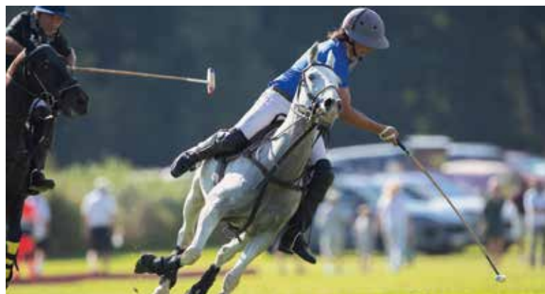
KOŇSKÉ pólo má v českých zemích historické kořeny sahající do období česko-rakouské šlechty. Jeho moderní rozvoj však začal až v posledních dvou desetiletích.

■ Praha se v létě stane poprvé hostitelem Royal Golf & Polo Cup, který se uskuteční 8. srpna v areálu Prague City Golf na Zbraslavi. Tento jedinečný turnaj spojuje golf a koňské pólo a přivede do české metropole mezinárodní účast z řad nejlepších profesionálních hráčů póla z celého světa. Divákům v sobotu nabídne inovativní formát zápasů i doprovodný program.