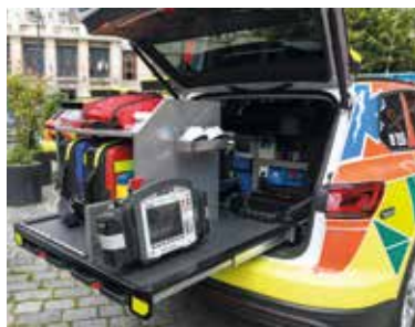
ZÁSTAVBA vozidla zároveň umožňuje vhodnější uložení zdravotnického vybavení, například přístroje LUCAS, který slouží pro automatické stlačování hrudníku pacientů při resuscitaci.

Praha – Výjezdové skupiny rychlé lékařské pomoci začnou v Praze