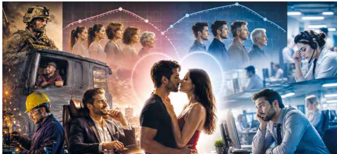
I KDYŽ hladina testosteronu u mužů začíná klesat již od jejich třicátých let, studie naznačuje, že mužské libido ještě zhruba deset let dále roste. Ilustrace: AI

Vztahový status měl také rozdílný vliv podle pohlaví. „Muži v partnerských vztazích uváděli vyšší libido než single muži, zatímco u žen byl trend opačný – svobodné ženy hlásily vyšší sexuální touhu než ženy v partnerství,“ popsala Lucie Slováčková. (RS, red)