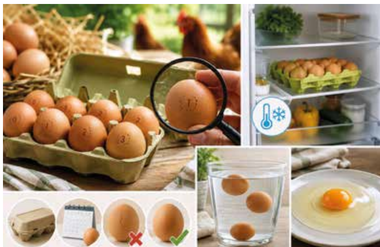
PŘI skladování citlivých potravin, jakými jsou vejce, jsou spolehlivé chlazení a stabilní teplota naprostým základem. Ilustrace: AI

Čerstvost vajec si můžete jednoduše ověřit i doma. Nejznámější je test s vodou – pokud vejce po vložení do nádoby klesne ke dnu, je čerstvé. Starší vejce se začne mírně nadnášet a velmi staré může dokonce plavat na hladině. Mnohé napoví i samotný vzhled po rozklepnutí. Čerstvé vejce má pevný žloutek a hustý bílek, který se neroztéká. Pokud je bílek příliš řídký a žloutek ztrácí svůj tvar, jde o známku toho, že vejce už není v nejlepší kondici. Zdroj: MORA