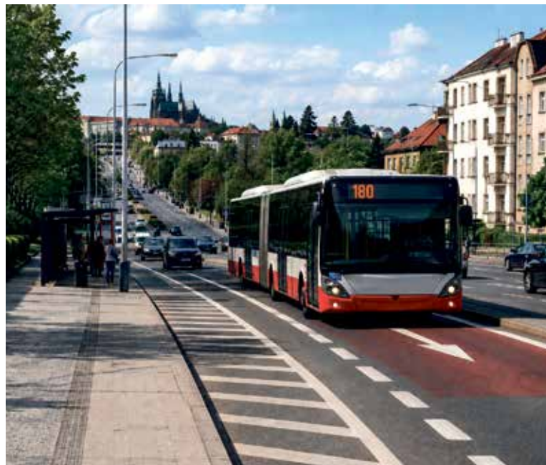
AUTOBUSY by nově měly jezdit vyhrazeným pruhem. Ilustrace: Al

zeleného pásu, takže nedojde k omezení stávající kapacity pro osobní automobily. Součástí návrhu je také úprava zastávek, u kterých budou stávající zastávkové zálivky zaslepeny. Autobusy tak budou zastavovat přímo v jízdním pruhu, což jim umožní přesnější a plynulejší přistavení k nástupní hraně, a pro cestující to přinese pohodlnější i bezbariérový nástup a výstup.