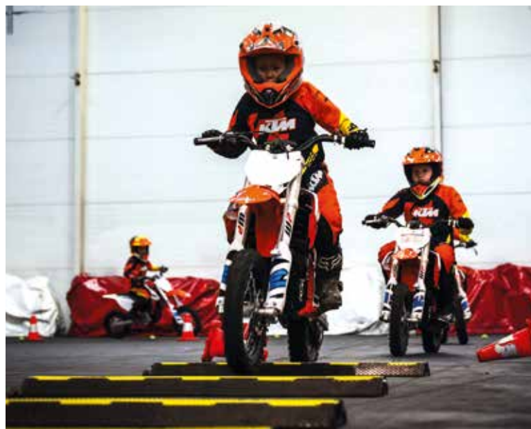
MALÉ elektrické motorky jsou přizpůsobené právě dětem – jsou lehké, bezpečné a velmi dobře ovladatelné.

Pitland ale není jen pro dospělé. Velmi oblíbené jsou také dětské moto kurzy, které umožňují dětem bezpečně poznat svět