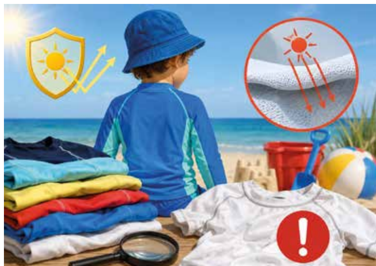
VYSOKÉ koncentrace bisfenolů, které jsou spojovány s negativními dopady na vývoj dětí, odhalila laboratoř v tričkách značek Nordblanc, Takko a Tchibo. Ilustrace: AI

Řada výrobků nedosáhla ani minimální doporučené ochrany UPF 30, kterou odborníci považují za základ pro dětské ochranné oděvy. Nedostatečné hodnocení si kvůli nízkému UV faktoru odnesly značky Primark, Quicksilver, Reserved, Takko, Wouki i výrobky z platformy Temu a Shein. Nejhůře dopadlo bílé tričko Quicksilver, které navzdory deklarovanému faktoru 50+ poskytl ochranu pouze UPF 15. Zdroj: dTest