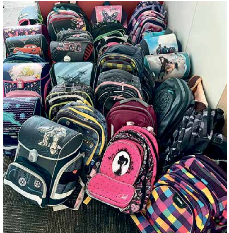
AKTOVKY a školní pomůcky, které si zájemci během konání akce nevyzvednou, budou následně rozděleny mezi charitativní organizace, které o ně projeví zájem.

„Máte-li doma nevyužitou aktovku, přineste ji na radnici a přenechte ji školákovi, kterému přijde vhod. Totéž platí pro penály, pracovní sešity či výtvarné a psací potřeby. Aktovky se u dětí mění s tím, jak rostou nebo jak se vyvíjí jejich vkus. To zná snad každý rodič. Zachovalé aktovky, ale i další věci do školy by ovšem neměly zůstat nevyužité, jestliže v jiných rodinách scházejí. Právě toto řeší naše akce – lidé si navzájem pomohou a zároveň se zachovají hospodárně a ekologicky,“ říká Marián Hošek (KDU-ČSL), místostarosta Prahy 6 pro sociální oblast. (P6, red)