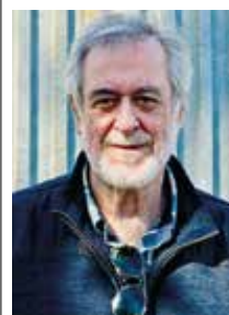
MICHAL Prokop je český rocker, bluesman a bývalý politik.