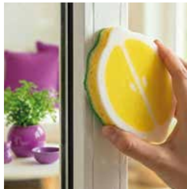
TAHLE houbička zvládne očistit i nepřílnavé pánve, nádobí, pracovní desky, dřevy, dlaždičky a zahradní nábytek. Foto: Vileda

Snad každý z nás používá kuchyňské houbičky, pro většinu domácností se staly nepostradatelným pomocníkem. Na trhu se nyní objevila novinka jménem Punch ve třech provedeních a vlních. Zakoupit je lze ve variantě Apple, Orange i Lemon. Každá z nich má svou specializaci, ale všechny spojuje jedno. Čistí bez poškrábání a jejich vůni aktivuje prostým stisknutím. A od stejné firmy Vileda se po tříleté odmlce opět vrací na pulty velice oblíbený žlutý hadřík na okna s maximální savostí. Nabízí výhodu 3 v 1 – čistí, suší a leští jediným tahem bez nutnosti použití chemikálií. (md)