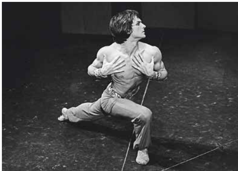
VLASTIMIL Harapes od roku 1966 působil v Baletu Národního divadla, jehož se v roce 1971 stal sólistou.

Vyšehrad – Ve středu 24. června se na Vyšehradském hřbitově uskutečnil pietní akt, při kterém byly do hrobu uloženy ostatky Vlastimila Harapese (24. července 1946 – 15. května 2024), jedné z nejvýznamnějších osobností českého baletního umění. Součástí vzpomínkových akcí je také veřejná sbírka na platformě Donio, jejímž cílem je financovat vznik a instalaci památníku Vlastimila Harapese na tomto hřbitově. Vybrané prostředky budou využity rovněž na dlouhodobou péči o hrobové místo a na vytvoření webové prezentace věnované životu a dílu tohoto muže, který se nesmazatelně zapsal do podvědomí filmových diváků ve stále populárním snímku Jak vytrhnout velrybě stoličku. Sběrka potrvá do 30. září. (red)