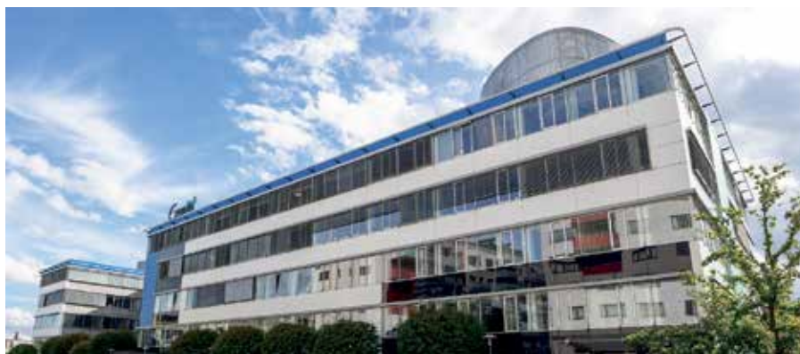
Budova oční kliniky Gemini v pražských Stodůlkách

Nedostatek kapacit státních očních ordinací začínají suplovat ty soukromé. Nově se ambulance všeobecného očního lékařství otevírají v pražských