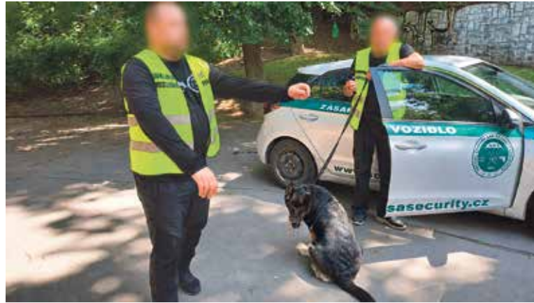
HLÍDCE pomáhá udržovat pořádek také fenka Ziva.

Nová bezpečnostní agentura vzešla z výběrového řízení, které před časem vypsal smíchovská radnice. Zvítězila firma SCSA Security. „Chceme, aby se lidé v Praze 5 cítili dobře a bezpečně – ať už tráví čas s rodinou, sportují, nebo jen odpočívají v zeleni,“ konstatoval starosta Prahy 5 Lukáš Herold (ODS). Firma zajišťuje pravidelný dohled a dokáže pružně reagovat na aktuální dění v terénu. „Věřím, že tento krok přispěje ke kultivaci