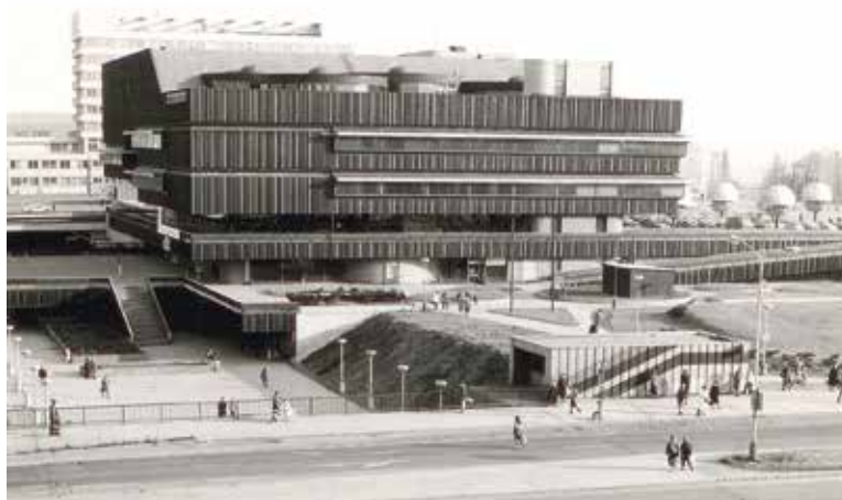
ZADÁNÍ soutěže předpokládá zachování budovy obchodního domu DBK, který byl postaven v roce 1981 podle návrhu architektky Věry Machoninové.

Koncepce má za úkol zohled- nit a vyváženě propojit záměry hlavního města, městské části Praha 4 a zadavatele soutěže, kterým je společnost BP Ol- brachtova, s.r.o. Ta je spoluvlast- něna společnostmi DBK Praha a.s. a Penta Real Estate, které jsou většinovým vlastníkem řešeného území. Hlavní město je