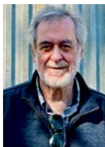
MICHAL Prokop je český rocker, bluesman a bývalý politik.