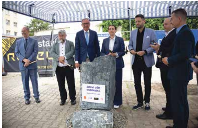
POKLEPÁNÍ na základní kámen provedli pražští politici.

Modřany – Představitelé hlavního města a městské části Praha 12 poklepáním na základní kámen zahájili stavbu bytového domu Modřanská. Pě-