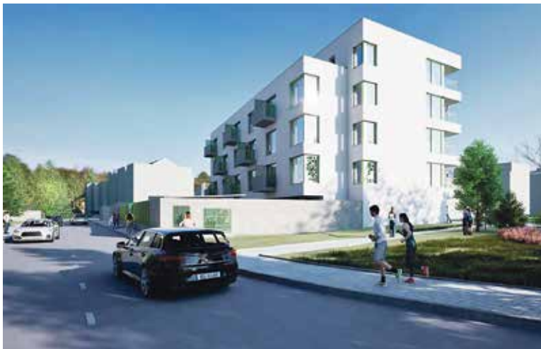
VIZUALIZACE nového bytového domu.