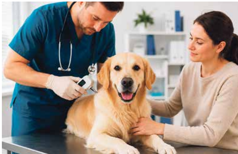
VETERINÁRNÍ lékař není povinen automaticky registrovat psa při jeho ošetření, chovatel o to musí požádat. Ilustrace: Al

Do CEPu budou mít přístup veterinární lékaři, veterinární univerzita, Státní veterinární