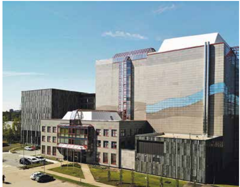
ZA PŘÍZNIVÉHO počasí se všem, kteří zdolají 11 pater v budově archivu, nabídne nevšední vyhlídka na Prahu.

Prohlídky pro skupiny 10 a více osob je nutné předem rezervovat (tel. 236 004 095, 236 004 017). Bezbariérový přístup je možný pouze do badatelské a konferenční sálu, kde bude probíhat dětský program. Omezený počet parkovacích míst je k dispozici na parkovišti u budovy Archivu hl. města Prahy. Vstup na akci je zdarma. Více informací na ahmp.cz . (red)