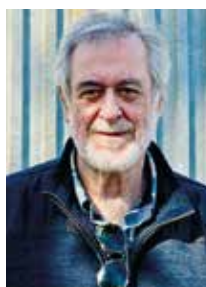
MICHAL Prokop je český rocker, bluesman a bývalý politik.