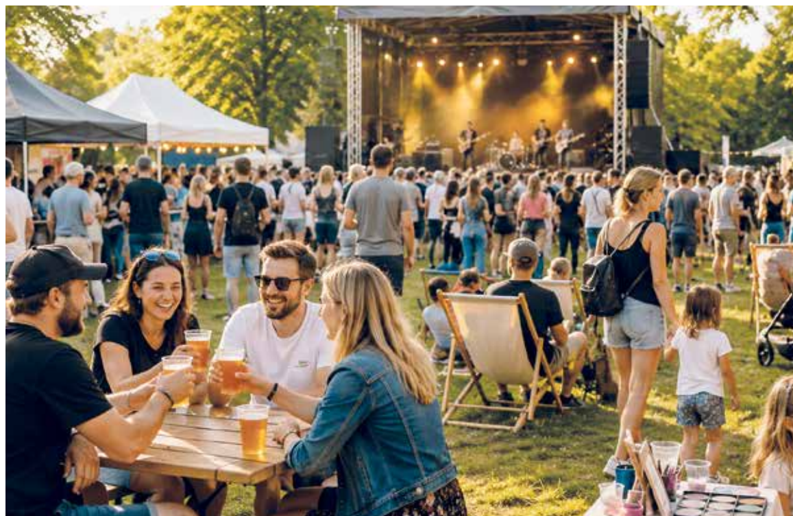
SOUČÁSTÍ programu budou vystoupení hudebních kapel a také pivní soutěže. Ilustrace: AI

hodovou atmosféru. Chceme, aby Praha 10 byla místem, kde lidé tráví čas rádi a kde veřejný prostor skutečně žije,“ doplňuje místostarosta MČ Praha 10 Pavel Šutka (ODS). Kompletní program akce na www.praha10.cz/desitkanadesitce . (P10, red)