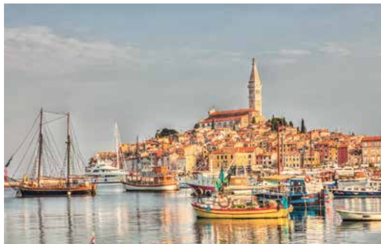
BAREVNÉ domky, úzké kamenné uličky a romantický přístav v Rovinji připomínají atmosféru italských přímořských měst.

Z Prahy se autobusem dostanete přímo do šestnácti oblíbených letovisek na Istrii, v Kvarnerském zálivu i v Dalmácii.