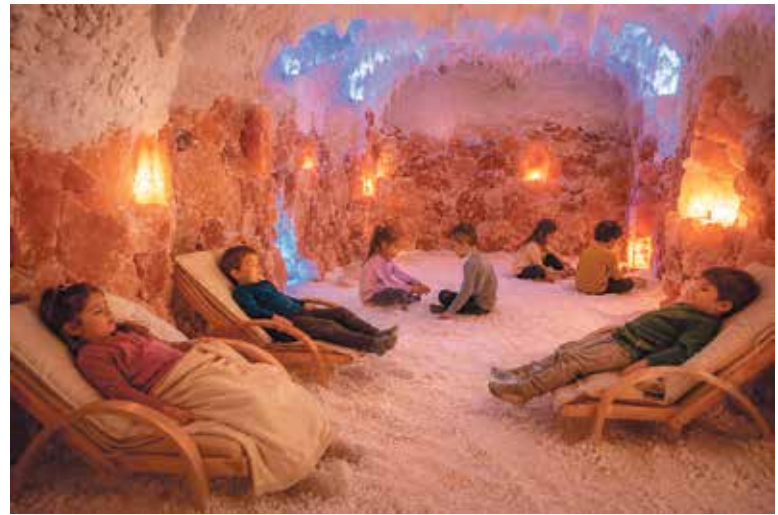
DĚTI TRÁVÍ v jeskyni přibližně 45 minut při relaxační hudbě a tlumeném světle. Ilustrace: AI

Mateřská škola Korycanská je v rámci Prahy výjimečná propojením běžného předškolního vzdělávání s odbornou zdravotní péčí. Do kolektivu přicházejí děti s diabetem, astmatem, alergiemi, atopickým ekzémem i po onkologické léčbě. Díky přítomnosti zdravotních sester přímo ve třídách mohou prožívat běžné dětství bez nutnosti oddělování. Kapacita je 60 dětí.