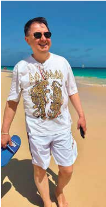
PŘI CHVÍLI odpočinku u moře – daleko od agendy Prahy 11, ale s telefonem stále po ruce.

nespím alespoň sedm hodin denně, špatně funguji. A když si mám opravdu odpočinout, dokážu spát i deset hodin.