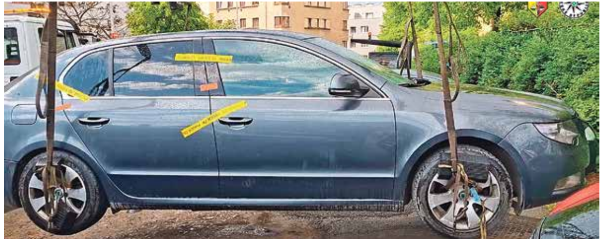
TUTO oktávku řídil násilník.

Kriminalisté z 9. oddělení IV. pražského obvodu – mravnostního oddělení – okamžitě na případu začali pracovat a podařilo se jim vytipovat vozidlo podezřelého. Ten byl vyzván k podání vysvětlení, ale skutek popíral s tím, že v době činu spal