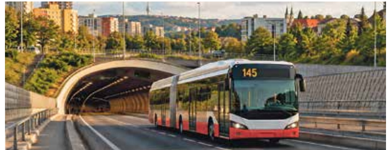
LINKA 145 bude mít parametry standardní páteřní autobusové linky, v pracovních dnech v intervalu 6 minut v ranní špičce a 7 až 8 minut v odpolední. Zajímavým provozním aspektem také bude přednostní nasazování hybridních kloubových autobusů. Ilustrace: Al

V ulici V Holešovičkách pak 145 využije převážně již existující opatření pro linku 201 a pojedě úsekem ve zkušebním provozu expresně. Následně pro sjezd do