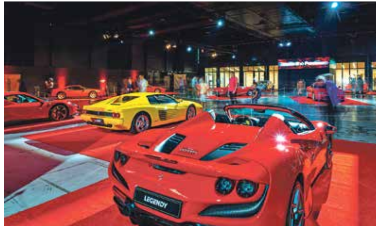
PAVILON Supersportů nabídne doslova pastvu pro oči.

Maminky i všichni milovníci pohody budou mít k dispozici tančírnu BEACH Club u Fontá-