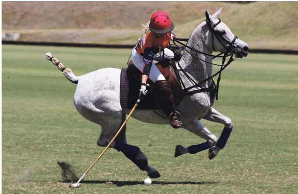
„TO, co na pólu miluju nejvíc, je absolutní napojení na koně, kdy s ním opravdu fungujete jako jeden celek,“ říká zkušená hráčka.

V srpnu představíte na Zbraslavi koňské pólo. Proč právě tento u nás zatím okrajový sport?