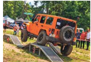
NEBUDOU chybět ukázky off-roadů.

Rover Clubu svezou celé rodiny ve svých speciálech – bezpečně a s úsměvem. Těšit se můžete také na aktivní mini bikepark od Hot Wheels a velké zóny RC modelů k obdivu i vyzkoušení. Škoda Auto připraví velkou dětskou zónu plnou zábavy, soutěží a chytré edukace. Jeep Club bude zdarma vozit návštěvníky v off-