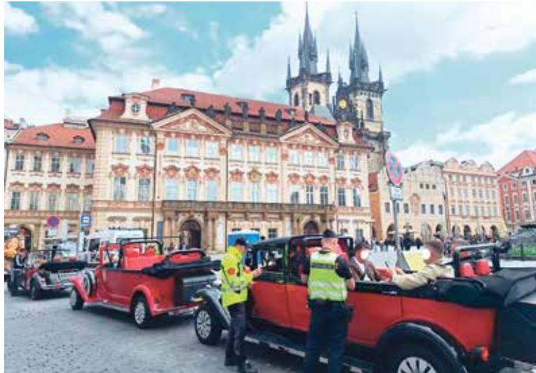
NĚKTERÁ z těchto vozidel nesplňují bezpečnostní standardy pro provoz na pozemních komunikacích.

Kontroloři zkontrolovali v centru Prahy celkem 31 vozi- del, z nichž 25 vykazovalo zá- vady technického stavu. Jednalo se nejčastěji o závady osvětlovacích zařízení, elektrického systému, nehomologované díly, nepo- volené úpravy, výčnělky, ostré hrany na karoserii, blatnicích, zrcátkách nebo jiných vnějších částech vozidel, koroze nosných částí karoserie nebo podvozku apod. Proto byla těmto vozidlům omezena technická způsobilost na 30 dní, během nichž musí být závady odstraněny a následně provedena opakovaná technická prohlídka na STK.