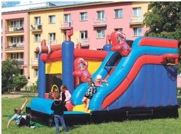
V PRŮBĚHU odpoledne se děti do sytosti vyřádí.

Krč – Domov pro seniory Sulická připravil na sobotu 23. května (14.00–17.00 h.) zahradní slavnost, určenou nejen seniorům, ale také rodinám s dětmi. Hudební část uvedou Frajeři z galérky se staropražskými šlágry a dalšími známými a už zlidovělymi písněmi. Se svými hity z 80. let vystoupí popové duo Kamelie a celé odpoledne bude moderovat známá televizní tvář Alexander Hemala. Pro děti jsou připraveny pestré aktivity, do kterých se mohou zapojit třeba s prarodiči. Budete si moci zakoupit výrobky seniorů a seniorek a pochutnat si na výborném domácím občerstvení, které připravily podle svých neoblíbenějších receptů klientky domova. Vstup je zdarma, info na www.domov-sulicka.cz . (red)