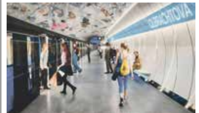
STANICE Olbrachtova by se mohla přejmenovat na Ryšánka.

Praha – Místopisná komise rady Prahy doporučila pražským radním přejmenovat některé stanice budované linky metra D. Náměstí Bratří Synků se má nově jmenovat Nusle, Olbrachtova Ryšánka, Nové Dvory Tempo a Písnice Sídliště Písnice. Konečná stanice nové linky, označovaná jako Depo Písnice, by měla také změnit název. Rozhodující slovo ale bude mít vedení hlavního města. Rozpaky vzbuzuje například zastávka Tempo, která je podle odborníků z ROPIDu z pohledu orientace cestujících problematická. Každopádně je už nyní jasné, že na stanici Olbrachtova se z metra vystupovat nebude. Kritikům tohoto názvu se totiž nelíbilo, že měla nést název po novináři, spisovateli a komunistovi Ivanu Olbrachtovi, který se po druhé světové válce aktivně zúčastnil nástupu komunistů k moci. (red)