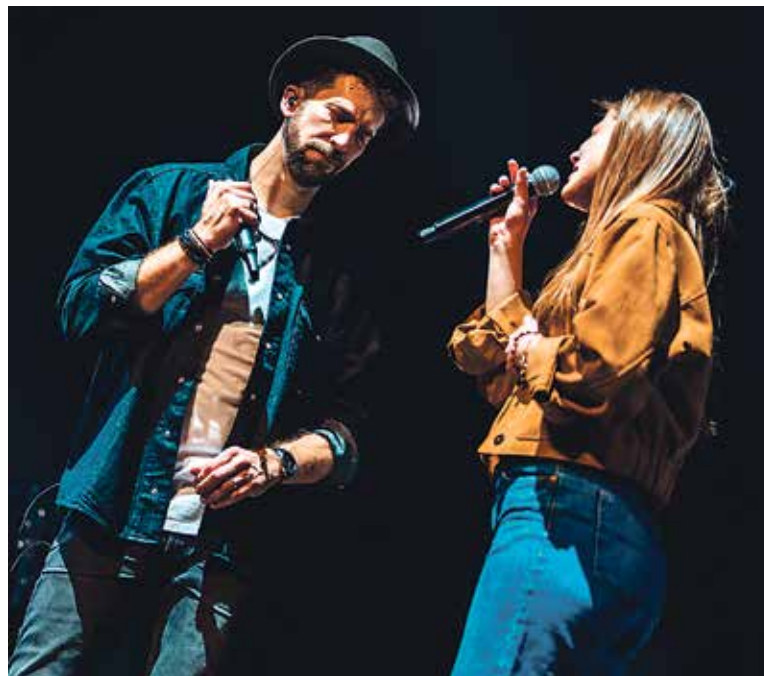
MLADÁ ZPĚVAČKA bude opět součástí turné skupiny Jelen.

Mám ji moc ráda a spojenou hlavně s hudbou – jezdím sem