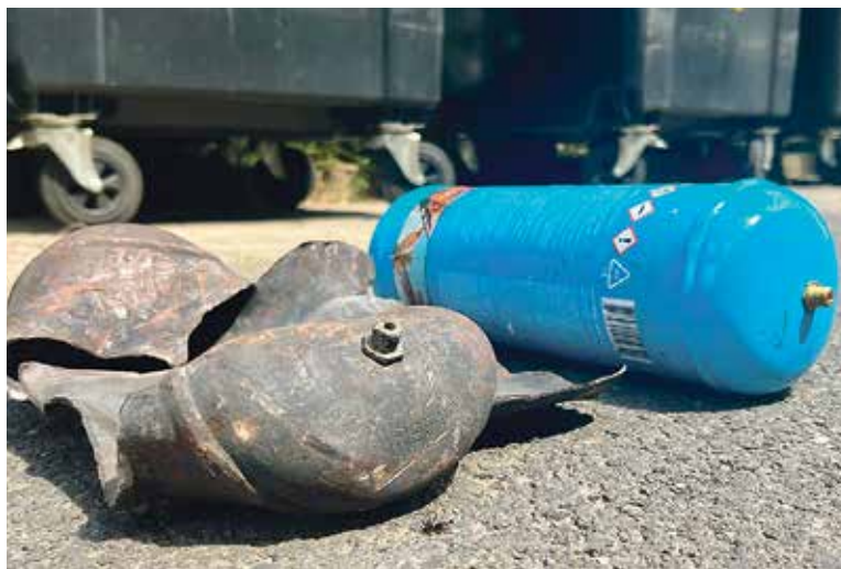
TAKTO vypadá velká tlaková bomba po výbuchu v malešické spalovně.

Exploze velkých tlakových lahví mají na technologie ZEVO Malešice devastační účinky. I když ne každý výbuch znamená okamžitě odstavení kotle, otřesy dras-