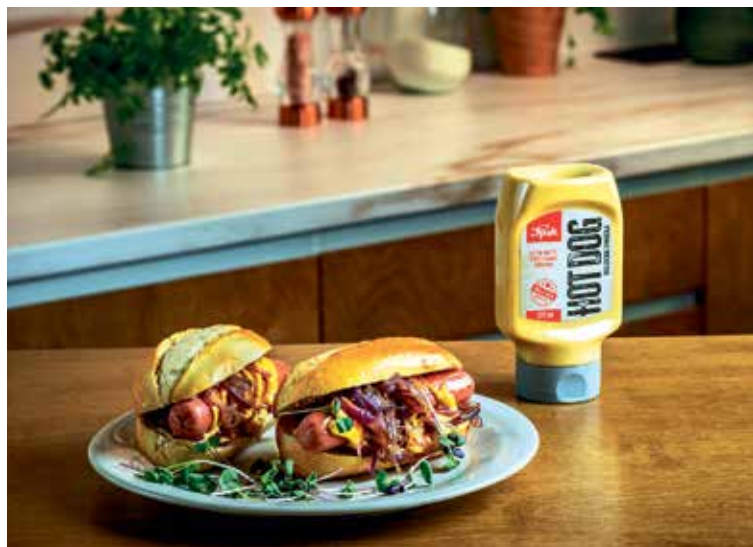
DOBŘÍ hot dog spolehlivě zažene hlad.

Cibuli nakrájejte najemno. V pánvi nechte rozpustit máslo. Přidejte cibuli a opečte ji. Když je cibule měkká, přidejte cukr, listky tymiánu, promíchejte a cibuli nechte trochu zkaramelizovat. Párky opečte na trošce oleje dozlatova. Nakonec ji jemně osolte a opepřete. Bagetky nakrojte a na spodní část naneste trochu omáčky. Přidejte cibuli, pak párek, a nakonec opět trochu omáčky a cibuli. Ihned podávejte. Zdroj: SPAK