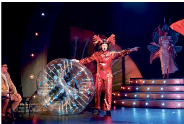
OHNĚ, latex, hipohopový rap, obří Beruška i čmelák, hudba Beethovena i Ledeckého, bortící se divadlo a hohniválové žonglující s koulí přímo na scéně, to vše nabízí hudební komedie Zapomeňte na Shakespeara!

„Hamlet, Galileo, Iago... Chuť na hudební komedii z divadelního prostředí ve mně zrála více než dvacet let. A jsem rád, že jsem si počkal. Dvacet let jsem sbíral všechny zásadní momenty divadelní magie na scéně i v zákulisí, abych vám je teď