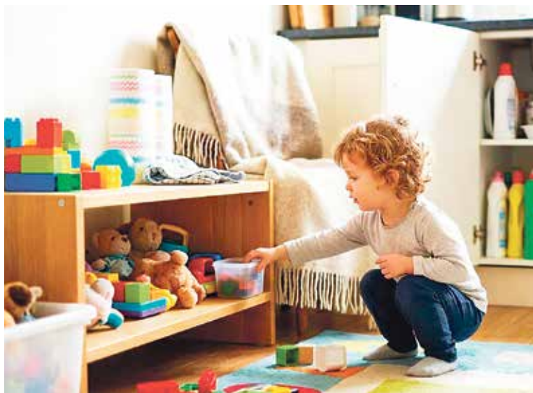
VYVÍJEJÍCÍ se dětský organismus je náchylnější ke změnám v důsledku působení toxických látek, zejména k narušení hormonální regulace. Ilustrace: AI

Příručka věnuje zvláštní pozornost také dětem, které jsou vůči chemické zátěži citlivější. „Nejcitlivější skupinou vůči nebezpečným látkám jsou děti. A to jednak kvůli nižší tělesné hmotnosti, jednak kvůli snazšímu vstupu látek do organismu, například proto, že děti častěji dýchají ústy a mají tenčí kůži,“ upozorňuje Hoffmannová. Čtenáři se také dozvědí, proč se nevyplatí opakovaně zahřívát jídlo v jednorázových obalech, z čeho všeho se vlastně skládá domácí prach, jak zlepšit kvalitu vzduchu v bytě nebo na co si dát pozor při výběru kosmetiky. Brožuru si můžete zdarma stáhnout z webu dTestu. (dTest, red)