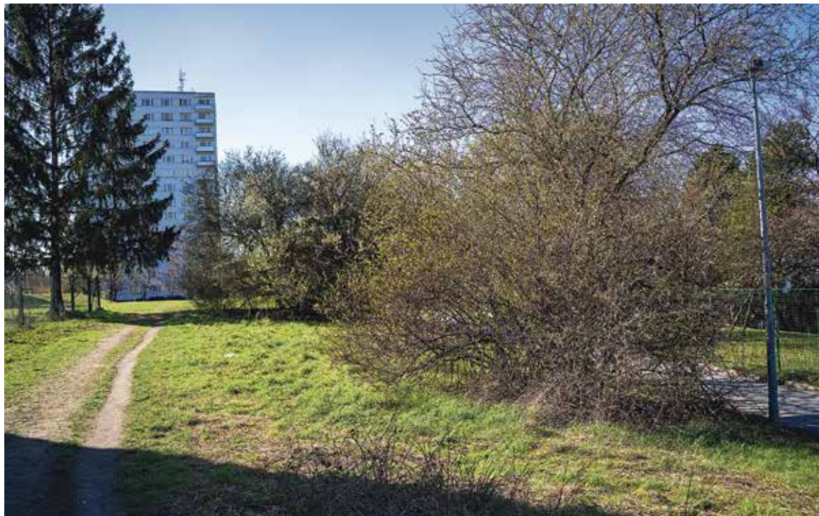
UKÁZKA veřejné zeleně v Praze 10. Městská část spravuje rozsáhlé plochy v hustě zastavěném prostředí, kde se péče o zeleň potýká s náročnějšími podmínkami velkého města.

Strakonice spravují 130 hektarů zeleně a k tomu 8 300 m 2 květinových záhonů. Celý odbor životního prostředí tvoří 14 lidí, z čehož pouze dva se starají o zeleň. Klíčovou osobností je Ing. Jaroslav Brůžek, který na odboru pracuje už 35 let a jehož přístup je založený na osobní odpovědnosti a dlouhodobé vizi. „Údržba zeleně nemůže fungovat bez osobní odpovědnosti a dlouhodobé koncepce. My