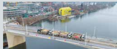
ZATĚŽOVACÍ zkouška dopadla na výbornou a otevření nové spojnice přes Vltavu již nic nebrání.

Č. 914 (noční linka) SMÍCHOVSKÉ NÁDRAŽÍ – Lihovar – Dvorce – Dvorecké náměstí – U Školy – U Háje – Dobeška – U Dobešky – Zemanka – Zelený pruh – Na Planině – Ryšánka – Antala Staška – Poliklinika Budějovická – Budějovická – Brumlovka – Vyskočilova – Jemnická – Hadovitá – Ohradní – Michelská – Pod Jezerkou – Kloboučnická – Ukrajinská – Bohemians – Koh-i-noor – Čechovo náměstí – Kavkazská – Kodaňská – Na Mičáncích – Bělocerkevská – Vlašimská – Orionka – Flora – Olšanské náměstí – Rokycanova – Lukášova – Černinova – Ohrada – Krejčárek – Odlehlá – Skloněná – Novovysočanská – K Žižkovu – Nádraží Libeň – Vysočanská – Nad Jetelkou – Prosek – Nový Prosek – Letňanská – Vystaviště Letňany – Boletická – Rychnovská – Touzimská – Kbelský lesopark – Sportovní centrum Kbely – Bakovská – Kbely – Kbely – Mladějovská – Vinořský zámek – Vinořský hřbitov – Lohenická – VINŮR