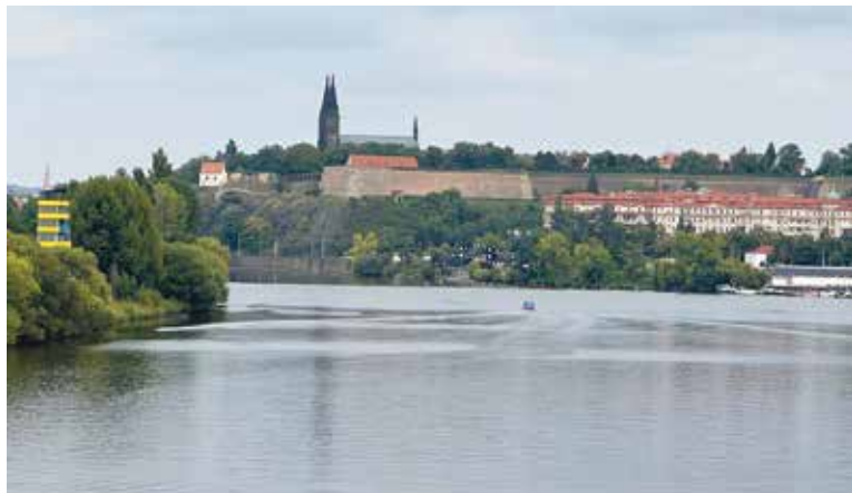
Z NOVÉHO mostu budou mít chodci krásný výhled například na Vyšehrad.

Praha – Nový most představuje nejen významné dopravní propojení Prahy 4 (Podolí) a Prahy 5 (Zlíchov), ale také architektonický a urbanistický prvek, který se stane součástí městské identity. Po dokončení se stane významnou spojnicí pro obyvatele metropole. Sloužit bude městské hromadné dopravě, cyklistům i chodcům, automobilům a nákladním vozům je vjezd zakázán. Celkové náklady na výstavbu včetně světelného parku a úprav okolí se odhadují na přibližně 1,62 miliardy korun bez DPH. S dalšími pracemi včetně vybudování nové