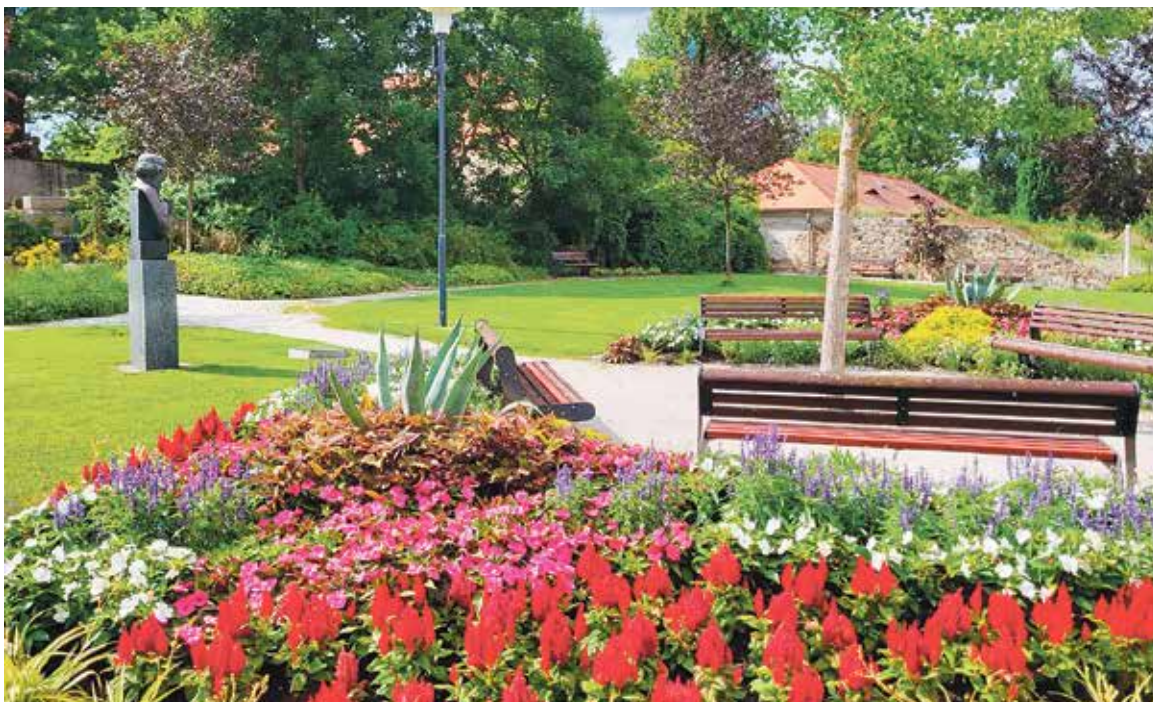
VE STRAKONICÍCH si připadáte jako v rozkvetlé botanické zahradě.

Hlavní město jako celek investuje do veřejné zeleně výrazně více než menší města. Rozpočty jednotlivých městských částí se pohybují v desítkách až stovkách milionů korun ročně. Přesto se kvalita zeleně mezi čtvrtěmi výrazně liší a často neodpovídá tomu, kolik peněz se do ní vkládá. Zmíněná Praha 10 spravuje 135 hektarů veřejné zeleně, tedy prakticky stejnou plochu jako