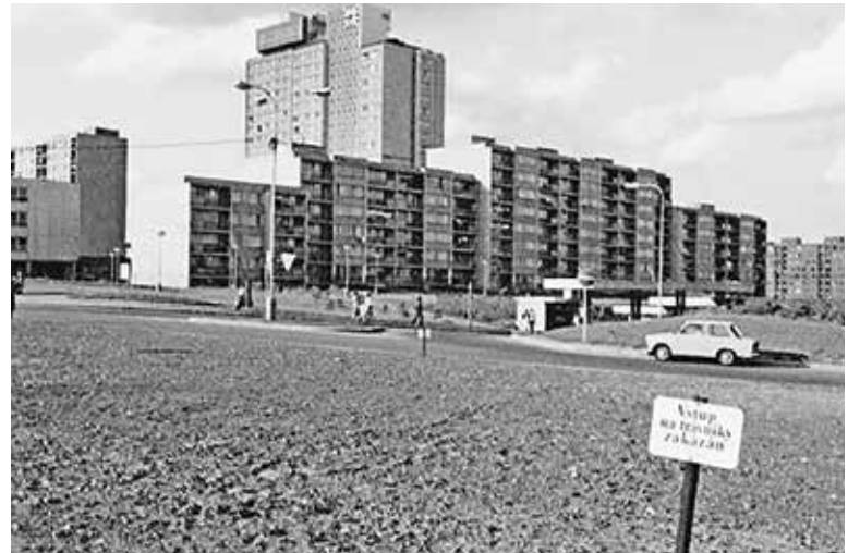
VÝSTAVBA sídliště Háje byla zahájena v roce 1971 jako první etapa Jižního Města.

Jižní Město – Před půl stoletím začal vznikat jeden z největších sídlištních komplexů v Evropě. Vyrostlo Jižní Město, kde dnes žijí desítky tisíc lidí, rozvíjejí své životy a vytvářejí komunitu. U příležitosti 50 let existence sídliště si můžete zahrát zajímavou stopovací hru, která není jen o zábavě. Je to most mezi generacemi, průvodce historií a oslavou našeho domova. Každé místo má totiž svůj příběh a tato hra vám je pomůže objevit! Kromě toho se ti nejlepší soutěžící mohou radovat ze zajímavých výher – v kategorii do 14 let je to pobyt až pro pět osob v Tropical Islands, starší mohou vyhrát 50 000 korun! Info o hře a způsobu přihlášení najdete na www.50let-jiznihomesta.cz . (P11, red)