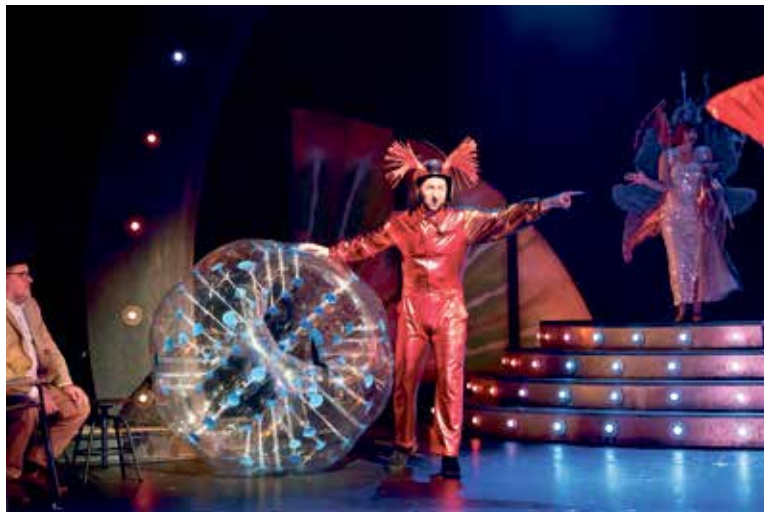
OHNĚ, latex, hipohopový rap, obří Beruška i čmelák, hudba Beethovena i Ledeckého, bortící se divadlo a hohniválové žonglující s koulí přímo na scéně, to vše nabízí hudební komedie Zapomeňte na Shakespeara!

„Hamlet, Galileo, Iago... Chuť na hudební komedii z divadelního prostředí ve mně zrála více než dvacet let. A jsem rád, že jsem si počkal. Dvacet let jsem sbíral všechny zásadní momenty divadelní magie na scéně i v zákulisí, abych vám je teď