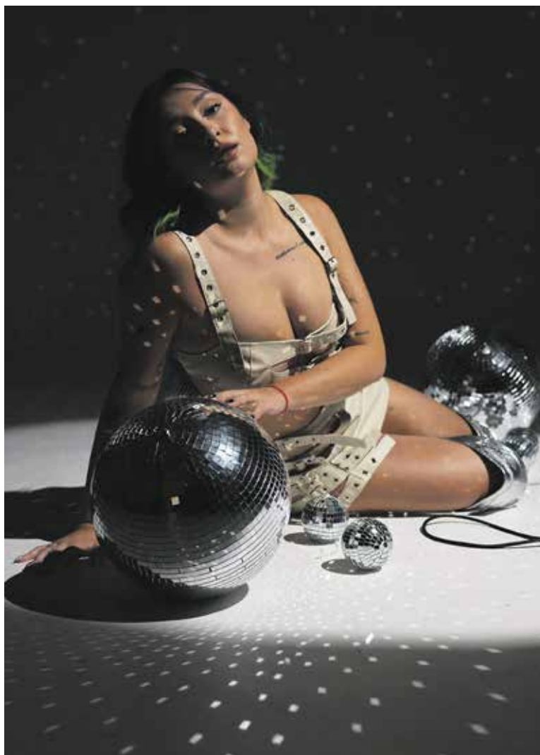
JEJÍ NOVÁ deska zahrnuje nejen taneční písně.

Letná pro mě dlouho znamenala něco jako „až budu velká, chci bydlet na Letné“. Připadalo mi to jako něco víc,