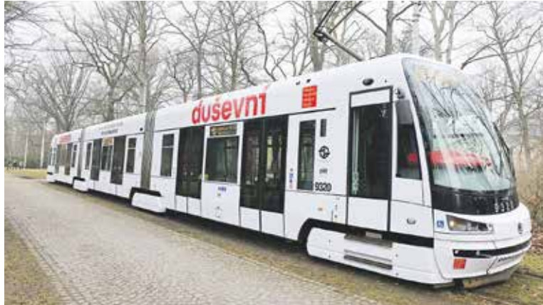
TRAMVAJ jezdí jako linka 17 ze zastávky Výstaviště směrem do centra, dále na Sídliště Modřany a zpět.

Praha – „Každý z nás, kdo nastoupí do tramvaje, si s sebou nese svůj vlastní příběh. Někdo jede vyčerpaný z práce, jiný se stará o dítě, které prochází náročným obdobím, někdo může prožívat poporodní depresi, panické ataky nebo vyhoření. A třeba vedle nás sedí senior, který se po ztrátě partnera cítí osamělý a neví, na koho se obrátit. Bolavé duše většinou nejsou na první pohled vidět, ale zaslouží si stejnou péči jako naše fyzické zdraví,“ uvedla náměstkyně primátora hl. m. Prahy pro oblast sociálních věcí a zdravotnictví Alexandra Udženija (ODS) a dodala: „Právě proto jsme chtěli, aby tato tramvaj lidem ukázala, že v Praze existuje skutečná a dostupná síť pomoci – pro děti, rodiče, seniory a každého, kdo se ocitl v těžké životní situaci nebo prochází obdobím, kdy už toho nese víc, než dokáže sám zvládnout. Prostě pokud cítíte, že toho na vás je příliš, řekněte si o pomoc. Podívejte se na uvedené kontakty, zavolejte,