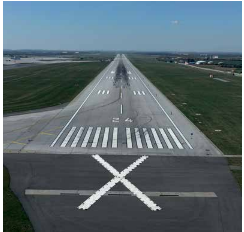
V PRŮBĚHU uzavírky hlavní dráhy budou přílety plánovány převážně směrem na Prahu, vzlety pak směrem na Kladno.