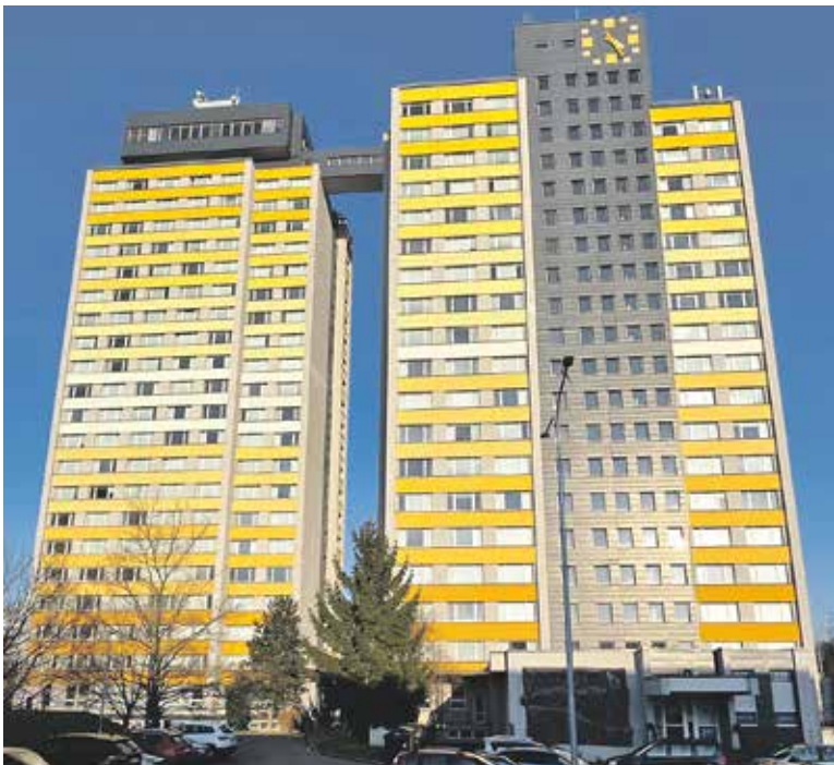
PRAŽSKÁ DVOJČATA určitě nepřehlédnete.

Tak jako Hradčanům vévodí Hrad, Jižnímu Městu dominuje od roku 1980 Ubytovna Kupa u stanice metra Háje. Říká se jí také „pražská dvojčata“, díky originálnímu architektonickému pojetí, kdy jsou dvě věže spojeny unikátním průchozím můstkem. Vyšší věž vybavená velkými hodinami sahá do 23. a nižší do 19. patra. Je