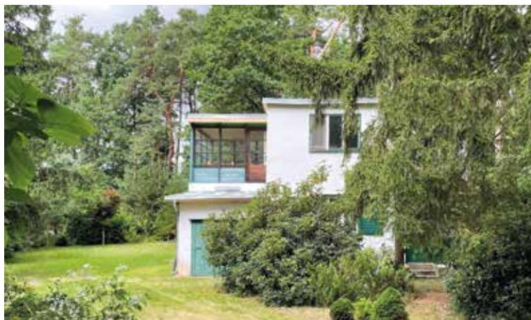
NÁVŠTĚVNÍCI chaty si mohou uvnitř prohlédnout spisovatelovy osobní předměty, jeho křeslo či psací stroj.

Chatu pak Hrabal odkázal sousedům, kteří se o něj starali. Středočeský kraj nemovitost odkoupil v roce 2021 za necelých deset milionů korun a po úpra-