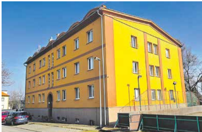
NEJSTARŠÍ PRAŽSKÝ experimentální bytový panelový dům najdete v Dáblicích.

Na tom dáblickém je zajímavá sedlová střecha, ozdobná římsa i barevná omítka, která na některých syrově pojatých pozdějších šedivých panelácích dodnes chybí (stále existují domy bez zateplení s viditelnými čtverci stavebního modulu). V bytech byly podlahy z parket a kazetové stropy, fasáda měla tehdy ale budovatelský háv, dnes je laděná do teplých barev a dům vypadá po rekonstrukci pěkně. Zbylé panely ze stavby byly tehdy použity při stavbě dáblické hvězdárny.