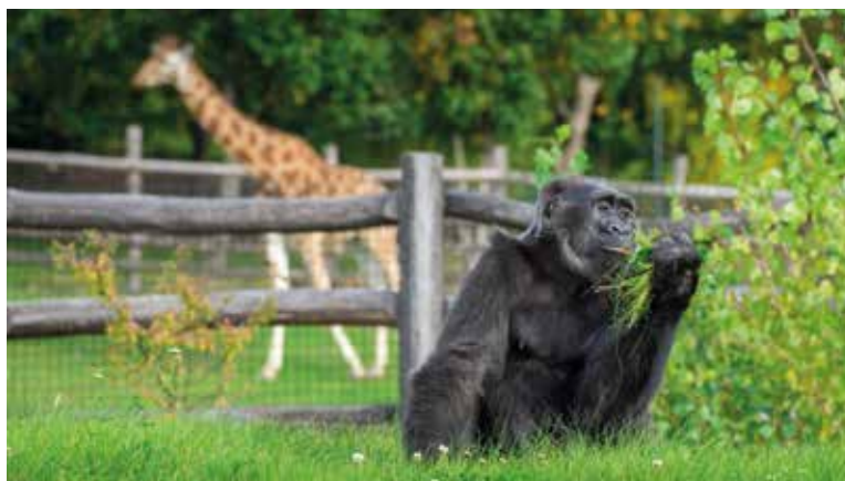
GORILY patří k nevyhledávanějším zvířatům v pražské zoologické zahradě.

Líhnou se, rodí, nebo dokonce vykukují z vaku – zkrátka přicházejí na svět. Zoo Praha vítá mláďata. Některá z nich se narodila ještě během mrazivých měsíců a v těchto dnech poprvé vycházejí do venkovních výběhů. V Darwinově kráteru se už vydává na krátké procházky teprve druhé mládě vombata v Česku, roztomilého vačnatce příbuzného koalům. Mládě chlupatého takina indického objevuje svět v horní části zahrady, v expozičním celku Pláně. Pokud navíc vše půjde dobře,