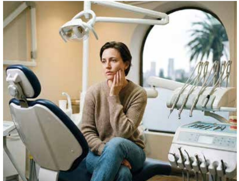
ČEŠTI lékaři nezřídka řeší komplikace způsobené zahraničními kolegy. Ilustrace: AI

Definitivní keramická práce je poté urychleně zhotovena a nasazena na zuby. Častokrát ale na zuby nedosedá přesně,