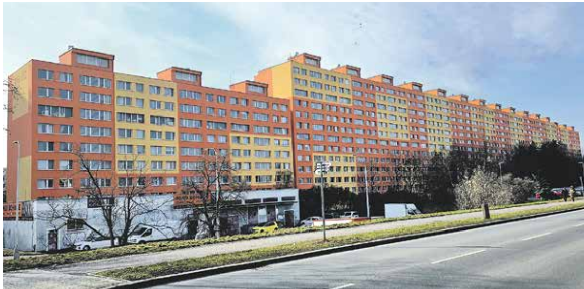
BOHNICKÝ PANELÁK je místními přezdíván Titanik.

to nejvyšší panelová stavba v ČR, a pokud navštívíte restauraci v proskleném 22. patře, nabídně vám z výšky 81 metrů skutečně parádní výhled. Mimochodem, název Kupa vznikl díky původní představě kolektivu architektů postavit objekt kupovitého tvaru, ale nakonec z finančně nákladného projektu sešlo.