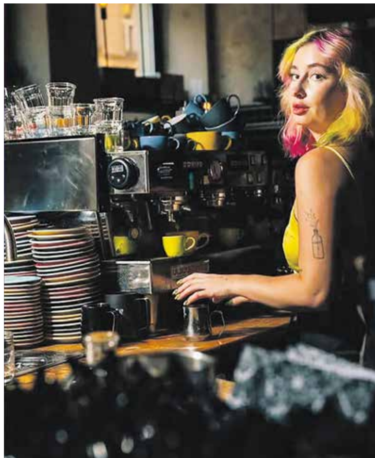
KDYŽ není na pódiu, najdete ji v letenském baru.

Tohle je těžká otázka. Když jsem zpěvačka, nejčastěji mne potkáte v Cobře, protože to je moje full-time práce. Ale když mám volno jak od Cobry, tak i od zpívání, nejraději trávím čas doma. Mám ráda pomalá rána, kdy vím, že nikam nemusím, můžu si v klidu poležet a nic neřešit. Miluju vaření, u toho si vždycky hodně odpočinu. Moc ráda zvu kamarády na návštěvu. Už odmala byl domov místem, kde jsme se scházely s kamarádkami a drbaly po škole. Snažím se toho držet i dnes. Na druhou stranu přiznávám, že jsem paradoxně také hodně ráda sama. Obě moje práce jsou hlavně o komunikaci s lidmi a to je hodně vyčerpávající. Takže pokud mám možnost zavřít se a být sama, vždy toho využiji.