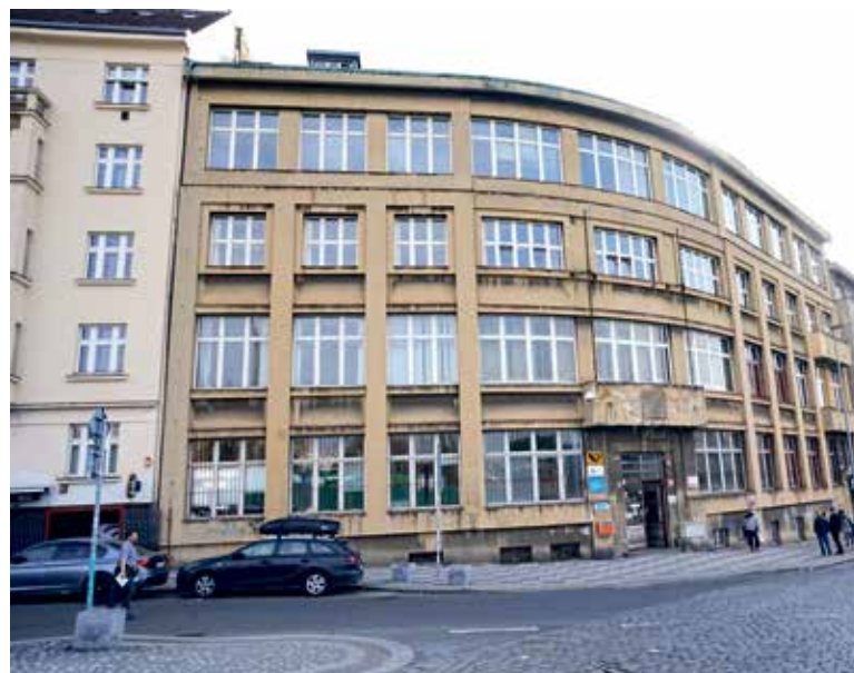
OBJEKT bude před svým budoucím využitím vyžadovat celkovou rekonstrukci. Předběžné odhady počítají s náklady přibližně mezi 150 a 200 miliony korun. Přesný rozsah úprav i harmonogram prací bude vycházet z připravované projektové dokumentace.

V objektu aktuálně působí pobočka České pošty, která zde poskytuje služby veřejnosti. Kraj proto počítá s pokračováním jejího provozu i do budoucna a s Českou poštou jedná o přesunutí jejího zázemí do prvního nadzemního podlaží, aby bylo možné druhé patro v budoucnu využít v plném rozsahu pro potřeby krajských organizací. S uzavřením nájemní smlouvy s Českou poštou počítá kraj do roku 2033. (SK, red)