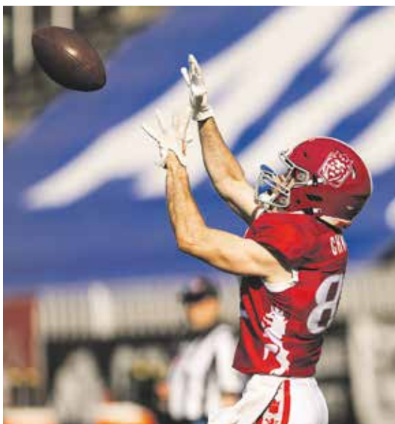
MÍČ pro americký fotbal váží necelý půlkilogram.

Praha – Prague Lions, jediný český zástupce v European Football Alliance, evropské lize amerického fotbalu, zná soupeře i rozpis zápasů. Letošní sezona se odehraje ve formátu 10 zápasů pro každý tým, přičemž všechny kluby se utkají systémem dvoukolové každý s každým. Poté následuje play-off. Základní část začíná v polovině května a pražský zástupce se představí 16. 5. na hřišti dánského Nordic Storm. Další zápasy českých lvů (přesné datum bude určeno později), domácí zápasy se odehrají na stadionu Viktorie Žižkov: Paris Musketeers vs. Prague Lions (23.–24. května), Prague Lions vs. Nordic Storm (6.–7. června), Munich Ravens vs. Prague Lions (13.–14. června),