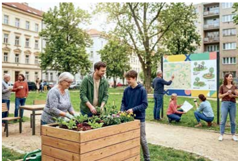
IMENŠÍ projekt může zlepšit vaše okolí nebo sousedské vztahy.

Praha 10 – Radnice vyhlásila další ročník programu „Zásobník projektů – partnerství pro Prahu 10“. Obyvatelé mohou od 1. dubna žádat o podporu svých nápadů, které zlepšují veřejný prostor nebo posílí sousedský život. Na drobné komunitní a environmentální projekty je připraveno celkem 713 000 korun, přičemž jeden projekt může získat až 50 000 korun. Cílem programu je podpořit nápady, které vznikají přímo mezi lidmi – od úprav veřejného prostoru přes sousedská setkání až po menší kulturní či společenské akce. Podrobné informace, pravidla soutěže i formuláře jsou k dispozici na webových stránkách městské části Praha 10. (P10, red)