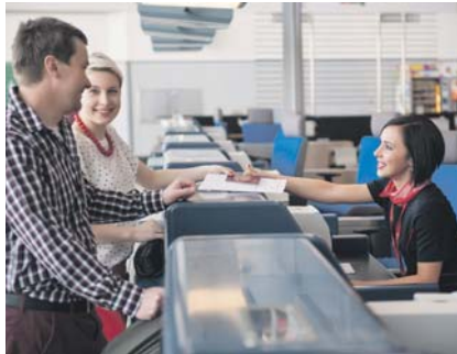
ODBAVIT se můžete u klasické přepážky nebo u samoobdavovacích kiosků.

tisknout palubní vstupenku. K dispozici je také 20 přepážek pro samoobdavení zavazadel, které podporuje 12 aerolinek.