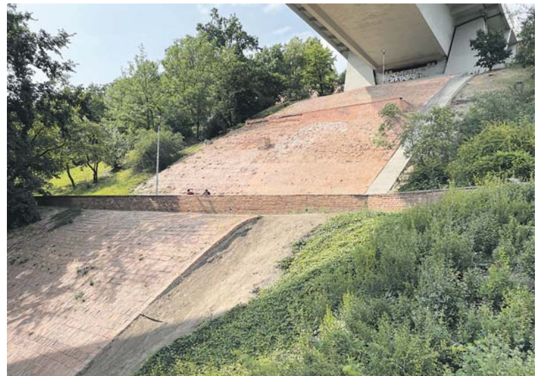
OPRAVY v parku Folimanka budou stát zhruba 15,5 mil. korun, velký podíl na financování projektu má Magistrát hlavního města Prahy.

„Dvojkové parky patří mezi nejnavštěvovanější v Praze. A to zcela právem, do jejich péče a rozvoje každoročně investujeme nemalé finanční prostředky. Parky a zelená zákoutí revitalizujeme tak, aby v nich občané a návštěvníci trávili čas rádi. A to se nám daří i tady na Folimance, zdejší volnočasový areál Jammertal je toho důkazem. Opravou přilehlého cihlového svahu a plánovanou rekonstrukcí Velké kaskády určitě potěšíme mnohé pamětníky, kteří čekají na návrat bronzového sousedství Čendy a Pepiny od českého sochaře Bohumila Zemánka,“ sdělil starosta Prahy 2 Jan Korseška (ODS).