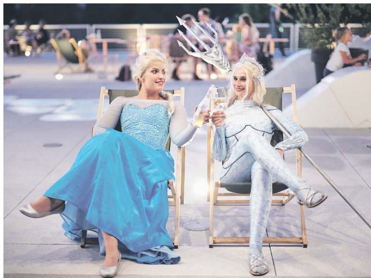
NA AKCI poznáte nové přátele a užijete si zábavu s dalšími fanoušky ConCrunch.