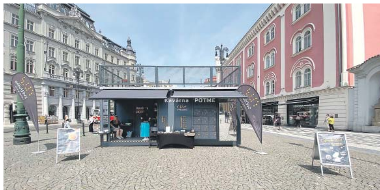
VÝTĚZEK ze vstupného do potemné kavárny poputuje na podporu charitativních aktivit.

A až do 1. července je veřejnosti k dispozici populární „Kavárna POTMĚ“ Nadačního fondu Českého rozhlasu a jeho projektu Světluška, která letos zakotvila před nákupním centrem. V kavárně se návštěvníci ponoří do absolutní tmy a ocitnou se ve světě nevidomých – bez mobilních telefonů, světla a jiných vizuálních podnětů. O obsluhu se postarají nevidomí baristé, kteří hostům nabídnou nejen výběrovou kávu, ale i autentický a silný zážitek. (red)