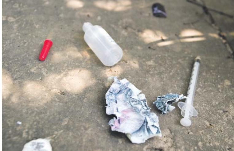
CENTRA by mimo jiné měla i minimalizovat výskyt „nádobíčka“ drogově závislých ve veřejném prostoru.

Praha – Centrum by mělo být umístěno do prostor v okolí holešovického nádraží, kde se nacházejí nevyužité budovy a pozemky ve vlastnictví hlavního města a dopravního podniku. „Jako město musíme být schopni řešit problémy s návykovými látkami racionálně a bez předsudků. Takzvaná čáčka, tedy nízkoprahová centra, jsou naprosto zásadní – pomáhají chránit zdraví a důstojnost lidí, kteří se ocitli na okraji společnosti, a zároveň přispívají ke zlepšení veřejného prostoru. Uprímně řečeno, taková zařízení tu měla fungovat už dávno,“ sdělil Zdeněk Hříb (Piráti), náměstek primátora hl. m. Prahy pro oblast dopravy, a dodal: „Zároveň musíme být připraveni i na nové hrozby, jako je extrémně nebezpečný fentanyl, který už začíná pronikat i do Evropy. Ve Spojených státech na něj umírá více než 70 tisíc lidí ročně, a právě včasná prevence a kontaktní práce v terénu je klíčem k tomu, aby se podobný scénář neopakoval i u nás.“