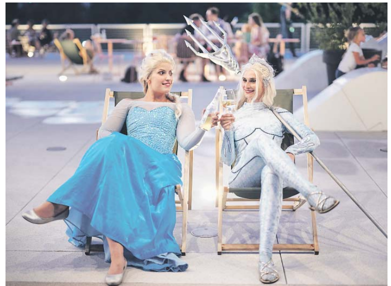
NA AKCI poznáte nové přátele a užijete si zábavu s dalšími fanoušky ConCrunch.