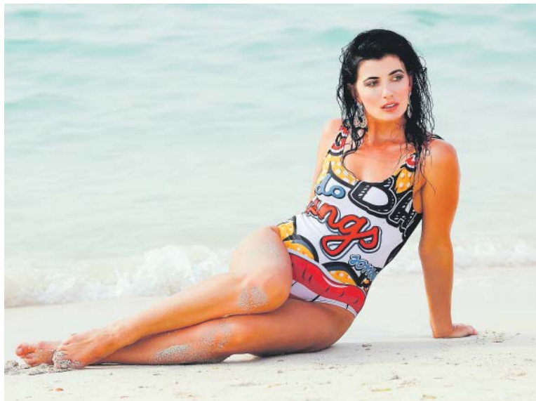
POKUD chcete strávit pohodovou dovolenou, důkladně si předem rozmyslete, se kterou cestovní kanceláří poletíte do světa.

Naopak v případech, kdy jednotlivé služby poskytují různé subjekty, pak bude záležet na dalších podmínkách. O zájezd se však mimo jiných případů bude jednat vždy, když jsou služby cestovního ruchu zakoupeny společně na jediném prodejním místě, nabízeny, prodávány