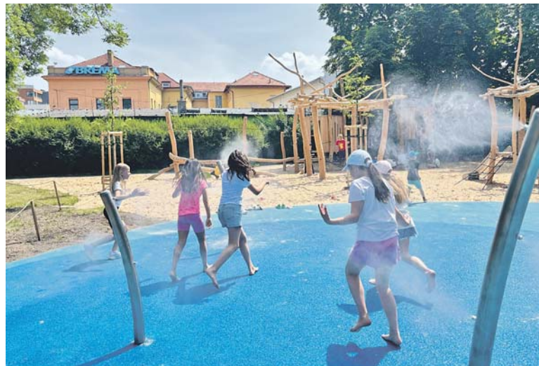
V PARNÉM létu děti určitě potěší mlžítka. Foto: MČ Praha 7

„Při návrhu úprav hřiště jsme vycházeli z potřeb rodin, které hřiště navštěvují. Vznikl tak prostor, který nejen baví děti, ale zároveň nabízí zázemí i pro rodiče a přispívá k celkově příjemnému trávení volného času. Kromě řady nových herních prvků zde návštěvníci najdou třeba sedací mola a v následujících týdnech přibudou také piknikové stoly. Vysazeny byly také nové stromy a keře a jistě potěší i mlžící prvky, které poskytují osvěžení v horkých dnech,“ doplnil radní pro životní prostředí a veřejný prostor Jiří Knitl (Praha 7 Sobě). Rekonstrukce probíhala od března do června tohoto roku. Celkové náklady vyšly přibližně na 7,5 milionu Kč. Zdroj: MČ Praha 7