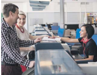
ODBAVIT se můžete u klasické přepážky nebo u samoodbavovacích kiosků.

tisknout palubní vstupenku. K dispozici je také 20 přepážek pro samoodbavení zavazadel, které podporuje 12 aerolinek.