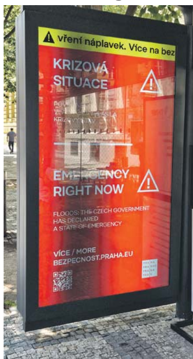
KRIZOVÉ zprávy mají nejvyšší prioritu, tedy nahrazují jakýkoli plánovaný obsah, a to i v noci.

Praha - Městská společnost Technologie hlavního města Prahy (THMP) představila nový systém pro rychlé šíření krizových informací prostřednictvím digitálních obrazovek v příštěších městské hromadné dopravy. Díky technickému řešení vyvinutému na míru pro hlavní město je nyní možné během několika okamžiků informovat Pražany i návštěvníky metropole o mimořádných událostech, především v případech ohrožujících život a bezpečí obyvatel. Michal Hroza (TOP 09), pražský radní pro infrastrukturu, zdůraznil, že lidé potřebují v krizových situacích jasné, ověřené a srozumitelné informace: „Informovat občany o hrozícím nebezpečí není jen povinnost, ale klíčová součást ochrany veřejnosti. Dobrá krizová komunikace buduje důvěru, pomáhá snižovat riziko paniky a zvyšuje šanci zvládat mimořádné situace s co nejmenšími následky.“ (red)