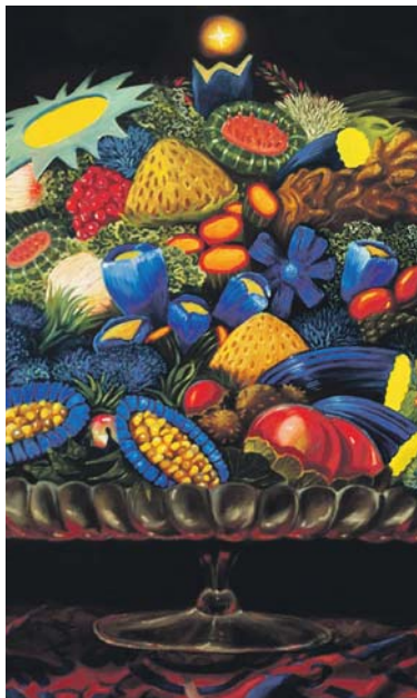
OBRAZ s názvem Sklizeň z Voynichovy zahrady.