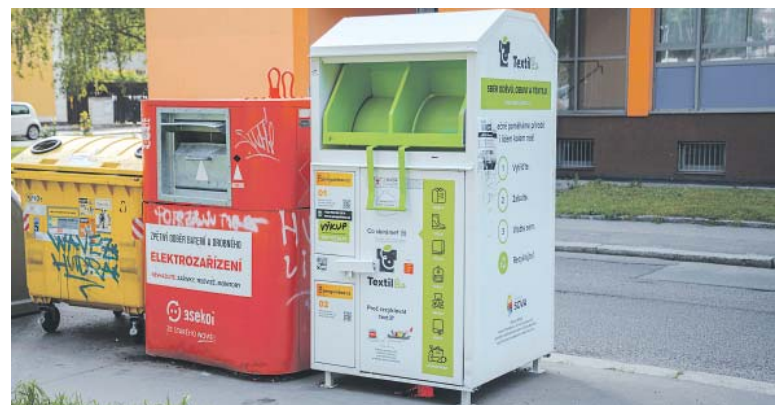
V PRAŽSKÝCH ulicích je od dubna rozmístěno 30 kusů nových sběrných kontejnerů, které po vložení textilu nabídnou odměnu.

mají lidé možnost získat odměnu za odpovědné nakládání s textilem. Kontejnery obsahují schránky na odložené nepotřebných věcí v rámci eko-výzvy. Po vložení balíčku s textilem a po zpracování získá občan kredity, které může uplatnit při nákupu oblečení v e-shopu s udržitelnou módou Genesis. I díky tomu bylo po prvním měsíci od umístění do ulic města vysbíráno více než 6 tun použitého textilu. (red)