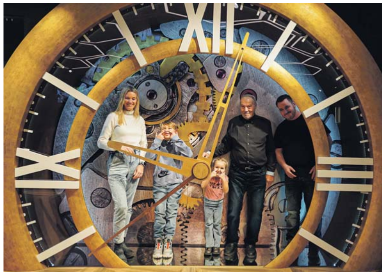
V MUZEU Back in Time odhalíte také tajemství vzniku Staroměstského orloje.

Odpovězte na soutěžní otázku do 15. července 2025 na e-mail: soutez@ceskydomov.cz a do předmětu e-mailu napište MÁJ. Dvacet výherců získá po rodinné vstupence, o výhře budou vyrozuměni e-mailem.