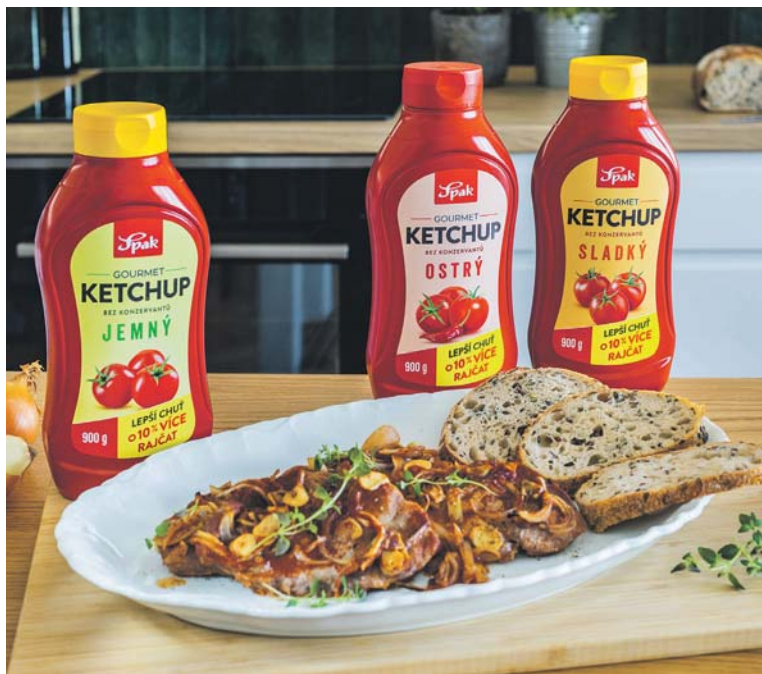
KOMBINACE kečupu a piva v marinádě může na první pohled působit zvláště, ale právě spojení neobvyklých surovin často vede k vytvoření nových, harmonických chutí.

• Na marinádu použijte černé pivo s nasládlou chutí. Lépe zvýrazní chuť masa.