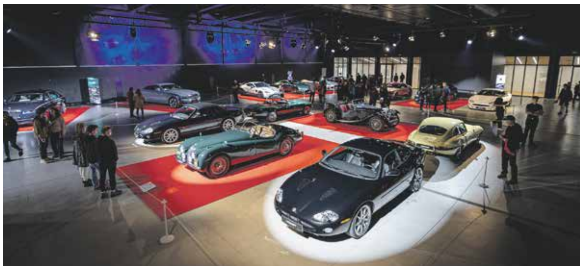
KDO obdivuje starší elegantní vozy, na Výstavišti nebude zklamán.

Více informací o akci a prodeji vstupenek najdete na www.LEGENDY.cz a na sociálních sítích. (red)