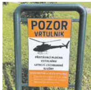
SOUČASNÝ přistávací prostor v Zitkových sadech je dlouhodobým provizoriem.

„Pacienty odsud budou záchranáři převážet do Všeobecné fakultní nemocnice, do Ústavu pro péči o matku a dítě v Podolí nebo k Apolináři. Žádná z těchto nemocnic totiž nemá vhodnou přistávací plochu. Ve většině případů, kdy zasahuje letecká záchranářská služba, je každý okamžik klíčový – počítají se doslova minuty