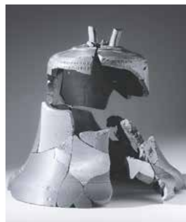
FRAGMENTY staroměstského zvonu.

vyšlo najevo, že zvon nemusel být zničen pouze požárem staroměstské radniční věže a následným zřícením, což se původně předpokládalo. Model jasně ukázal, že zvon byl také zasažen střelou větší ráže, která způsobila vážné poškození. K tomu mohlo dojít ještě před požárem 8. května, což mění zažitý historický závěr o jeho zničení,“ říká Ivo Macek, ředitel Muzea Prahy. (red)