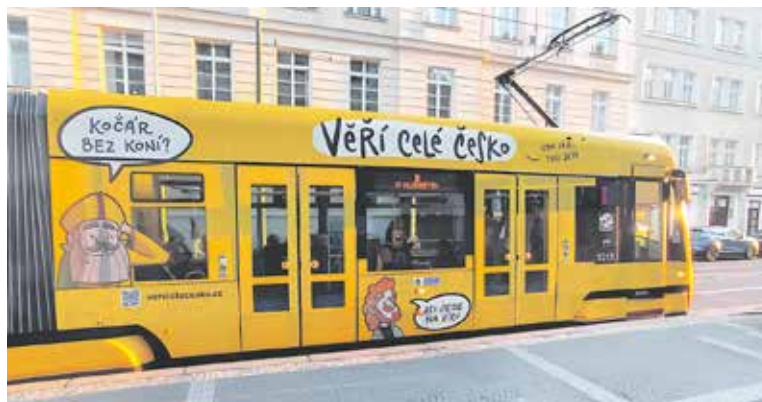
V INTERIÉRU CyriLinky se lidé setkají s vtipnými hláškami a hashtagy, ale také s otázkami umístěnými na sloupcích u výstupních dveří, které podněcují k zamyšlení.

jejímž cílem je vdechnout svátku slovanských věrozvěstů nový život. Kromě tramvaje je součástí projektu také celorepublikový sociologický průzkum, animovaný film či školní programy napříč Českem. Tramvaj bude vidění v ulicích metropole do října.