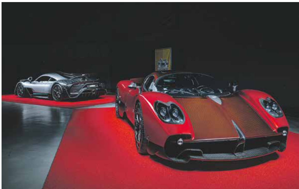
MILOVNÍCI rychlých vozidel si přijdou na své.