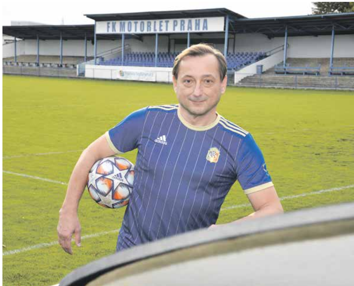
KLUBEM jeho srdce je již více než deset let pražský Motorlet.

Když to vezmu ve zkratce, navrhuji zavedení profesionálního sboru rozhodčích pro první a druhou ligu s cílem zajistit férovost na hřišti. Transparentnost