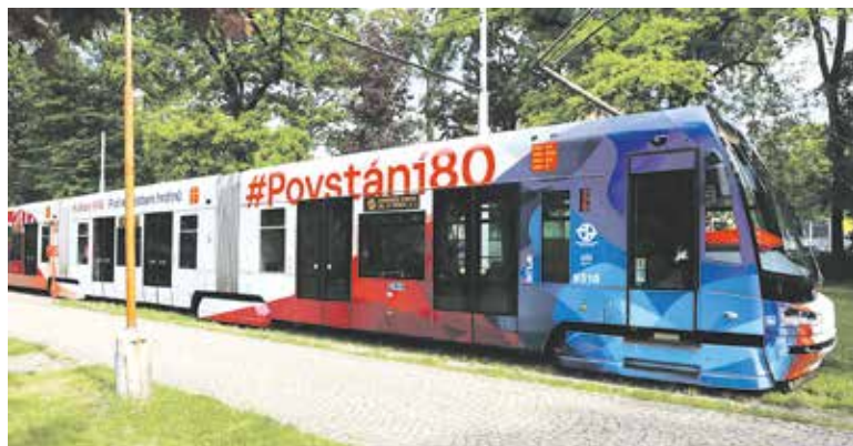
UVNITŘ tramvaje cestující naleznou informace nejen o Pražském povstání, ale také o dalších událostech na konci 2. světové války.

Praha – Od května brázdí pražské ulice dvě netradičně polepené tramvaje. Metodějská CyriLinka s nadhledem, humorem i výzvou k zamyšlení připomíná odkaz dvou osobností českých dějin – Cyrila a Metoděje. Za vizuálem stojí iniciativa Věří celé Česko,