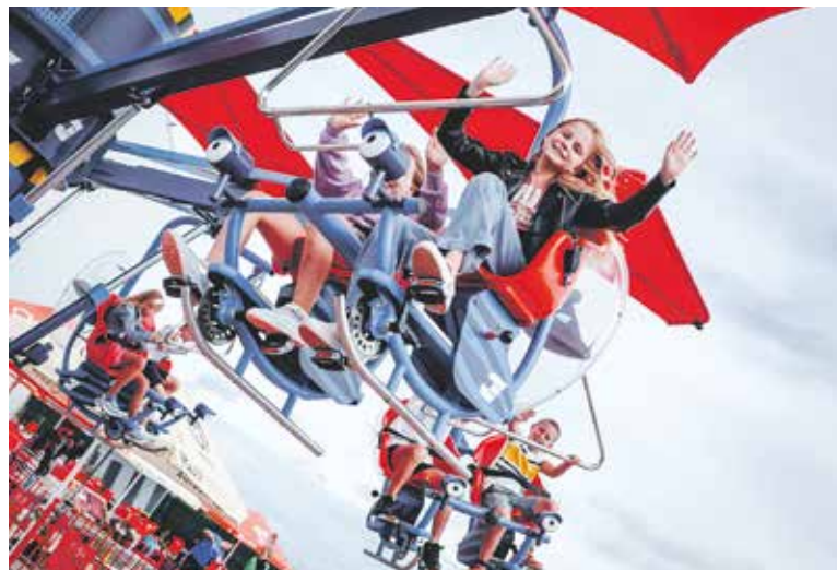
OBŘÍ létající kola jsou jednou z oblíbených venkovních atrakcí Majalandu.

Odpovězte na soutěžní otázku do 25. května 2025 na e-mail: soutez@ceskydomov.cz . Dvacet výherců získá po rodinné vstupence do Majalandu.