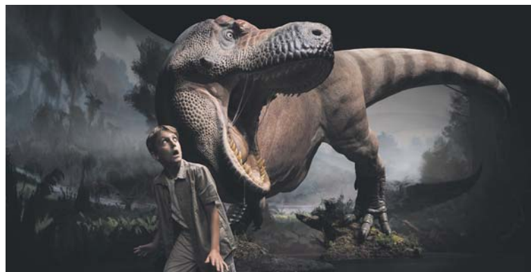
IMPOZANTNÍ model Tyrannosauruse rexe se tyčí do výšky čtyř metrů.

Součástí Dinosaurie je i moderní virtuální herna. Svět dinosaurů si tak návštěvníci užijí díky špičkové virtuální hře Dinosauri VR. Vydají se 80 milionů let zpět do druhohor, setkají se tváří v tvář s největším predátorem tehdejší doby Tyrannosaurom rexem a díky nejmodernější technologii 5D reálných smyslových efektů zažijí pocity hrdinů dobrodružných filmů Cesta do pravěku nebo Jurský park. Pobaví se ale i u dalších her The Lost Lab a Last Stand, kdy například budou zachraňovat svět před krvežíznivými zombíky.