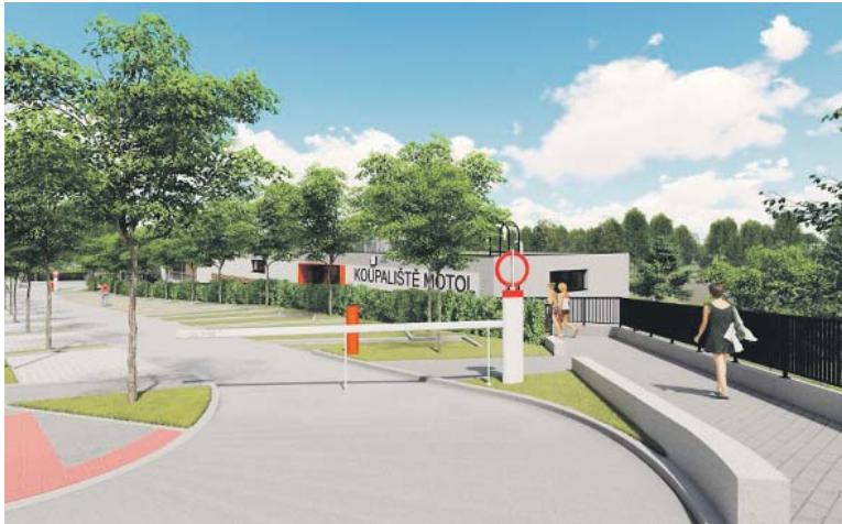
DO AREÁLU bude možné vstoupit ze Zahradničkovy ulice.

Motol – Praha vybrala zhotovitele na výstavbu nového zázemí koupaliště u Motolských rybníků. Nejvýhodnější nabídku podala společnost EKIS s cenou 43,4 milionu korun bez DPH. Komise vybírala celkem ze šesti nabídek, kde hodnotila nabídnutou cenu (80 % hodnocení) a dobu zhotovení (20 % hodnocení). Nové zázemí by mělo být hotové v první polovině příštího roku.