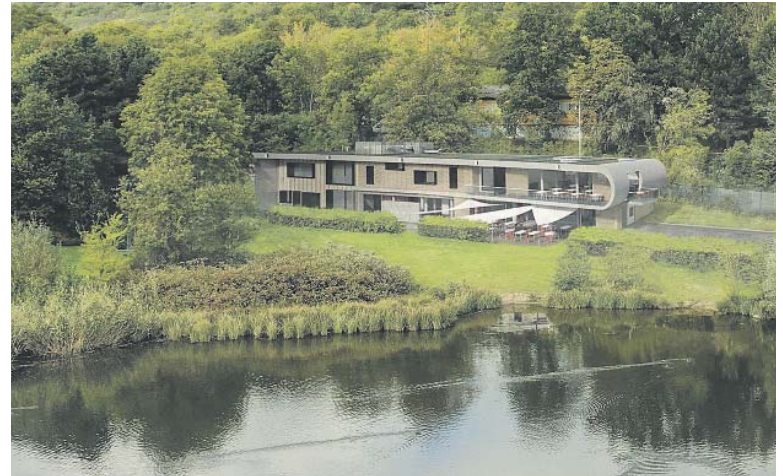
VZHLED NOVÉ budovy koupaliště je inspirován vodními a námořními motivy. Křivka střechy evokuje zaoblení břehu rybníka a vlnění hladiny.

Staveniště bude po dobu výstavby ohrazeno a koupaliště tak bude i v letošní sezóně k dispozici pro návštěvníky, je však nutné počítat s určitými dílčími omezeními. Novinkou pouze pro letošní sezónu je posun vstupu do areálu koupaliště. Je situován asi 150 metrů východně od vstupu původního v ulici Zahradničkova. Původní již nevyhovující budovy toalet a převlékárny jsou nyní