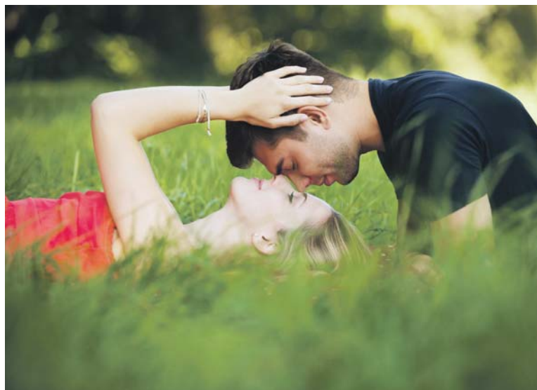
VŠECHNA zjištění podle autorů studie naznačují, že je možné, že romantická láska stále podléhá evolučnímu výběru.

Nejpočetněji zastoupeným typem jsou takzvaní „umírnění romantici“, jimž v populaci patří zhruba 41% podíl. Charakterizováni jsou relativně nízkou intenzitou lásky, relativně nízkou mírou obsedantního myšlení, relativně vysokou partnerskou oddaností a relativně mírnou frekvencí sexu. Milování si tento typ užívá průměrně 2,5krát týdně. Umírnění romantici jsou častěji muži (asi 58 % z nich) a současně je u této skupiny