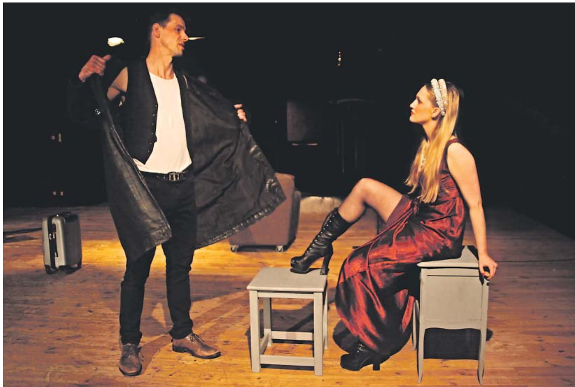
V DRAMATIZACI Dostojevského románu Idiot ztvárňuje hlavní hrdinku Nastasju Filippovnu.

V divadle účinkujete ve dvou představeních, Ženitba a Idiot.