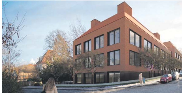
POKUD půjde vše hladce, práce na výstavbě ZŠ Na Výši by se mohly rozběhnout už o letních prázdninách.

Praha 5 – Chybějící místa ve třídách ale s sebou tento rok bohužel přinesla nepopulární losování budoucích prvňáčků. Dotklo se přibližně čtyřiceti dětí, které se přihlásily do ZŠ Nepomucká a ZŠ Podbělohorská. „Situace nás netěší a mrzí, pro rodiče je to smutná věc,“ chápe rozzlobené rodiče starosta Prahy 5 Lukáš Herold (ODS) s tím, že problém současná koalice zdědila po předchozím vedení, které vládlo do loňského prosince. „Za dva, tři měsíce to ale nevyřešíte,“ podotkl. Rodiče i jejich potomky ujišťuje, že pro všechny se místa najdou. Radnice pro nadcházející školní rok zajistila další třídu v ZŠ Drtinova. Aby se nepřijemná situace neopakovala v dalších letech, než začne sloužit ZŠ Na Výši, současná koalice začala neprodleně po svém nástupu věc řešit. „Okamžitě, co jsme na radnici přišli, jsme začali hledat možnosti, jak vyřešit další dva překlenovací roky, aby se příští a přes příští rok losovat nemuselo,“ připomněl místostarosta Martin Damašek (TOP 09), který má v gesci školství.