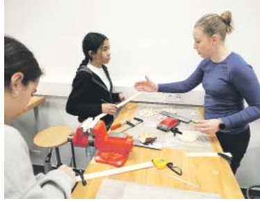
DĚTI se naučí pracovat například se dřevem.

Vinohrady - Městská část Praha 2 představila veřejnosti nový projekt v oblasti polytechnického vzdělávání dětí a mládeže. Moderně vybavené dílny, které vznikly ve vnitrobloku domu v Sarajevské ulici, budou moci využívat jak žáci základních škol, tak i děti ze zájmových kroužků Domu dětí a mládeže Praha 2. Polytechnické dílny vznikly v prostoru bývalé zámečnické dílny a skladů ve dvorním traktu domu. Budova postavená v roce 1912 byla ve velmi špatném technickém stavu, proto bylo potřeba ji kompletně zrekonstruovat. Náročné stavební práce trvaly několik