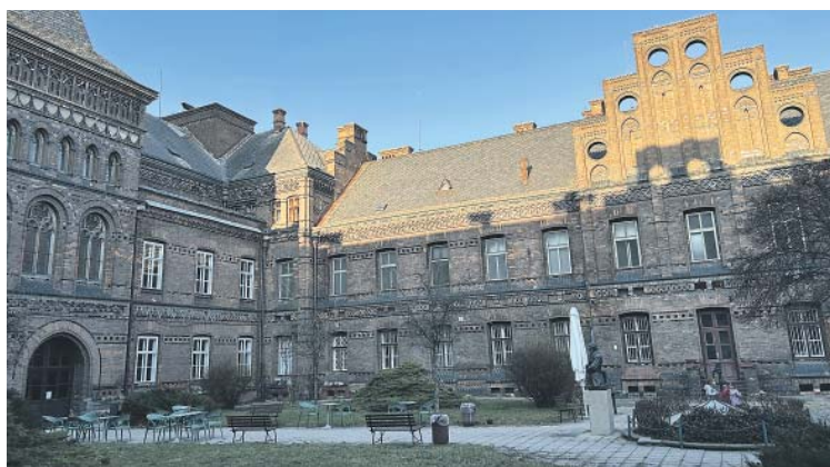
ZEMSKÁ porodnice u svatého Apolináře.