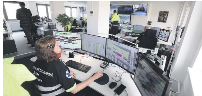
NA DISPEČINKU pražské záchrané služby slouží ve 12hodinových směnách 7–10 operátorek a operátorů.

Byť na pracovním trhu přetrvává nedostatek profesionálních zdravotníků, kteří splňují požadavky pro práci ve zdravotnickém operačním středisku záchrané služby, podařilo se pražské záchraně v loňském roce rozšířit