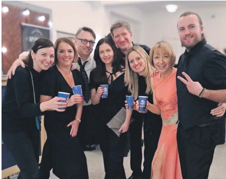
PLESOVÝ tým spolku Dolní Holešovice.