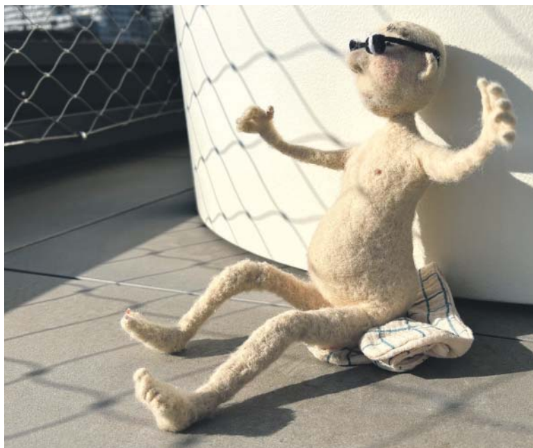
VLNĚNÝ nudista určitě dokáže někoho pobavit...