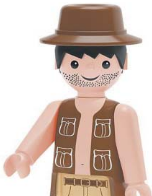
HRAČKA z prověřených materiálů a s jasným původem je například nový Igraček – dobrodruh.