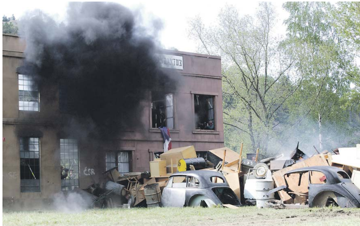
AKCE BARIKÁDA 2025 opět připomene dramatické události z Pražského povstání.

Vrcholem dne bude zinscenovaný boj o barikádu, která je typickou scénou evokující květnové povstání. Veřejnosti nabídne mimořádnou možnost vidět přímo v ulicích města v akci originální vojenskou techniku, ale především bude důstojnou vzpomínkou na ty, kteří se postavili nacistům v boji za svobodu. Velkolepou podívanou umocní dobové uniformy téměř čtyř set