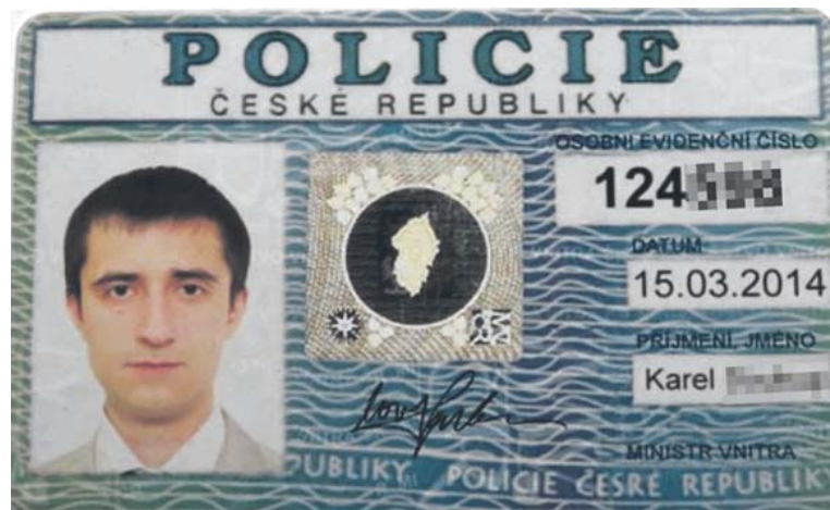
FOTOGRAFIE osob, které jsou na falešných průkazech, podvodníci stáhli z internetu.

ČR – Policisté varují před promyšlenějšími postupy podvodníků. Konkrétně jde například o telefonát falešného policisty a pracovníka České národní banky (ČNB), kteří se snaží oběť vystrašit legendou, že si na ni někdo chce vzít úvěr a že je nutné přeposlát finanční prostředky na „bezpečný bankovní účet“ či předat kurýrovi, který si přijede pro peníze a vystaví falešné potvrzení. Pachatelé jsou velmi manipulativní, až agresivní. Své tvrzení doprovází zasláním falešných dokumentů a průkazů, včetně policejního průkazu. Falešný pracovník ČNB s obětmi hovoří přes videohovor, kdy má obličej elektronicky pozměněn. Policie