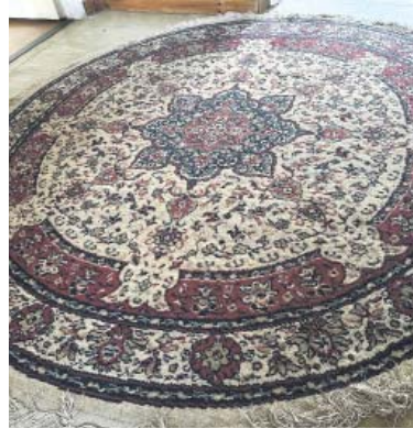
ODEVZDÁVAT lze téměř všechny kategorie nábytku, včetně koberců a matrací.

ČR – Po řadě diskuzí a jednání byl na evropské úrovni definován koncept rozšířená odpovědnost výrobců (Extended Producer Responsibility – „EPR“). Ve zkratce jde o systém, v němž výrobce nese odpovědnost za svůj produkt od jeho výroby až po konečnou fázi, kdy se stává odpadem. Cílem „EPR“ systému také je, aby občané a obce neplatili tolik za odpady, ale naopak se odpovědnost přenesla na výrobce. Právě proto skupina šesti výrobců a prodejců nábytku (Hornbach, IKEA, Jysk, Kinnarps, Řešeto a XXXLutz) iniciovala spuštění pilotního