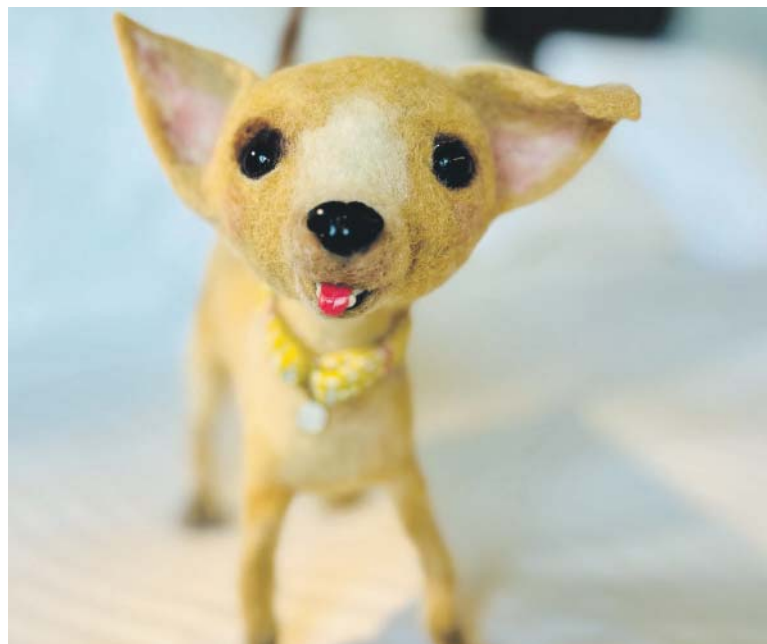
PŘÍBĚHY Loly, odvážné čivavy, si děti časem přečtou v Jitčině knížce.