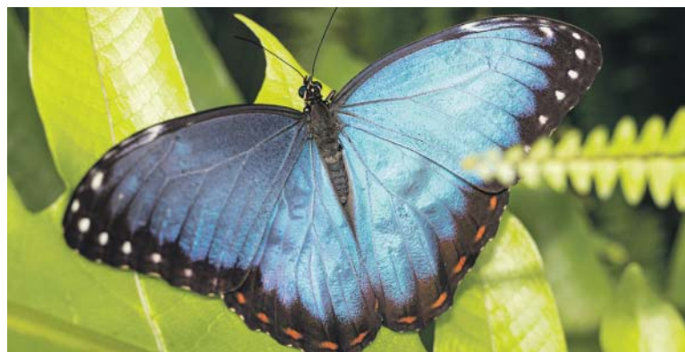
MOTÝLY ve skleníku Fata Morgana můžete navštívit od úterý do neděle od 9.00 do 19.00 hodin.

Fata Morgana se představí téměř čtyři desítky tropických druhů. Kromě nočního martínáče Attacus atlas , který patří mezi největší motýly na světě, tu nechybí nádherní Morpho peleides s blankytně modrými křídly, velcí soví motýli rodu Caligo nebo známý motýlí cestovatel monarcha stěhovavý ( Danaus plexippus ) a s nimi další barevné babočky, otakárci, ale i bělásci. Pokud budete mít štěstí, spatříte jedinečný okamžik, kdy se z ne nápadné kukly vylíhne krásný motýl.