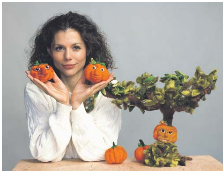
JITČINY vlněné výrobky jsou už na první pohled krásné.

Pod vašimi rukama vznikají zvířátka i lidské postavičky. Výrobky si doma vystavujete, rozdáváte je jako dárky nebo třeba prodáváte