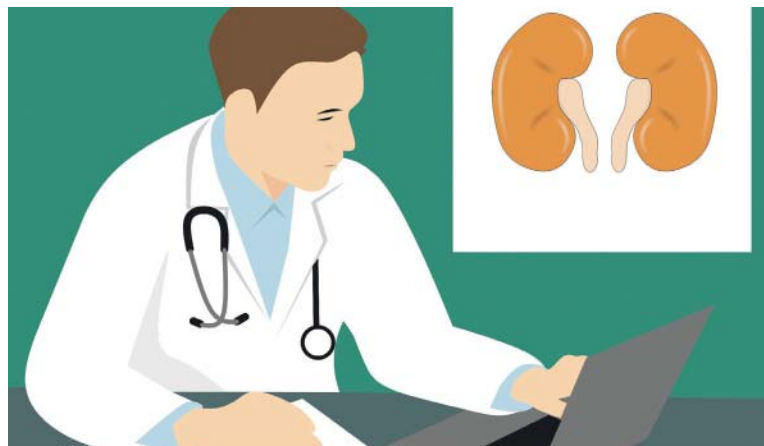
VČASNÁ diagnostika onemocnění ledvin umožní brzké zahájení léčby a snižuje i potenciální rozvinutí přidružených onemocnění.

Cílem léčby je omezit rozvoj ledvinového onemocnění do definitivního selhání ledvin.