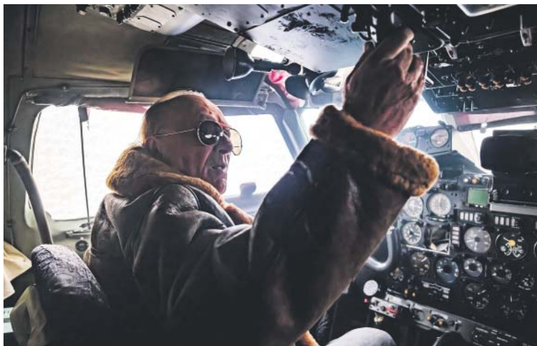
FRONTMAN skupiny Olympic Petr Janda zažil pocety pilota před startem.

ho ústavu a počasí dalo všem pořádně zabrat. „Moc děkujeme za tuto možnost! I když jsme při natáčení promrzli na kost, věříme, že výsledek za to stojí. Doufáme, že si ho užijete stejně jako my,“ vzkazují členové kapely, kteří se v dubnu vydali na jarní tour. (red)