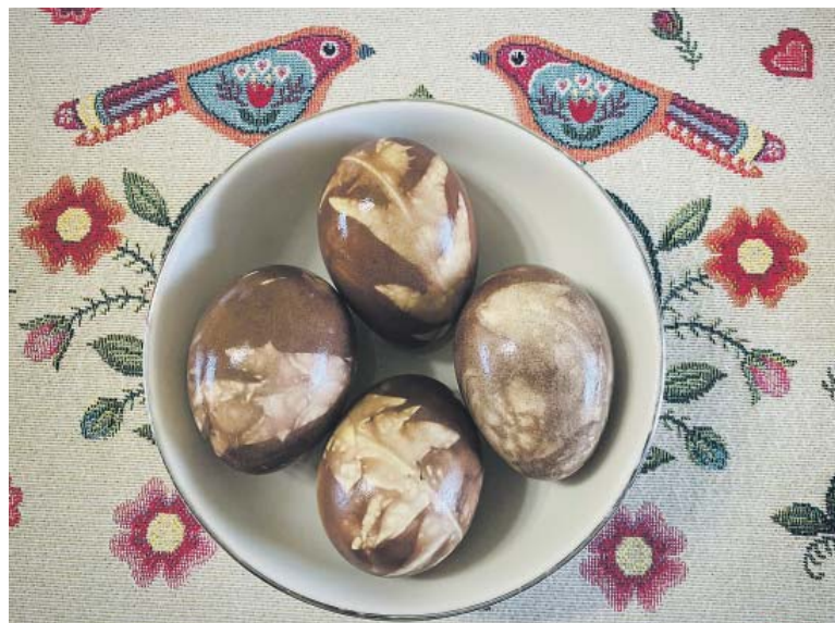
ZDOBENÍ vajíček za pomoci holicí pěny? Jde to...

Určitě víte, že už můžete oslavovat Velikonoce týden před svátky. Každý den má svoji barvu. A co taková výzva pro stejné