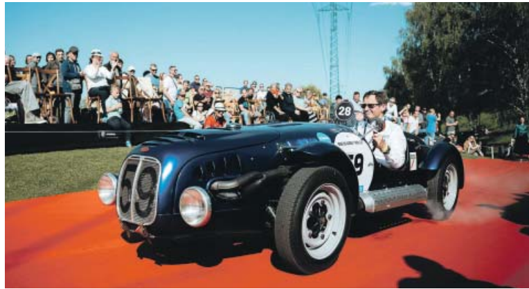
AUTOMOBILOVÉ klenoty nabídnou přehlídku vzácných veteránů.

uskuteční 26. dubna. Během přibližně čtyřhodinové projíždky některé vozy ukáží svou krásu v plné dynamice. V neděli pak proběhne tradiční slavnostní defilé na červeném koberci, během něhož budou vyhlášeni vítězové jednotlivých soutěžních kategorií. Jednou z nich bude i cena publika – návštěvníci budou mít během obou dnů možnost hlasovat pro svého favorita. Vstupenky je možné zakoupit online za zvýhodněnou cenu do 25. dubna nebo přímo na místě během akce. (red)