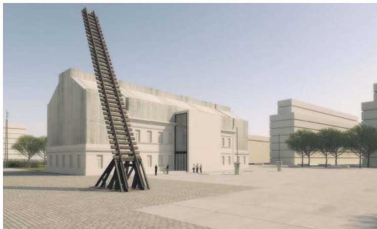
CENTRUM paměti a dialogu uchová odkazy minulosti pro další generace. Vizualizace: ARN STUDIO

Historická budova nádraží v Bubnech je místem, odkud v letech 1941–1945 deportoval nacistický režim téměř padesát tisíc