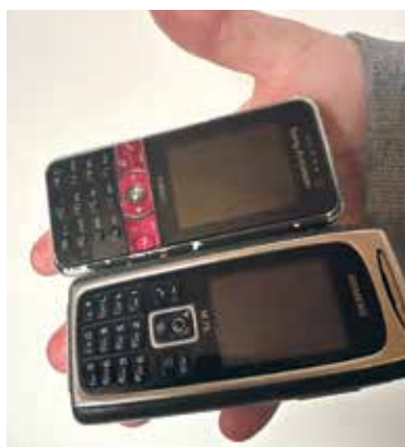
PODLE průzkumu společnosti Remobil skladují Pražané doma přibližně 140 tun nepotřebných mobilů, tedy asi 1,4 milionu přístrojů.

Praha 6 – Až do konce dubna můžete přinést na radnici staré mobilní telefony. Ve dvoraně úřadu byl umístěn sběrný box, do kterého je možné tyto telefony odkládat. Odevzdáním starého mobilu přispějete na charitu a zároveň pomůžete získat zpět cenné suroviny potřebné k výrobě těchto zařízení. „Na výrobu mobilu vážícího 100 gramů je třeba až 100 kilogramů materiálu a odpadu. Recyklací, opravami a prodloužením životnosti mobilů lze výrazně snížit jejich negativní dopady na životní prostředí,“ říká radní pro životní prostředí a klima městské části Praha 6 Petr Palacký (STAN). Z telefonů