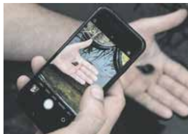
CHYTRÁ aplikace vám prozradí detaily o přírodě.

aplikace vám s určením pomůže. Z nejlepších fotografií pořádných během čtyř soutěžních dní vznikne fotografická výstava, kterou si budete moci prohlédnout v prostorách Národní technické knihovny. Bližší informace k projektu a o tom, jak se do něj zapojit, naleznete na www.citynaturechallenge.cz . (red)