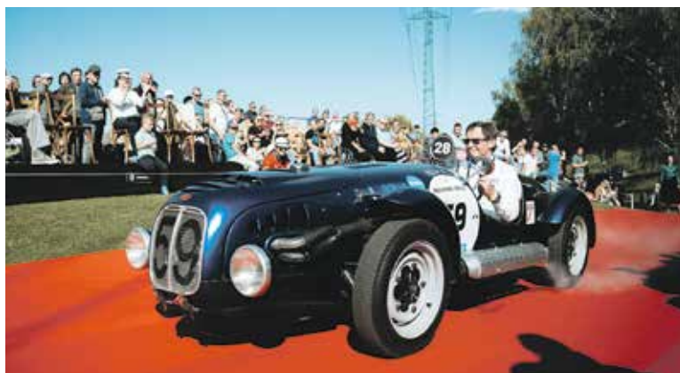
AUTOMOBILOVÉ klenoty nabídnou přehlídku vzácných veteránů.

uskuteční 26. dubna. Během přibližně čtyřhodinové projíždky některé vozy ukážou svou krásu v plné dynamice. V neděli pak proběhne tradiční slavnostní defilé na červeném koberci, během něhož budou vyhlášeni vítězové jednotlivých soutěžních kategorií. Jednou z nich bude i cena publika – návštěvníci budou mít během obou dnů možnost hlasovat pro svého favorita. Vstupenky je možné zakoupit online za zvýhodněnou cenu do 25. dubna nebo přímo na místě během akce. (red)