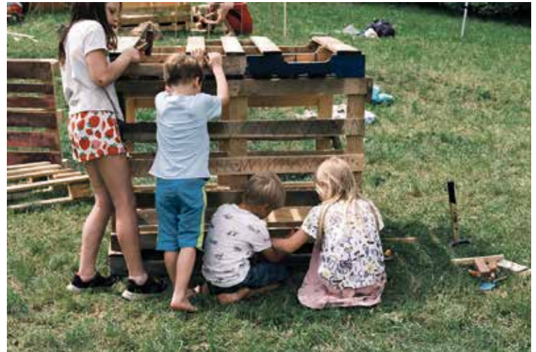
HŘIŠTĚ , na kterém si děti samy sestaví herní prvky, bude pravděpodobně na Vypichu.

Praha 6 byla první městskou částí, která v roce 2024 vyzkoušela koncept dobrodružného hřiště (Adventure Playground). Tento inovativní projekt probíhal v areálu Na Kocínce, kde si děti mohly samy stavět herní prvky z různých materiálů pod dohledem odborných lektorů. Díky obrovskému úspěchu a pozitivním ohlasům se městská část rozhodla v projektu pokračovat a hledat pro něj trvalé umístění. V roce 2025 bude Adventure Playground nově situován pravděpodobně na Vypichu. Kompletní modernizací projde i hřiště Egyptská, kde se počítá nejen s výměnou herních prvků, ale i s úpravou přístupových cest