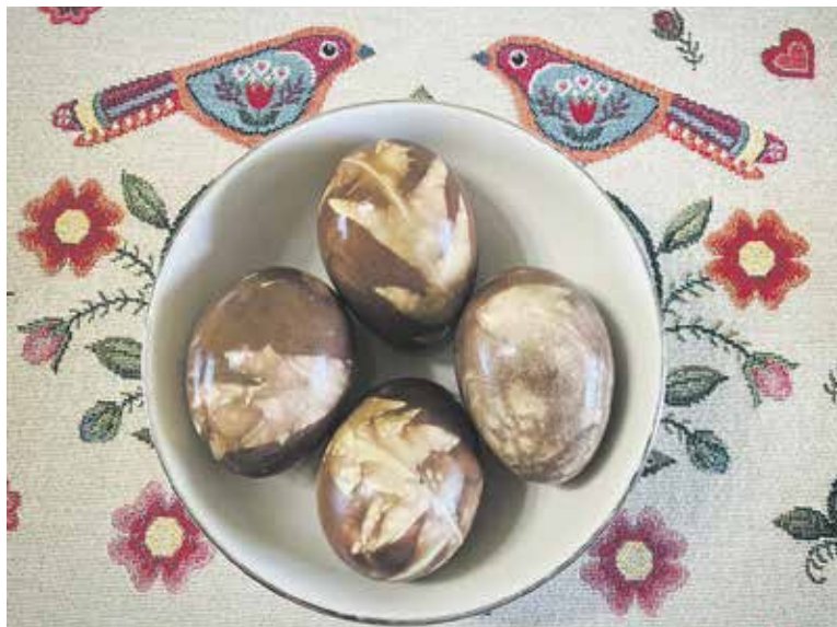
ZDOBNÍ vajíček za pomoci holicí pěny? Jde to...

Určitě víte, že už můžete oslavovat Velikonoce týden před svátky. Každý den má svoji barvu. A co taková výzva pro stejné