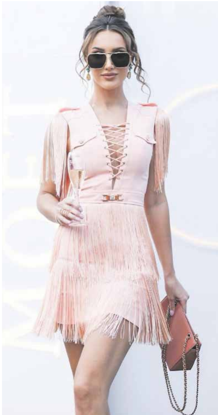
IV 35 LETECH by se mohla bez jakýchkoliv mindráků vydat na předváděcí molo.

Stále to bude přístupné. Nejde o pravidla USA, kterými bychom se řídili. Je moderní doba a snažíme se být progresivní, otevření a mít rovné podmínky. Nicméně, i když jsme otevření a nebráníme přihláškám trans ženám, maminkám či handicapovaným ženám, posuzujeme všechny kandidátky stejně. Musí mít kvality, které je posunou dále do finále, tedy musí pokorit