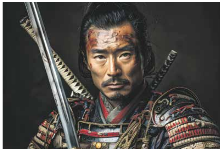
MNOHO samurajů bylo nejen vynikajícími válečníky, ale i významnými vzdělanci.

Má název Hrdinové a „padouši“ japonských kronik a mimo jiné posluchačům v knihovně Uměleckopřemyslového musea od 18.15 hod. vysvětlím, proč padl první šogunát.