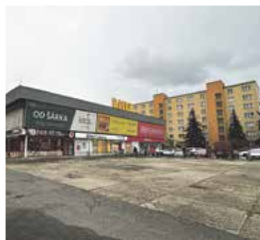
MÍSTO obchodního domu Šárka zde vyrostou bytové budovy.

Termín pro podání přihlášek byl do 7. dubna, porota z přihlášených vybere pět až osm týmů, které do června připraví koncept rozvoje území. (red)