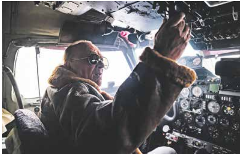
FRONTMAN skupiny Olympic Petr Janda zažil pocity pilota před startem.

ho ústavu a počasí dalo všem pořádně zabrat. „Moc děkujeme za tuto možnost! I když jsme při natáčení promrzli na kost, věříme, že výsledek za to stojí. Doufáme, že si ho užijete stejně jako my,“ vzkazují členové kapely, kteří se v dubnu vydali na jarní tour. (red)