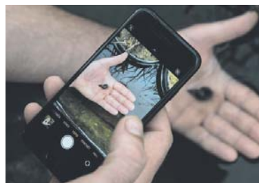
CHYTRÁ aplikace vám prozradí detaily o přírodě.

aplikace vám s určením pomůže. Z nejlepších fotografií pořádných během čtyř soutěžních dní vznikne fotografická výstava, kterou si budete moci prohlédnout v prostorách Národní technické knihovny. Bližší informace k projektu a o tom, jak se do něj zapojit, naleznete na www.citynaturechallenge.cz . (red)