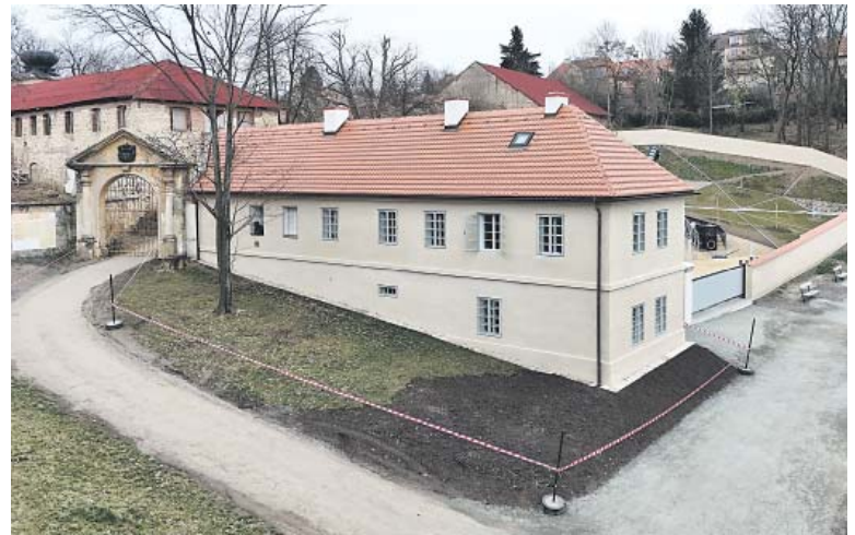
DOMKU zahradníka byla vrácena jeho podoba z devatenáctého století.

Košíře – Usedlost Cibulka, která desítky let chátrala, se otevřela veřejnosti. V nově zrekonstruovaném Domku zahradníka začalo fungovat Café Cibulka. V horním patře Nadace rodiny Vlčkových otevřela školicí a volnočasové prostory, které budou sloužit primárně odborníkům na dětskou paliativní péči. Nadace také pracuje na přeměně zbývajících částí historického areálu a letos plánuje zahájit stavbu nové budovy dětského hospice. V něm budou moci rodiny s vážně nemocnými dětmi nabírat sílu, prožívat radostné chvíle a bude o ně pečovat tým špičkových odborníků. „Stále děláme vše pro to, abychom proměnu celého areálu dokončili ještě v roce 2026. Podává se nám to ovšem jen v případě, že půjde vše podle plánu a nic se nezadrhne ani administrativně,“ řekl architekt František Brychta, který stojí za přeměnou Domku zahradníka a je zároveň vedoucím celého projektu Cibulka. (red)