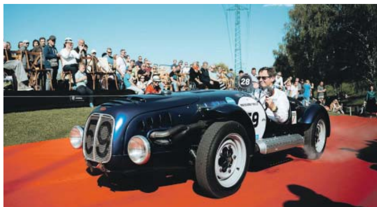
AUTOMOBILOVÉ klenoty nabídnou přehlídku vzácných veteránů.

uskuteční 26. dubna. Během přibližně čtyřhodinové projíždky některé vozy ukážou svou krásu v plné dynamice. V neděli pak proběhne tradiční slavnostní defilé na červeném koberci, během něhož budou vyhlášeni vítězové jednotlivých soutěžních kategorií. Jednou z nich bude i cena publika – návštěvníci budou mít během obou dnů možnost hlasovat pro svého favorita. Vstupenky je možné zakoupit online za zvýhodněnou cenu do 25. dubna nebo přímo na místě během akce. (red)