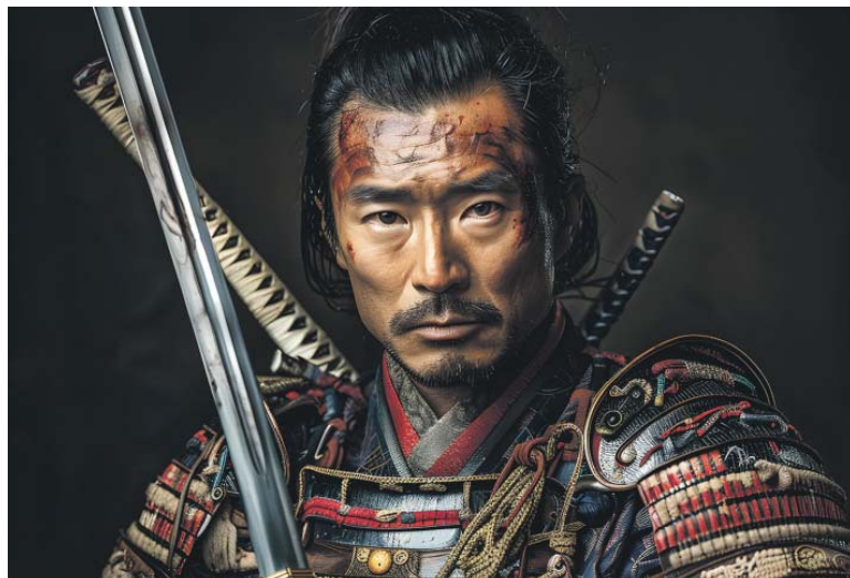
MNOHO samurajů bylo nejen vynikajícími válečníky, ale i významnými vzdělanci.

Má název Hrdinové a „padouši“ japonských kronik a mimo jiné posluchačům v knihovně Uměleckopřemyslového musea od 18.15 hod. vysvětlím, proč padl první šogunát.