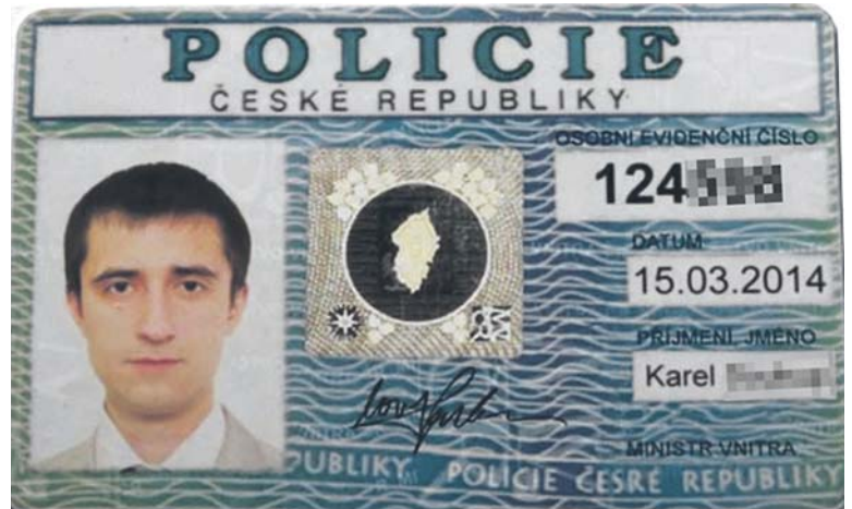
FOTOGRAFIE osob, které jsou na falešných průkazech, podvodníci stáhli z internetu.

Policisté a pracovníci bank vás nikdy nebudou nutit k převodům