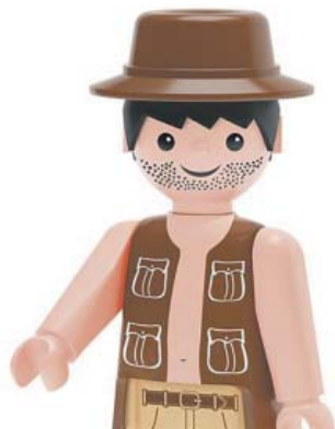
HRAČKA z prověřených materiálů a s jasným původem je například nový Igráček – dobrodruh.