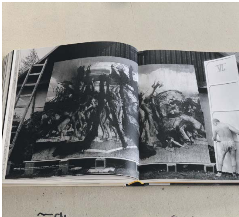
PAVEL Jasanský se věnoval také pozoruhodným prostorovým instalacím.

osobností zejména z pražské hudební, divadelní i literární scény a tyto aktivity dlouhodobě dokumentoval. Fotil pro Poetickou vinárnu Viola, Balet Praha, Divadla za branou a Na zábradlí. Fotografoval také pro hudební průmysl, zejména pro Supraphon a Panton, veřejnosti jsou tak známé desítky přebalů gramofonových desek s Jasanského fotografiemi. Vedle fotografické tvorby se začal postupně věnovat volné tvorbě, která se od asambláží a grafik posunula až k velmi pozoruhodným prostorovým instalacím. Tato tvorba je veřejnosti v podstatě neznámá. (red)