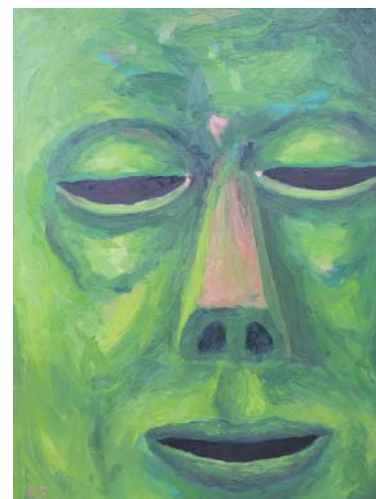
OLEJOMALBA Empty Head.