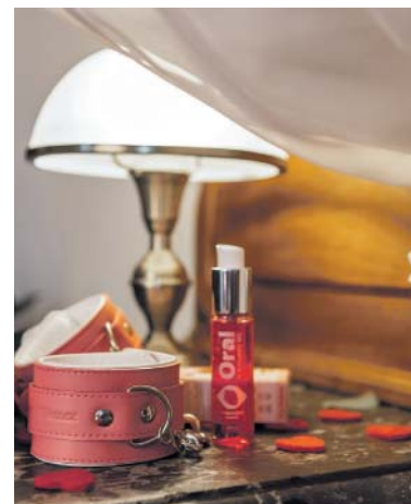
ZPESTRĚTE si milostné chvíle erotickými pomůckami.

Odpovězte na soutěžní otázku do 10. 4. 2025 na e-mail: soutez@ceskydomov.cz a do