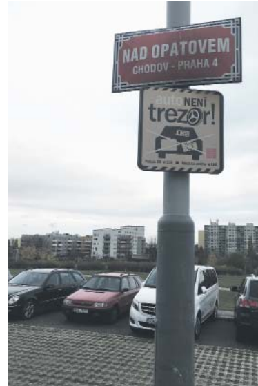
NEDOSTATEČNÝ počet parkovacích míst řeší například obyvatelé ulice Nad Opatovem.

„Hledáme tedy rychlejší řešení. Mezi ně patří vytvoření nových míst na povrchu, proto jsem již minulý rok zadal posouzení možnosti využití ploch podél