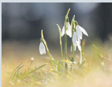
JARO se probouzí...

V posledních letech se v Praze konalo několik vědeckých se-