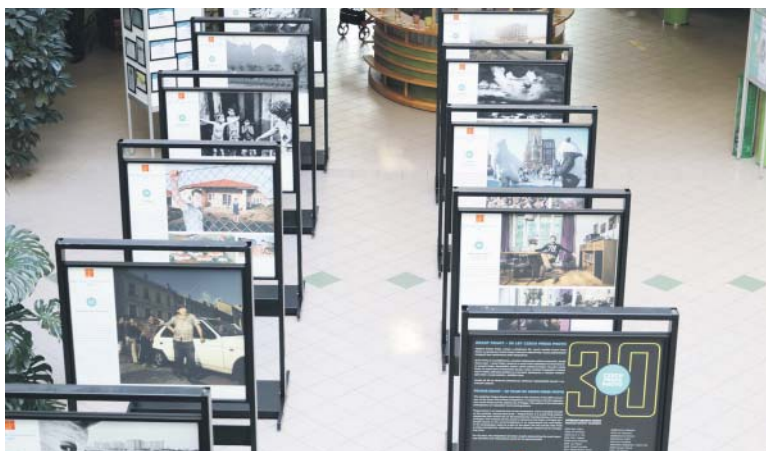
NÁVŠTĚVNÍCI výstavy se přesvědčí, že Praha má mnoho podob.

Grant Prahy je součástí každoročně udílené druhé hlavní ceny – jedná se o roční tvůrčí stipendium na monitorování proměn Prahy. Oceněného autora vybírá osobně primátor hlavního města Prahy na doporučení mezinárodní poroty a díky vzniklým fotografiím získává hlavní město jedinečný pohled na metropoli zachycenou z různých tematických úhlů i na její podobu postupem času. (red)