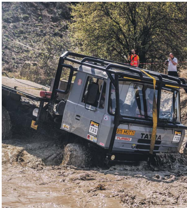
V ZÁVODECH nejde o rychlost, ale především o jezdecké umění.

5. 4. - 6. 4. Milovice u Nymburka 26. 4. - 27. 4. Braňany u Mostu 24. 5. - 25. 5. Mohelnice (Pořádá Velká cena Mohelnice) 14. 6. - 15. 6. Jihlava 9. 8. - 10. 8. Kunštát 30. 8. - 31. 8. Valašské Meziříčí 20. 9. - 21. 9. Vřesová u Sokolova