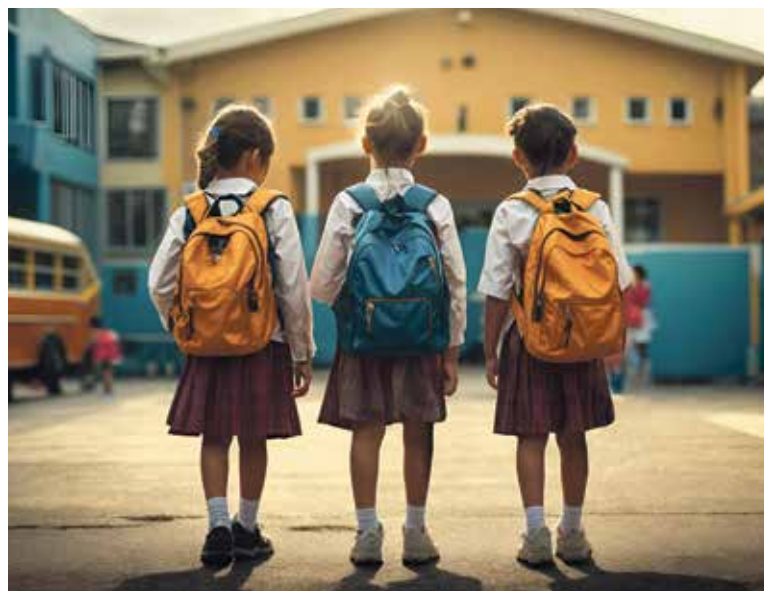
RADNICE chce opatřením docílit, že vzdělávání bude spravedlivě dostupné pro všechny místní děti.

Navrhovaná opatření se zaměří na posílení ověřování trvalého bydliště u zápisů do základních škol. Pokud dítě získalo trvalé bydliště v Praze 10 méně než tři měsíce před zápisem nebo pokud