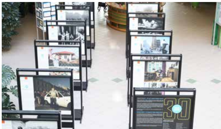
NÁVŠTĚVNÍCI výstavy se přesvědčí, že Praha má mnoho podob.

Grant Prahy je součástí každoročně udílené druhé hlavní ceny – jedná se o roční tvůrčí stipendium na monitorování proměn Prahy. Oceněného autora vybírá osobně primátor hlavního města Prahy na doporučení mezinárodní poroty a díky vzniklým fotografiím získává hlavní město jedinečný pohled na metropoli zachycenou z různých tematických úhlů i na její podobu postupem času. (red)