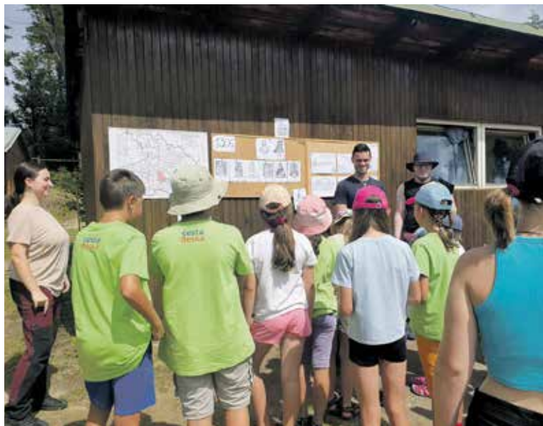
HLAVNÍ program tábora s detektivní zápletkou je vhodný zejména pro děti milující tajemství, záhady a dobrodružství.

Praha – Cesta Česka, spolek věnující se zřizování poutních stezek, propagaci putování a organizaci mimoškolních aktivit pro děti a mládež, pořádá letní tábor pro děti od 7 do 15 let, který se uskuteční od soboty 26. 7. do soboty 9. 8. v základně Ledeta ve Zvůli u Kunžaku. Na táboru s názvem Rytíř a Dáma se děti učí samostatnosti, týmovosti, slušnosti, statečnosti a dalším dovednostem. Celotáborová hra je připravena s detektivní zápletkou. Letošní osmý ročník má kapacitu 40 dětí a závaznou elektronickou přihlášku je nutné zaslat nejpozději do 30. dubna. Cena za dítě je 8 900 Kč, částka se změní v případě přihlášení sourozenců. Více informací včetně přihlášky je k dispozici na webu spolku: https://www.cestaceska.cz/cs/letni-tabory/letni-tabor-2025.html . (red)