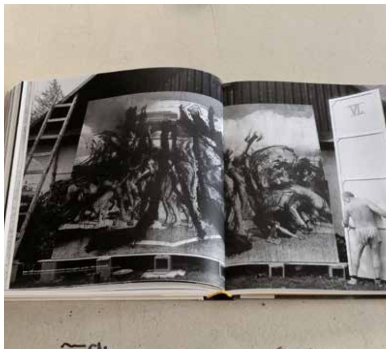
PAVEL Jasanský se věnoval také pozoruhodným prostorovým instalacím.

osobností zejména z pražské hudební, divadelní i literární scény a tyto aktivity dlouhodobě dokumentoval. Fotil pro Poetickou vinárnu Viola, Balet Praha, Divadla za branou a Na zábradlí. Fotografoval také pro hudební průmysl, zejména pro Supraphon a Panton, veřejnosti jsou tak známé desítky přebalů gramofonových desek s Jasanského fotografiemi. Vedle fotografické tvorby se začal postupně věnovat volné tvorbě, která se od asambláží a grafik posunula až k velmi pozoruhodným prostorovým instalacím. Tato tvorba je veřejnosti v podstatě neznámá. (red)