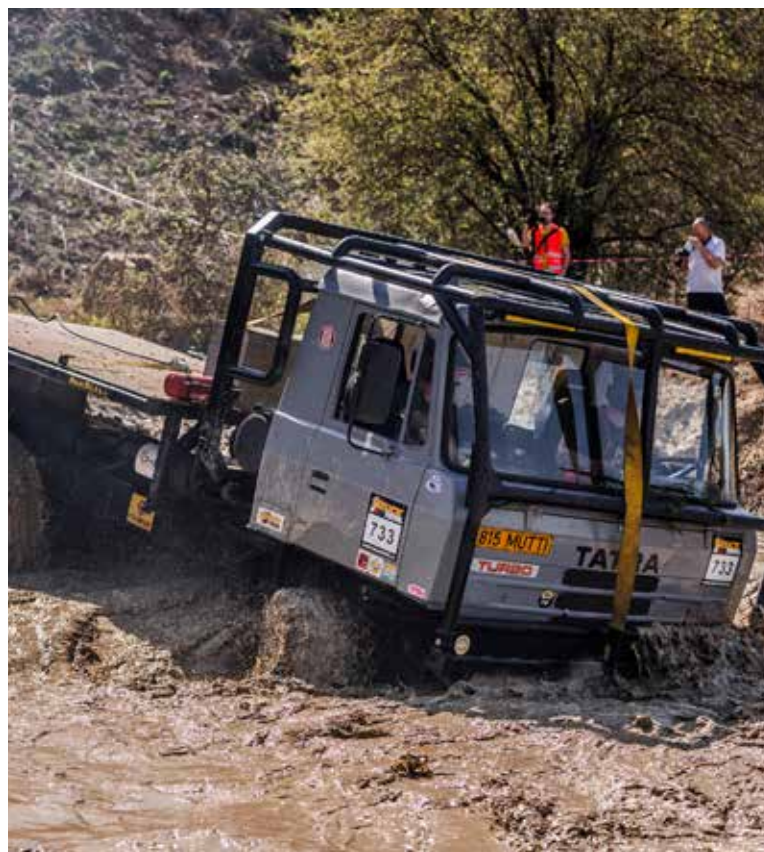
V ZÁVODECH nejde o rychlost, ale především o jezdecké umění.

5. 4. - 6. 4. Milovice u Nymburka 26. 4. - 27. 4. Braňany u Mostu 24. 5. - 25. 5. Mohelnice (Pořádá Velká cena Mohelnice) 14. 6. - 15. 6. Jihlava 9. 8. - 10. 8. Kunštát 30. 8. - 31. 8. Valašské Meziříčí 20. 9. - 21. 9. Vřesová u Sokolova