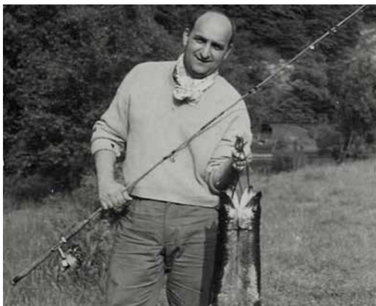
SPISOVATEL Ota Pavel byl vášnivý rybář.