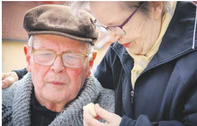
ODBORNÍCI varují, že někteří staří lidé vinou svého zdravotního stavu nezvládnou práci s datovou schránkou. Přijdou tak o bydlení?

Ředitelka Platformy pro sociální bydlení Barbora Bírová