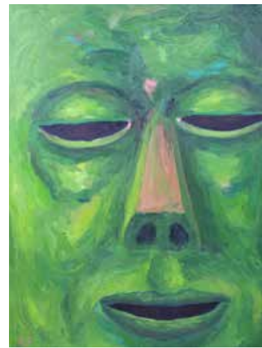
OLEJOMALBA Empty Head.