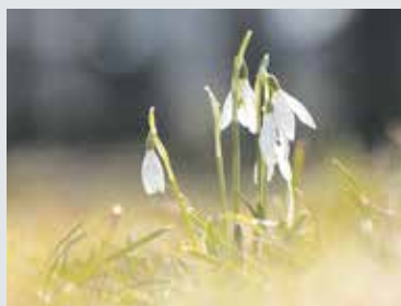
JARO se probouzí...

V posledních letech se v Praze konalo několik vědeckých se-