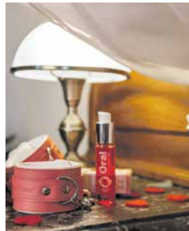
ZPESTRĚTE si milostné chvíle erotickými pomůckami.

Odpovězte na soutěžní otázku do 10. 4. 2025 na e-mail: soutez@ceskydomov.cz a do