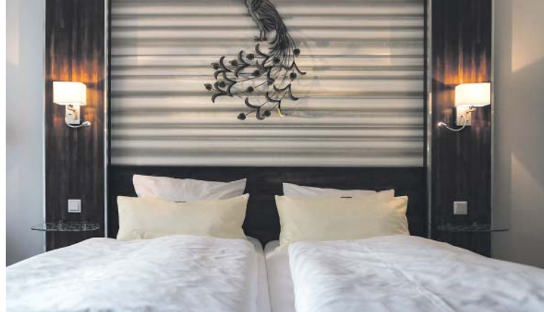
UBYTOVÁNÍ pouze formou sdílených pokojů lze podle analýzy IPR považovat v Praze za prakticky neexistující.

IPR vypracoval první analýzu krátkodobých pronájmů v soukromí v roce 2018, její současná podoba je třetí aktualizací, ve které doplňuje data za roky 2022 a 2023. Dle čísel z minulého roku je patrný rostoucí trend pronajímá-