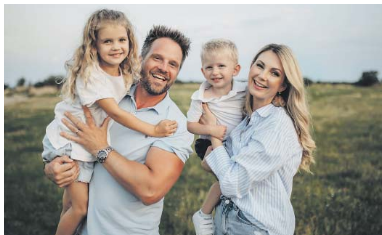
NEJVÍCE šťastná je se svou rodinou.

A z úplně jiného soudku. Jaký je váš názor na tetování? Vyhýbáte se mu, nebo sama nějaké máte? A co úpravy plastických chirurgů?