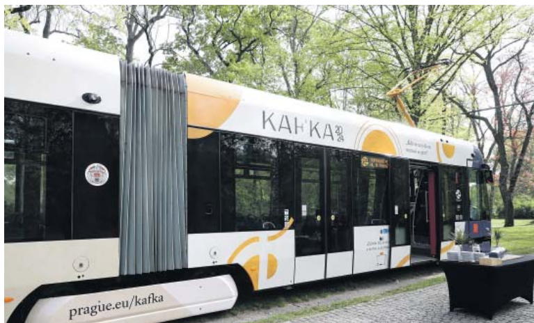
NA OSOBNOST Franze Kafky upozorňuje v pražských ulicích speciálně nazdobená tramvaj.

korun, jejíž součástí je speciálně nazdobená tramvaj s motivy Kafkova života. K dispozici je rovněž webová stránka Franz Kafka – Prague.eu, kde zájemci naleznou základní informace o spisovateli, ikonická místa v Praze a také vycházky s průvodci po místech Kafkova mládí a dalších let života. (red)