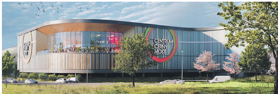
CENTRUM Černý Most bylo otevřeno v roce 1997 coby vůbec první nákupní centrum v České republice. Prvním rozšířením prošlo už v roce 2013, nyní je připraveno další.

■ Společnost Unibail–Rodamco–Westfield oznámila, že oblíbené obchodní Centrum Černý Most podstoupí významné rozšíření. Projekt, realizovaný s důrazem na udržitelnost, přinese 32 nových obchodů a restaurací a tři nové kinosály.