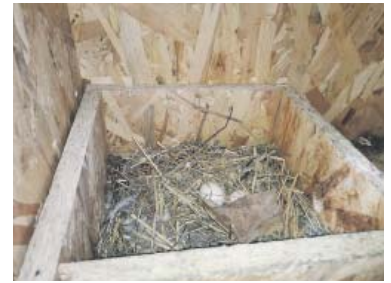
SNŮŠKA je v holubníku redukována, v dlouhodobém výhledu tak dojde k poklesu pražské populace holubů.

že holubi se dovnitř lákají tím nejjednodušším způsobem – miskami plnými zrní. Zvířata tu navíc mají pocit bezpečí, protože holubník je pod střechou. „Není proto zabezpečen proti predátorům,