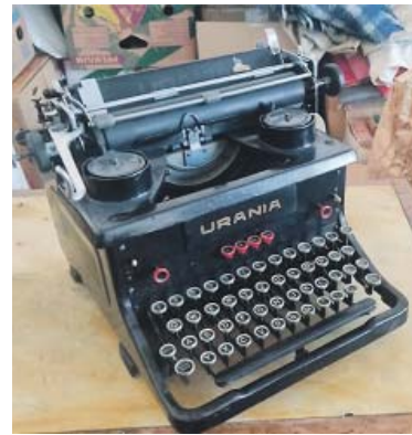
LUSTIGŮV psací stroj je součástí nového komunitního centra. Foto: MČ Praha 8

dětí by zde mohly získat i zajímavý pracovní prostor. „Do budoucna zde chceme vytvořit místo, kde si třeba maminka bude pracovat na počítači a děťátko by jí mezitím hlídali pracovníci centra. To je ale zatím pouze v plánu. V obchůdku budou věci z druhé ruky zaměřené na rodinu. Drobný nábytek, lampičky, židličky a podobně. Budeme zjišťovat, o co by byl mezi lidmi zájem, a případně sortiment rozšíříme. Spíše to ale budou drobnější věci například pro maminky samoživitelky a podobně,“ dodala Solomonová. Zdroj: MČ Praha 8