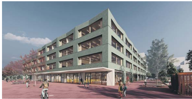
ZŠ ROHAN bude částečně čtyřpodlažní, v třípodlažní části budou umístěny tělocvičny a prostory pro zaměstnance. Vizualizace: IGLOO ARCHITEKTI

Ateliér IGLOO ARCHITEKTI skončil v architektonické soutěži o návrh nové školy jako druhý. S vítězem soutěže se městská část však nedohodla na ceně za projektovou dokumentaci, kterou označil znalecký posudek za nadhodnocenou. S vítězem se městská část rozcházela i na podobě kontraktu. Praha 8 proto zahájila jednání s architekty z IGLOO, kteří se v soutěži umístili na druhém místě. Nabídku této kanceláře vyhodnotily znalecké posudky jako reálnou a cenově odpovídající. Po podpisu smlouvy zahájí architekti neprodleně projekční práce