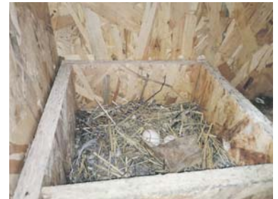
SNŮŠKA je v holubníku redukována, v dlouhodobém výhledu tak dojde k poklesu pražské populace holubů.

že holubi se dovnitř lákají tím nejjednodušším způsobem – miskami plnými zrní. Zvířata tu navíc mají pocit bezpečí, protože holubník je pod střešou. „Není proto zabezpečen proti predátó-