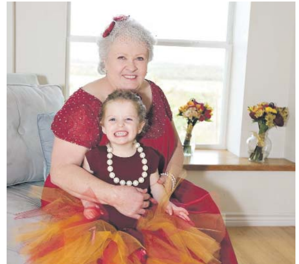
NÁHRADNÍ babička může vypomoci s hlídáním dětí.

Vztah mezi rodinou a náhradní babičkou nebo dědečkem je již na svobodné domluvě obou stran. Měl by fungovat na principu přátelského vztahu a případně může být upraven i na základě samostatně občanskoprávní smlouvy uzavřené mezi rodinou a náhradní babičkou/dědečkem dle zákona č. 89/2012 Sb., občanský zákoník v platném znění. Zdroj: MČ Praha 7