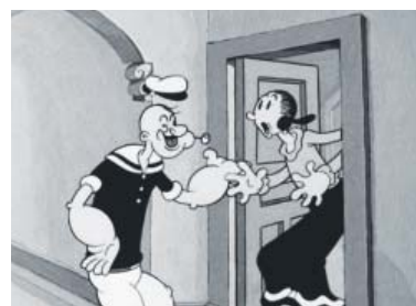
PŘÍBĚH Olive Oylové se zhmotní na scéně Divadla VILA.

Štvanice – Nekompromisní text izraelské autorky Šivan Ben Yishai LÁSKA/Argumentační cvičení bourá veškerá tabu týkající se údelu ženy po boku muže v současné společnosti a chytrým i zábavným způsobem pracuje s paralelou hlavní, ale zároveň spíše vedlejší ženské postavy z animovaného seriálu o Pepkovi námořníkovi. Českou premiéru kontroverzní hry režisruje na pražské ostrovní scéně v Divadle VILA Štvanice režisérka Kasha Jandáčková. Divadlo LETÍ inscenaci uvede ve dvou premiérách – 2. a 4. května od 20.00 hod.