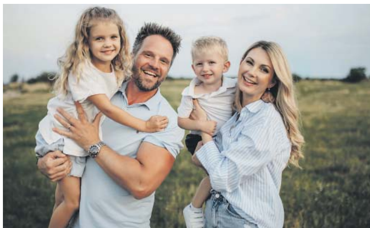
NEJVÍCE šťastná je se svou rodinou.

A z úplně jiného soudku. Jaký je váš názor na tetování? Vyhýbáte se mu, nebo sama nějaké máte? A co úpravy plastických chirurgů?