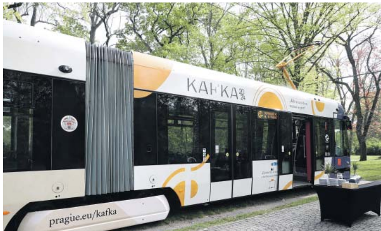
NA OSOBNOST Franze Kafky upozorňuje v pražských ulicích speciálně nazdobená tramvaj.

korun, jejíž součástí je speciálně nazdobená tramvaj s motivy Kafkova života. K dispozici je rovněž webová stránka Franz Kafka – Prague.eu, kde zájemci naleznou základní informace o spisovateli, ikonická místa v Praze a také vycházky s průvodci po místech Kafkova mládí a dalších let života. (red)