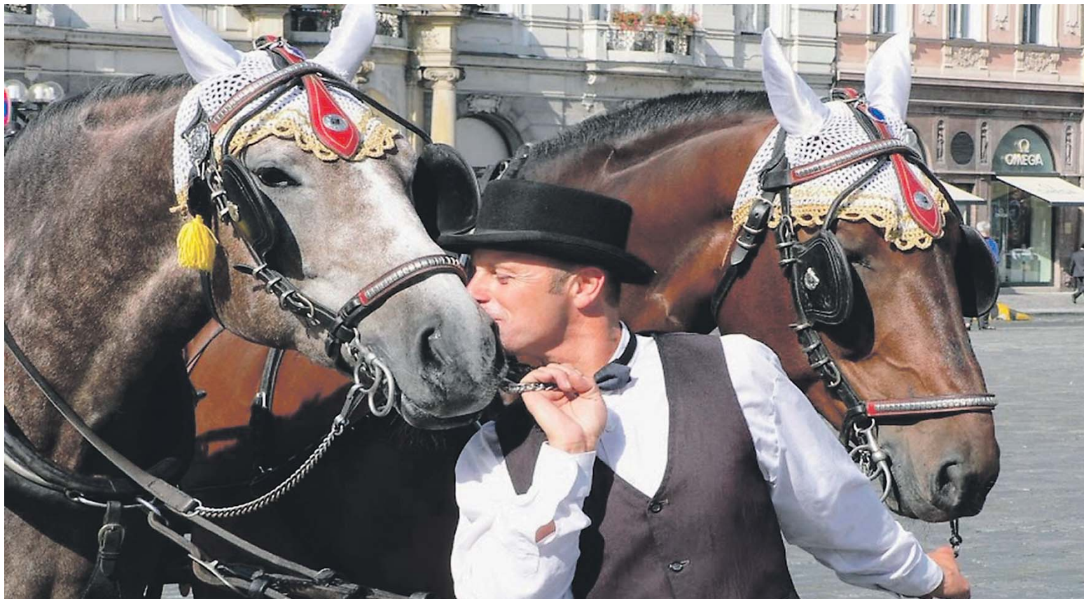
TRADIČNÍ pražský fiakr končí...

■ Pražští fiakristé a milovníci koní ve druhé polovině března protestovali na Zastupitelstvu hlavního města Prahy, aby podpořili politickou opozici v její snaze ukončit šikanu drožkářů ze strany magistrátu. Pražský magistrát se totiž za aktivního přispění především Pirátů pokouší dlouhodobě zakázat využívání koní k provozu kočárů.