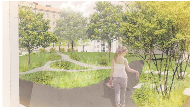
VE VNITROBLOKU budou vysazeny nové stromy i keře a založeny nové trvalkové záhony a travnaté plochy.

Ve vnitrobloku bude vybudována nová síť cest s různými povrchy a doplněno veřejné osvětlení. Prostor bude rozdělen do tří hlavních zón – trávnickového palouku s pergolou, hájku s vysokokmennými stromy