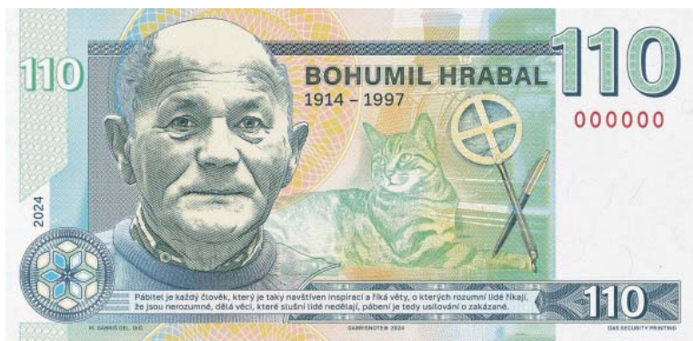
GRAFICKÝ NÁVRH Hrabalovy pamětní bankovky vytvořil Matěj Gábríš.

Legendární chatě se nyní navrácí původní podoba odpovídající tomu, jako když v ní žil samotný spisovatel. Expozice zavede zájemce na návštěvu k Hrabalovi domů a navodí atmosféru, jako kdyby si zrovna „odběhl pryč“. Polabské mu-