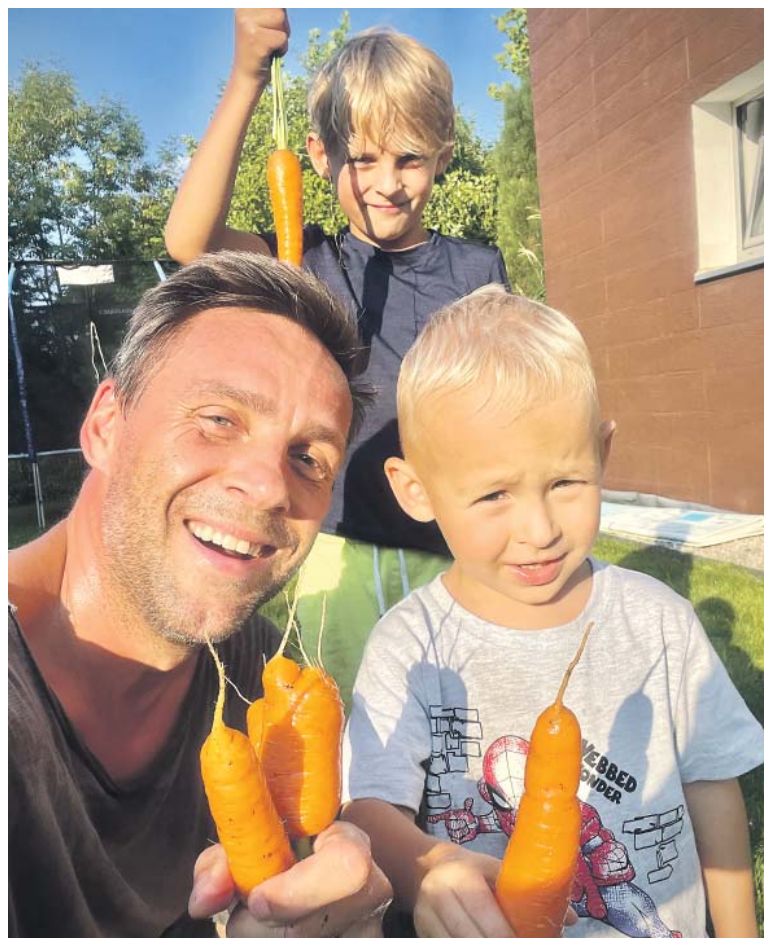
BYDLENÍ za Prahou přináší výhody, zahradičit může celá rodina.

No jeje (smích). Na finálním textu jsme pracovali asi čtyři chlapi, kteří mají dohromady asi 15 dětí, a každý z nás přispěl nějakým svým příběhem, svou historkou. A já okořenil také pár situací. Hlavně při porodu, který nás hlavní hrdina prožívá ve finále první půlky hry.