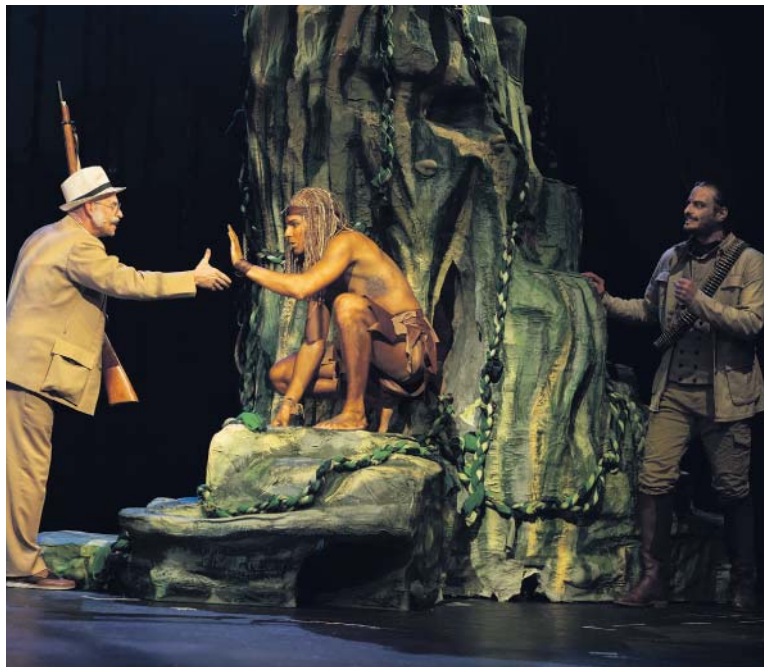
PRO Tarzana se stane osudovým okamžikem setkání s vědeckou výpravou.

Odpovězte na soutěžní otázku do 22. 4. 2024 na e-mail: soutez@ceskydomov.cz a přiřpte do předmětu e-mailu TARZAN. Deset výherců získá po dvou vstupenkách na představení Tarzan, o výhře budou informováni e-mailem.