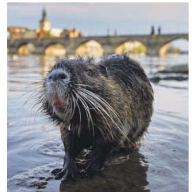
POTKAT nutrii u pražského břehu Vltavy už není žádná senzace.

A jak by Praha vypadala, kdyby lidé z města náhle zmizeli? Na tuto otázku odpovídá instalace ve virtuální realitě – v zatopeném metru se množí ryby, v centru bují hustý dubový les, ve kterém se mezi ruinami budov prohání stáda divokých prasat. I takto může vypadat Praha za sto let. Výstava je v CAMPu k vidění do 1. září. (red)