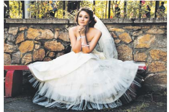
PRAŽANĚ a Pražanky se do manželského chomoutu neženou.

Praha – Počet obyvatel v hl. m. Praze vzrostl během roku 2023 podle předběžných údajů o 27 406 osob na celkových 1 384 732 obyvatel. Z toho bylo 670 680 mužů a 714 052 žen. Ženy tak tvořily 51,6 % z celkového počtu obyvatel. Tyto údaje, které zveřejnil Český statistický úřad, zahrnují také osoby, kterým byla udělena dočasná ochrana v souvislosti s válkou na Ukrajině. Za nárůstem počtu obyvatel stál především přírůstek stěhováním (27 043 osob), přirozenou měnou přibýlo 363 osob. V průběhu roku 2023 zemřelo celkem 12 212 osob a na svět přišlo 12 575 dětí. Praha tak byla jediným krajem ČR, ve kterém byl počet živě narozených vyšší než počet zemřelých. V hlavním městě bylo v roce 2023 uzavřeno 6 393 sňatků, oproti stejnému období předchozího roku se jednalo o pokles o 8,4 %. Počet uzavřených manželství v přepočtu na tisíc obyvatel dosáhl hodnoty 4,7. V minulém roce proběhlo v Praze také celkem 2 288 rozvodů. Jejich počet oproti roku 2022 rov-