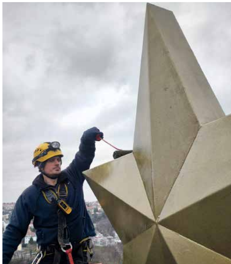
HVĚZDA zdobí nemovitost, která původně měla sloužit jako ubytovna pro vojáky, ale nakonec se z ní stal luxusní grand hotel.

Nicméně pamětníci z Dejvic vzpomínají i na zajímavý fakt, který možná většina Pražanů vůbec netuší. „Podle starších obyvatel Dejvic byla hvězda původně skleněná v kovovém rámu a uvnitř byl lev. Rám ovšem zkorodoval, lev byl vyňat a odvezen neznámo kam. Následně byla skleněná hvězda nahrazena kovovou, která též měla údajně zlatou barvu. Pak se teprve změnila barva na již zmíněnou zelenou. Bohužel se nám nepodařilo tyto údajné informace ověřit, takže je známe alespoň formou vzpomínek,“ dodává Filip Dlesk. (red)