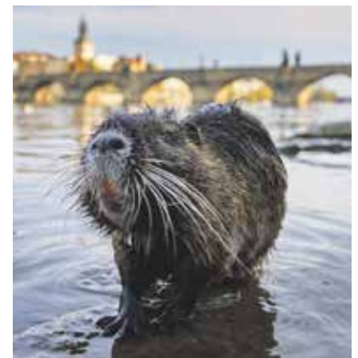
POTKAN nutrie u pražského břehu Vltavy už není žádná senzace.

A jak by Praha vypadala, kdyby lidé z města náhle zmizeli? Na tuto otázku odpovídá instalace ve virtuální realitě – v zatopeném metru se množí ryby, v centru bují hustý dubový les, ve kterém se mezi ruinami budov prohání stáda divokých prasat. I takto může vypadat Praha za sto let. Výstava je v CAMPu k vidění do 1. září. (red)