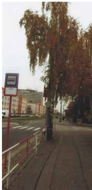
OSAMOCENÝ strom má i svou symboliku, bříza je považována za symbol jara.