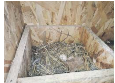
SNŮŠKA je v holubníku redukována, v dlouhodobém výhledu tak dojde k poklesu pražské populace holubů.

že holubi se dovnitř lákají tím nejjednodušším způsobem – miskami plnými zrní. Zvířata tu navíc mají pocit bezpečí, protože holubník je pod střešou. „Není proto zabezpečen proti predátó-