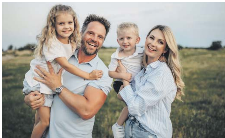
NEJVÍCE šťastná je se svou rodinou.

A z úplně jiného soudku. Jaký je váš názor na tetování? Vyhýbáte se mu, nebo sama nějaké máte? A co úpravy plastických chirurgů?