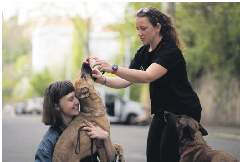
„CHCI, aby lidé, kteří navštěvují mé lekce, mohli se psem klidně chodit městem,“ říká psí trenérka (vpravo).

Ano, ale za absolutně největší úspěch považuji složení nejvyšších zkoušek hned ve třech kategoriích (sutinné, plošné a vodní vyhledávání), což má opravdu málokdo. A také, že se mi to podařilo právě s fenou April, nad kterou by spousta lidí zlomila hůl. Když jí bylo pár měsíců, hodil mi pod ní nějaký muž petardu. Bylo to absolutně nečekané a hrozně jsme se obrovské rány lekly. Jak jsem se už zmínila, součástí zkoušek je i odolnost vůči zvukům, a to byl pro nás obrovský problém. Několik let jsem zkoušela různé způsoby, jak se s jejím strachem vypořádat. Rozhodla jsem se nevzdát se a vyplatilo se to.