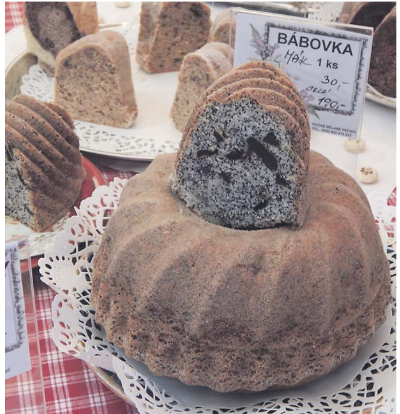
FARMÁŘSKÉ TRHY nabízejí také české tradiční sladkosti.

Politická opozice Prahy 5 v minulosti tepala vládnoucí koalici za to, že neumožnila uspořádání pátečních a velikonočních trhů. „Ani tak jednoduchou věc jako vybrat nájemce na velikonoční