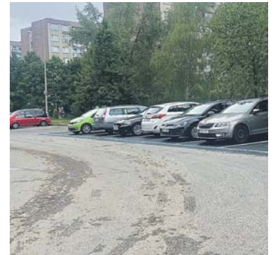
KDYŽ v pozdním odpoledni motorista najde v blízkosti pražského sídliště volné místo na zaparkování, nezřídkou mívá radost jako malé dítě o Vánocích...

možností, například výstavbou parkovacích domů. Důležitá je také úvaha o dlouhodobé finanční stabilitě pro projekty postupného vylepšování možností pro parkování, na které by vybrané poplatky měly být nasměrovány. Pro dokonalejší pražský systém rezidenčního parkování je proto stále více otázek než účinných odpovědí.“