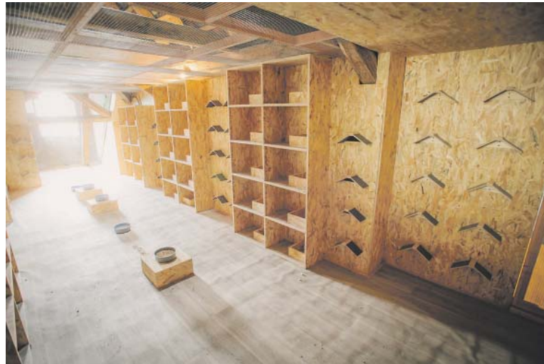
DALŠÍ městský holubník plánuje město postavit na Vítkově.

Holubník bývá zpravidla zaplněn z jedné třetiny, postupně však počet jeho obyvatel roste s tím, jak jej objevují další holubi žijící v jeho okolí, klidné místo