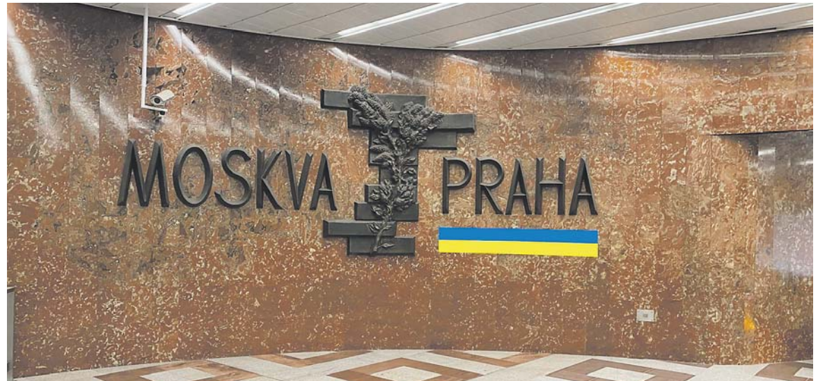
PO RUSKÉM vpádu na Ukrajinu byla plastika Moskva – Praha kýmisi doplněna o ukrajinskou vlajku.

Anděl – Odstraňování pozůstatků ruské (sovětské) přítomnosti v Praze zřejmě nemá konce. Mízi pomníky, přejmenovávají se ulice a nyní došlo i na plastiky ve vestibulu stanice Anděl směr Knížecí. Ty připomínají sovětský podíl na výstavbě metra (například eskalátory), kosmický program a v nedávné době také družbu Prahy a Moskvy. Vždyť i samotná stanice nesla dlouhou dobu název Moskevská. Pro mnohé cestující jsou proto i vzhledem k ruské agresi na Ukrajinu přežitkem, které by měly zmizet z veřejného prostoru. Vznikla kvůli tomu i petice. Kupodivu však nemá tento názor převahu, jak dosvědčuje například diskuze na sociální síti.