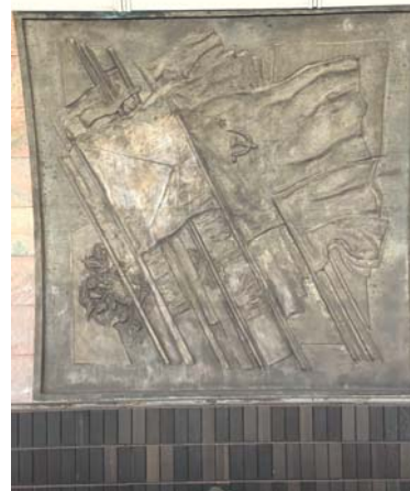
PLASTIKA se srpem a kladivem některé občany velice dráždí...

tujících, kterou podpořil další: „Co je na tom komunistického? Ta růže? Nebo nápis Moskva?“