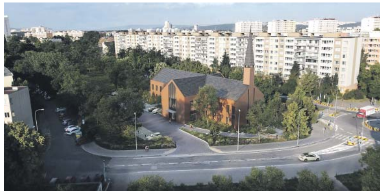
VIZUALIZACE podoby nového komunitního centra.