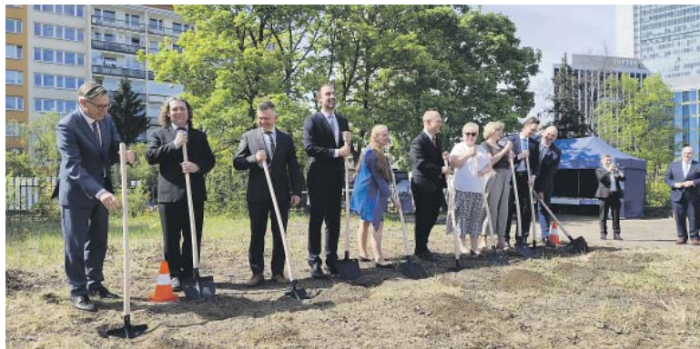
SLAVNOSTNÍHO VÝKOPU se zúčastnili církevní a političtí představitelé a další hosté.

■ Slavnostní výkop u příležitosti zahájení výstavby komunitního centra Církve Ježíše Krista Svatých posledních dnů proběhl v Praze 4 na pozemku mezi ulicemi Na Strži, Neveklovská a Jankovská. Zde bude stát budova komunitního centra, jejíž součástí bude kaple pro místní věřící, k tomu příslušející parkoviště a venkovní hřiště. Důležitým prvkem v této části zástavby je zachování zeleně a zpříjemnění životního prostředí pro místní obyvatele.