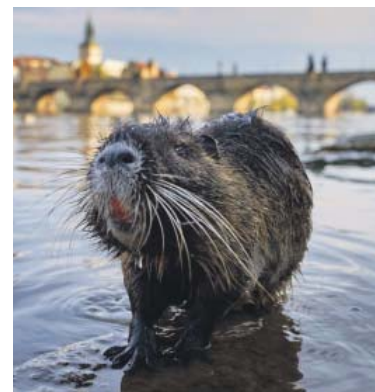
POTKAN nutrie u pražského břehu Vltavy už není žádná senzace.

A jak by Praha vypadala, kdyby lidé z města náhle zmizeli? Na tuto otázku odpovídá instalace ve virtuální realitě – v zatopeném metru se množí ryby, v centru bují hustý dubový les, ve kterém se mezi ruinami budov prohání stáda divokých prasat. I takto může vypadat Praha za sto let. Výstava je v CAMPu k vidění do 1. září. (red)