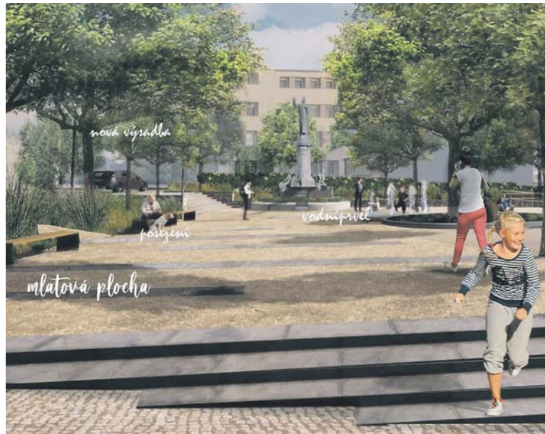
VIZUALIZACE nové podoby Branického náměstí.

„Náměstí bude nově přístupné i z přechodu přímo od Trigemy a zároveň bezbariérové. Dále bude instalována přízemní vodní fontána, renovována socha Jana Husa a dosazena nová stromová a keřová vegetace včetně trvalkových záhonů,“ přiblížil radní Prahy 4 pro životní prostředí a místní Agendu 21 Tomáš Hrdinka (ANO 2011). V západní části náměstí při ulici Ke Křči budou pod zachovanými vzrostlými stromy renovovány travnaté plochy pro rekreační využití. Náměstí dostane kromě kompletně nového mobiliáře i nové kombinované osvětlení s dvojí barvou světla (žlutá