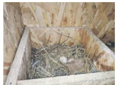
SNŮŠKA je v holubníku redukována, v dlouhodobém výhledu tak dojde k poklesu pražské populace holubů.

že holubi se dovnitř lákají tím nejjednodušším způsobem – miskami plnými zrní. Zvířata tu navíc mají pocit bezpečí, protože holubník je pod střechou. „Není proto zabezpečen proti predáto-