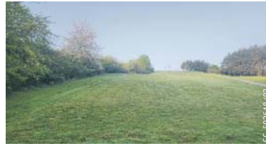
MILÍČOVSKÉ kopce prokoukly.

Z území, které trpělo zanedbáním po několik desetiletí, byl vytvořen lesopark podle pětiletého plánu péče. Nyní slouží jako nárazníková zóna pro návštěvníky přírodní památky Milíčovský les. Jeho účelem je přitahovat a zadržovat část návštěvníků, kteří by jinak procházeli přímo do Milíčovského lesa.