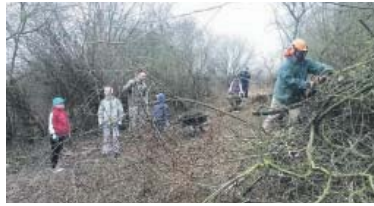
S ÚKLIDEM pomáhaly také děti.

„První fáze úprav Milíčovských kopců započala v roce 2019 a od roku 2024 jsme vstoupili do etapy následné péče. Úplně prvním úkolem bylo vyčištění a odstranění několika tun odpadků z území kopců. Tento odpad se nahromadil během několika let, kdy lidé bez domova přinášeli různé předměty na tato místa. Také jsme odstranili mnoho provizorních obydlí,“ říká Pavel