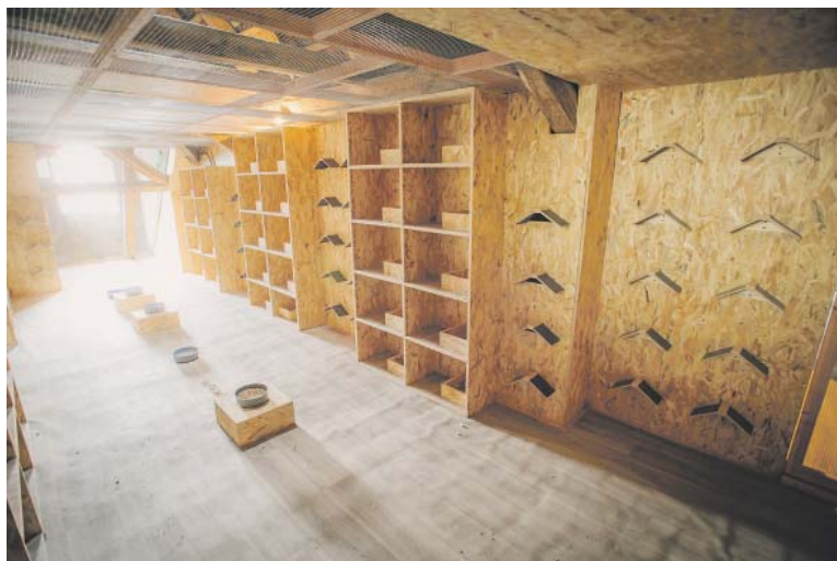
DALŠÍ městský holubník plánuje město postavit na Vítkově.

Holubník bývá zpravidla zaplněn z jedné třetiny, postupně však počet jeho obyvatel roste s tím, jak jej objevují další holubi žijící v jeho okolí, klidné místo