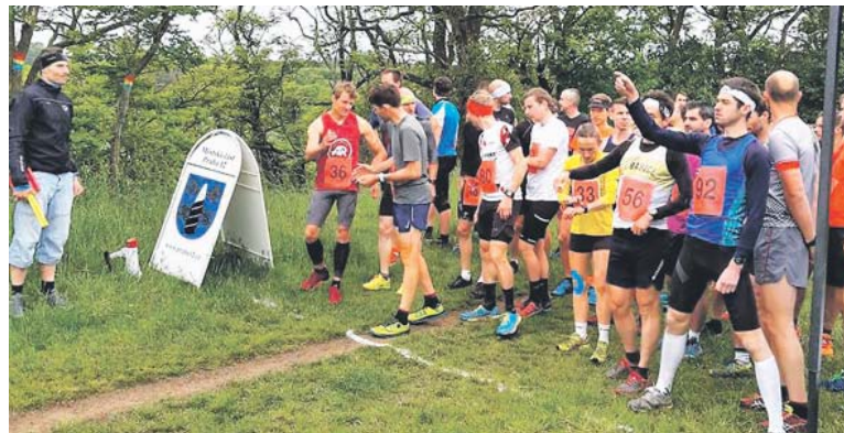
MČ PRAHA 12 zve na první závod Modřanského trojboje, který se uskuteční 28. dubna od 9.00 hod. na louce U Lišících děr. Další závody jsou naplánovány na 6. června (Komořany - Čihadlo) a 29. srpna bude Běh Modřanskou roklí. Bližší informace na www.modranyravine-run.cz . (red)

ku své tvorby, tedy více než sedm dekad. V roce 1965 založil a do roku 1979 vedl ateliér Sklo v architektuře na Vysoké škole výtvarných umění v Bratislavě. Po návratu z Bratislavy vytvořil například interaktivní světelný objekt pro stanici metra Náměstí Míru (1978), skleněné stély a interiér stanice metra Náměstí Republiky (1983-1985) a dvě skleněné matnice pro vestibul stanice metra Křižíkova (1988). Nesmazatelně se zapsal do dějin světového výtvarného umění tím, že jako první začal pracovat s optickým sklem. (jš)