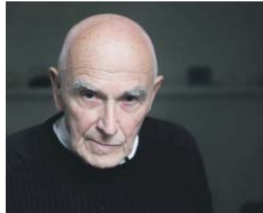
VÁCLAV CIGLER byl v roce 2019 oceněn za celoživotní dílo, pedagogickou činnost a přínos v oblasti výtvarného umění cenou Ministerstva kultury České republiky.

Chodov - Velká galerie Chodovské tvrze připravila výstavu Václav Cigler - Kresby, objekty, která je přístupná do 26. května. Jubilující sochař, architekt a pedagog Václav Cigler (*1929) patří ke světově uznávaným autorům umělecké generace nastupující na počátku 60. let dvacátého století. Jeho tvorba je zaměřena na plastické objekty z broušeného optického skla, návrhy a realizace světelných struktur a šperků, kresby, projekty do krajiny a kompozice pro architekturu. Kresbou se zabývá od počát-