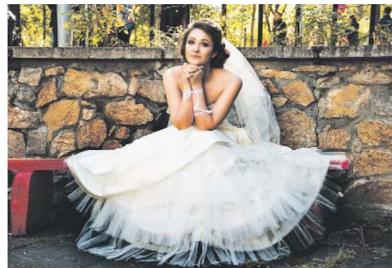
PRAŽANÉ a Pražanky se do manželského chomoutu neženou.

Praha - Počet obyvatel v hl. m. Praze vzrostl během roku 2023 podle předběžných údajů o 27 406 osob na celkových 1 384 732 obyvatel. Z toho bylo 670 680 mužů a 714 052 žen. Ženy tak tvořily 51,6 % z celkového počtu obyvatel. Tyto údaje, které zveřejnil Český statistický úřad, zahrnují také osoby, kterým byla udělena dočasná ochrana v souvislosti s válkou na Ukrajině. Za nárůstem počtu obyvatel stál především přírůstek stěhováním (27 043 osob), přirozenou měnou přibývalo 363 osob. V průběhu roku 2023 zemřelo celkem 12 212 osob a na svět přišlo 12 575 dětí. Praha tak byla jediným krajem ČR, ve kterém byl počet živě narozených vyšší než počet zemřelých. V hlavním městě bylo v roce 2023 uzavřeno 6 393 sňatků, oproti stejnému období předchozího roku se jednalo o pokles o 8,4 %. Počet uzavřených manželství v přepočtu na tisíc obyvatel dosáhl hodnoty 4,7. V minulém roce proběhlo v Praze také celkem 2 288 rozvodů. Jejich počet oproti roku 2022 rov-