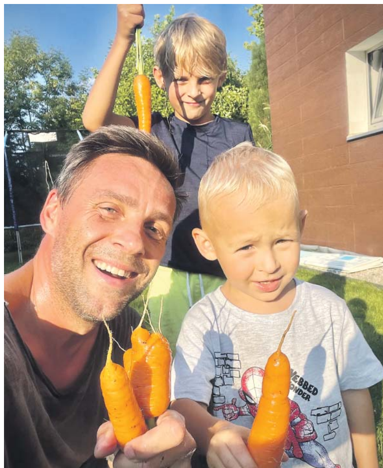
BYDLENÍ za Prahou přináší výhody, zahradičit může celá rodina.

No jeje (smích). Na finálním textu jsme pracovali asi čtyři chlapi, kteří mají dohromady asi 15 dětí, a každý z nás přispěl nějakým svým příběhem, svou historkou. A já okořenil také pár situací. Hlavně při porodu, který nás hlavní hrdina prožívá ve finále první půlky hry.