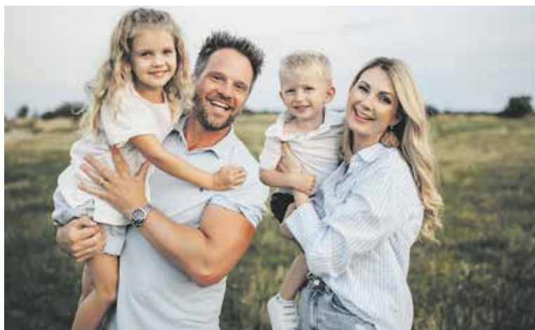
NEJVÍCE šťastná je se svou rodinou.

A z úplně jiného soudku. Jaký je váš názor na tetování? Vyhýbáte se mu, nebo sama nějaké máte? A co úpravy plastických chirurgů?