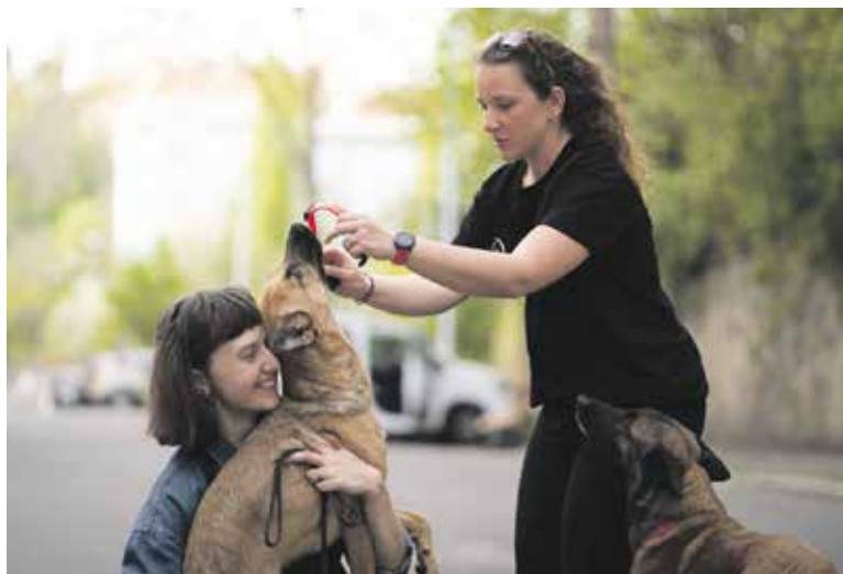
„CHCI, aby lidé, kteří navštěvují mé lekce, mohli se psem klidně chodit městem,“ říká psí trenérka (vpravo).

Ano, ale za absolutně největší úspěch považuji složení nejvyšších zkoušek hned ve třech kategoriích (sutinné, plošné a vodní vyhledávání), což má opravdu málokdo. A také, že se mi to podařilo právě s fenou April, nad kterou by spousta lidí zlomila hůl. Když jí bylo pár měsíců, hodil mi pod ní nějaký muž petardu. Bylo to absolutně nečekané a hrozné jsme se obrovské rány lekly. Jak jsem se už zmínila, součástí zkoušek je i odolnost vůči zvukům, a to byl pro nás obrovský problém. Několik let jsem zkoušela různé způsoby, jak se s jejím strachem vypořádat. Rozhodla jsem se nevzdát se a vyplatilo se to.