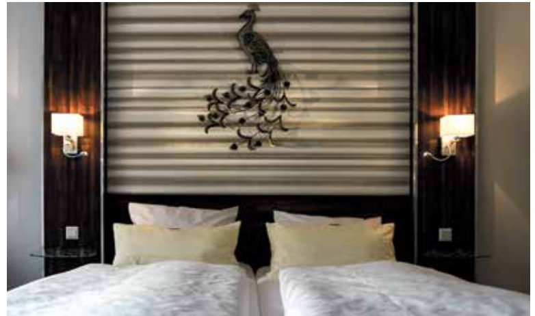
UBYTOVÁNÍ pouze formou sdílených pokojů lze podle analýzy IPR považovat v Praze za prakticky neexistující.

IPR vypracoval první analýzu krátkodobých pronájmů v soukromí v roce 2018, její současná podoba je třetí aktualizací, ve které doplňuje data za roky 2022 a 2023. Dle čísel z minulého roku je patrný rostoucí trend pronajímáných nemovitostí způsobený postupným obnovením turistického ruchu po pandemických letech. Vzhledem k trendu růstu v hlavním městě pravděpodobně dojde k vyrovnání objemu nabídek s hodnotami před pandemií. (red)