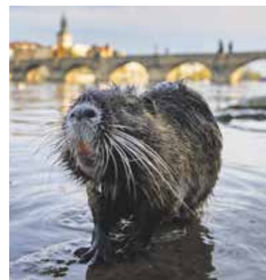
POTKAN nutrie u pražského břehu Vltavy už není žádná senzace.

A jak by Praha vypadala, kdyby lidé z města náhle zmizeli? Na tuto otázku odpovídá instalace ve virtuální realitě – v zatopeném metru se množí ryby, v centru bují hustý dubový les, ve kterém se mezi ruinami budov prohání stáda divokých prasat. I takto může vypadat Praha za sto let. Výstava je v CAMPu k vidění do 1. září. (red)