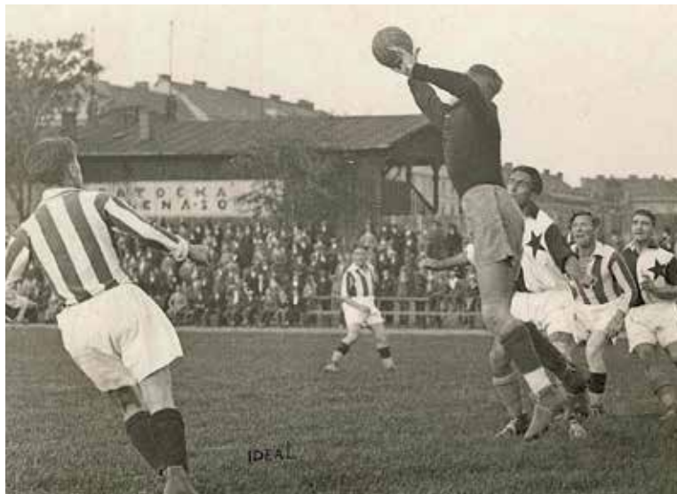
POSTAVOU nevysoký brankář (172 cm) sehrál za Slavii téměř tisíc zápasů.

Praha 10 – U příležitosti tematického roku Františka Pláničky chystá desítky ve spolupráci se Slavii Praha řadu aktivit, které jsou s fotbalovou legendou přímo i nepřímo spojeny. „Společným cílem radnice a Slavie je připomenout odkaz legendárního brankáře skrze řadu sportovních, kulturních, volnočasových, ale také například i vzdělávacích aktivit se zaměřením na obyvatele desítky. Výstavy, promítání, první ročník Poháru Františka Pláničky pro žáky základních škol, speciální formát turnaje tzv. walking football pro seniory a spousta dalších akcí. Věřím, že na konci roku dojde také k udělení čestného občanství Prahy 10, které si dle mého Plánička jednoznačně zaslouží,“ uvedl Pavel Šutka (ODS), místostarosta Prahy 10 odpovědný za kulturu, sport a volný čas.