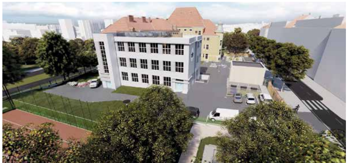
CELKOVÁ investice do rekonstrukce školy aktuálně činí 465 milionů korun, kterou pokrývá Magistrát hlavního města Prahy a městská část Praha 10.

Zápis do školy proběhne v dubnu 2025 a rodiče se o přesném termínu dozví z nového webu www.zsvolsinach.cz . V rámci zápisu do tříd se musí rodiče rozhodnout o přesunu svého dítěte do nové školy, pro hladký přechod z jedné školy do druhé nabídne škola adaptační kurzy. „Specifikem nové základní školy V Olšínách bude důraz na rozšířenou výuku cizích jazyků s výběrem až ze čtyř jazyků. Rovněž chceme dětem nabídnout navýšený počet hodin tělesné výchovy. Součástí školy bude i poradenské pracoviště s psychologem a speciálním pedagogem,“ komentuje zaměření školy Ondřej Počarovský (TOP 09), radní pro oblast školství a vzdělávání v Praze 10. (red)