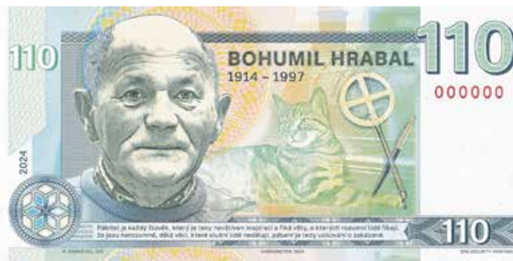
GRAFICKÝ NÁVRH Hrabalovy pamětní bankovky vytvořil Matěj Gábriš.

Legendární chatě se nyní navrácí původní podoba odpovídající tomu, jako když v ní žil samotný spisovatel. Expozice zavede zájemce na návštěvu k Hrabalovi domů a navodí atmosféru, jako kdyby si zrovna „odběhl pryč“. Polabské mu-