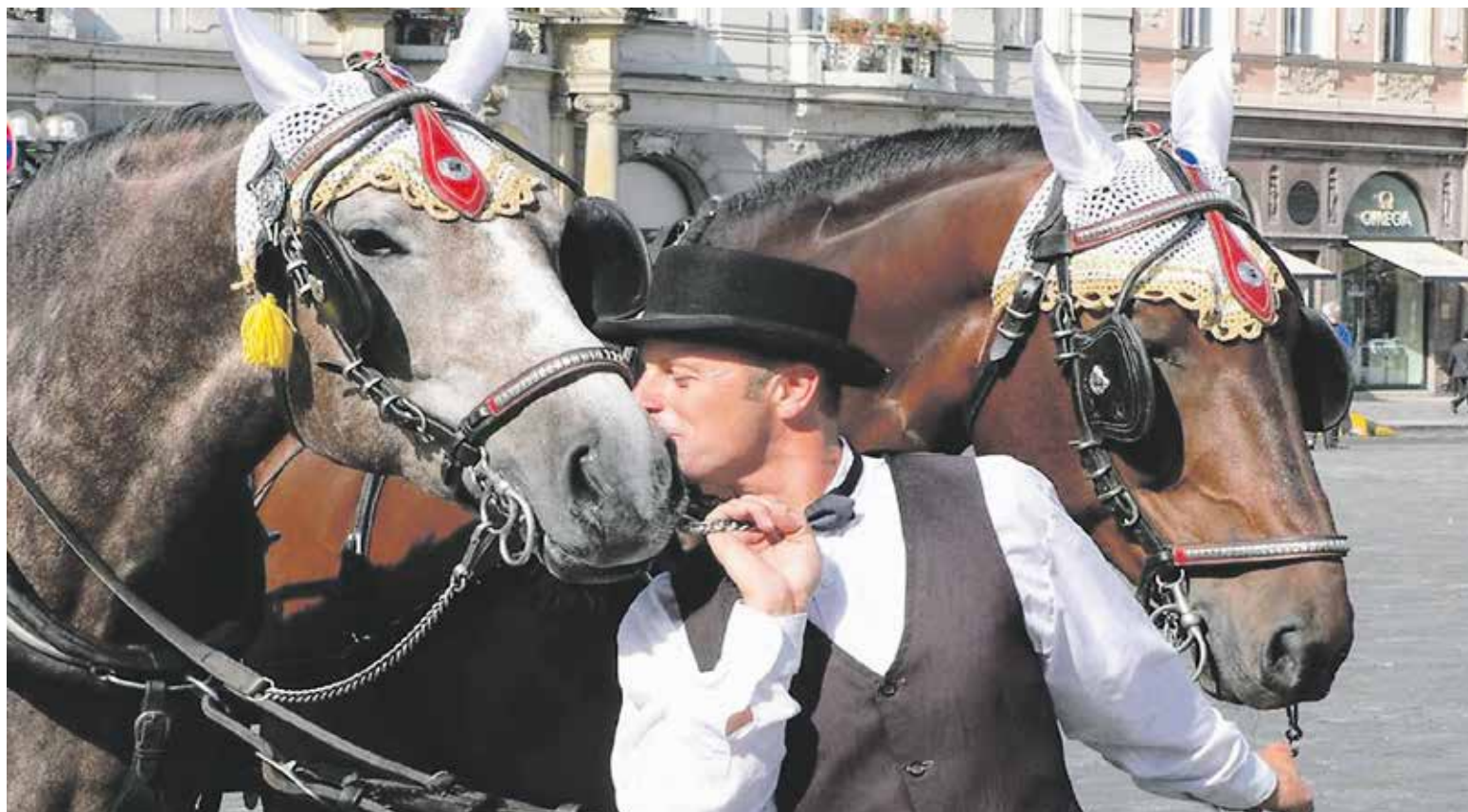
TRADIČNÍ pražský fiakr končí...

■ Pražští fiakristé a milovníci koní ve druhé polovině března protestovali na Zastupitelstvu hlavního města Prahy, aby podpořili politickou opozici v její snaze ukončit šikanu drožkářů ze strany magistrátu. Pražský magistrát se totiž za aktivního přispění především Pirátů pokouší dlouhodobě zakázat využívání koní k provozu kočárů.