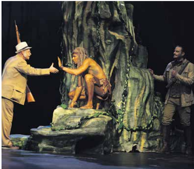
PRO Tarzana se stane osudovým okamžikem setkání s vědeckou výpravou.

Nápovědu najdete na www.hybernia.eu/predstaveni/tarzan/