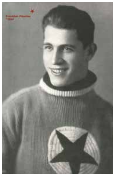
FRANTIŠEK Plánička byl vzorem nejen pro svou klubovou věrnost, ale také pro svoji skromnost, příkladnou celoživotní životosprávu a profesionalismus.

■ Program tematického roku je navržen tak, aby připomněl mimořádný sportovní a společenský přínos legendy sešivaných a národního týmu, která byla považována za rytíře na hřišti i mimo něj. Odstartoval v dubnu a přinese akce pro děti i dospělé, fanoušky fotbalu i milovníky kultury.