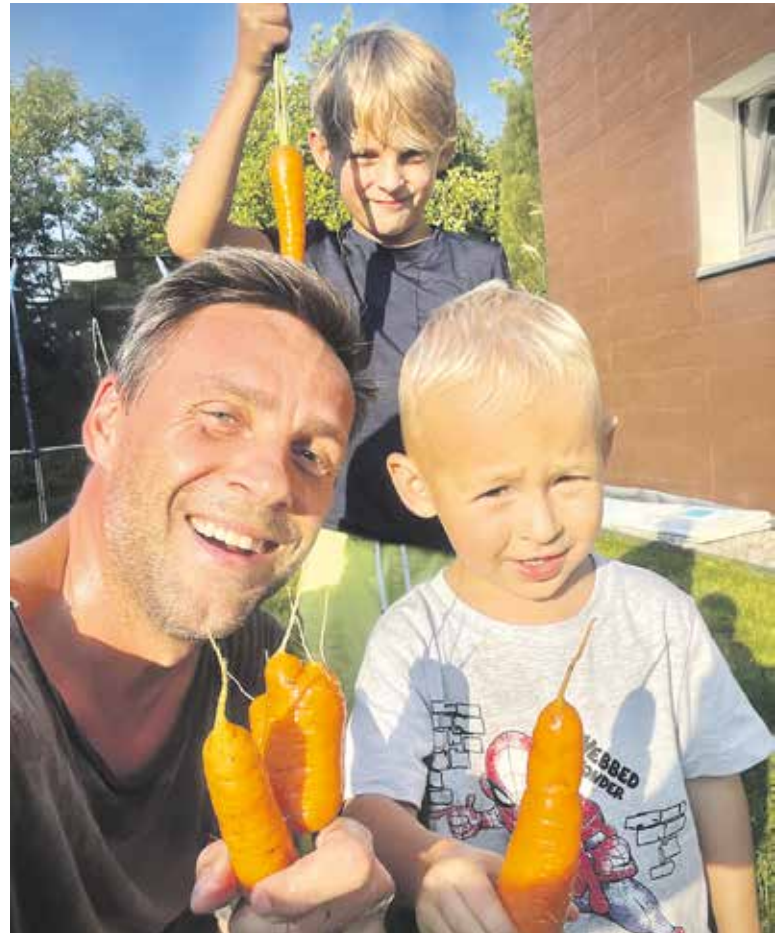
BYDLĚNÍ za Prahou přináší výhody, zahradičit může celá rodina.

No jéje (smích). Na finálním textu jsme pracovali asi čtyři chlapi, kteří mají dohromady asi 15 dětí, a každý z nás přispěl nějakým svým příběhem, svou historkou. A já okořenil také pár situací. Hlavně při porodu, který náš hlavní hrdina prožívá ve finále první půlky hry.