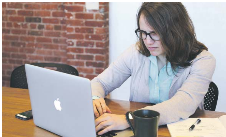
Z DLOUHOLETÝCH zkušeností společnosti Scio vyplývá, že ideální je ukončit přípravu zhruba týden před přijímačkami.

Příprava na přijímačky se dá rozdělit do dvou hlavních směrů. První z nich se soustředí na procvičování a doučování látky, druhý na testování, a tedy na ověření nabytých znalostí. Většina dětí kombinuje oba přístupy a třeba podle dlouholetých zkušeností společnosti Scio se většina dětí vrhla naplno na přípravu už v průběhu ledna, nejpozději února, zároveň ale čím se čas krátí, tím intenzivněji se všichni připravují. Nabídka je dnes opravdu široká, a proto při výběru konkrétní přípravy nebo přijímaček nanečisto je vždy dobré zjistit si reference o tom, kdo takové služby nabízí. Například jaké má zkušenosti, jak dlouho působí v oblasti vzdělávání nebo jsou jeho testy