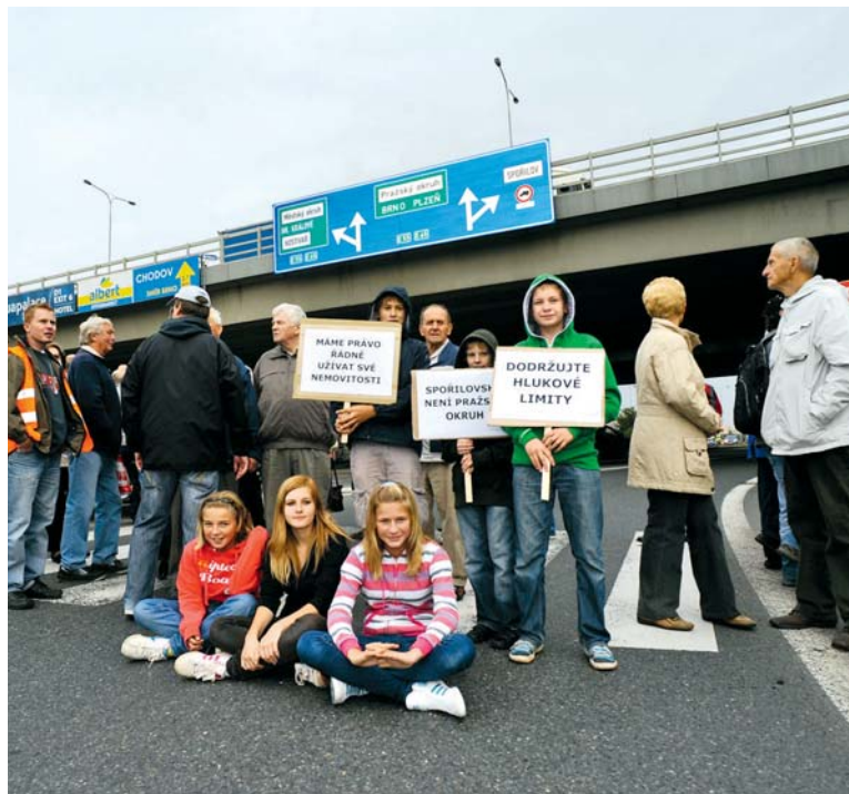
PROTI intenzivní kamionové dopravě středem Spořilova místní obyvatelé již několikrát protestovali.

Jednoznačným cílem Ředitelství silnic a dálnic je započít stavbu ještě letos. Musí ale překonat ještě celou řadu překážek, od samotného výběru zhotovitele až po vydání stavebního povolení, a stále ještě navíc probíhá majetkoprávní příprava. Rizik v podobě ohrožení termínu je tedy ještě dost. Minimálně by ale zhruba v dubnu měly začít archeologické práce. Samotná stavba je plánována na 36 měsíců. Pokud by se začalo už letos, část okruhu by mohla být dokončena v roce 2027. (red)