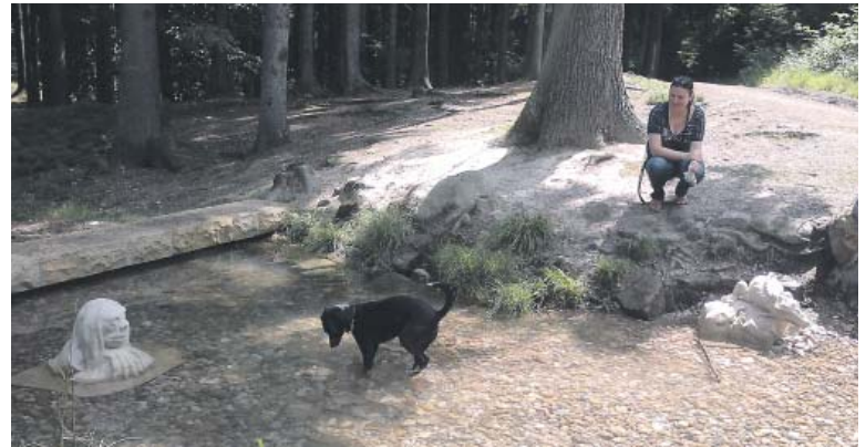
PŘI PROCHÁZKÁCH v přírodě nezapomínejte, že i váš psí parťák potřebuje dodržovat pitný režim.

Jaro je nejen období začínajícího teplého počasí, ale také kvetoucích rostlin, které jsou plné pylu. Myslete na to, že ani u psů není alergie na pyl nic neobvyklého. U psů však nečekejte rýmu, slzení očí a kýčání. Místo toho nejčastěji nastupuje atopická dermatitida projevující se svěděním a zarudlou kůží někdy i s tvorbou pupínek a šupinek. Psi na podráždění reagují jednoduše zvýšeným drbáním se, a to hlavně na hlavě, v podpaží, v mezprstí a kolem konečnicku. Hrozí tak, že si zde kůži mechanicky poruší, takže hrozí vyšší riziko propuknutí bakteriální infekce nebo kvasinkového zánětu. „Všimnete-li si, že se váš mazlík najednou a neobvykle často škrábe nebo si líže srst, vezměte ho pro jistotu k veterináři. Podezřelé je zejména to,