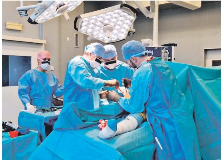
S MODERNĚ vybavenými operačními sály a lůžkovým oddělením poskytuje ortopedické oddělení péči na špičkové úrovni, oblíbenou nejen mezi vrcholovými sportovci.

Mezi nejčastěji prováděné artroskopické výkony patří