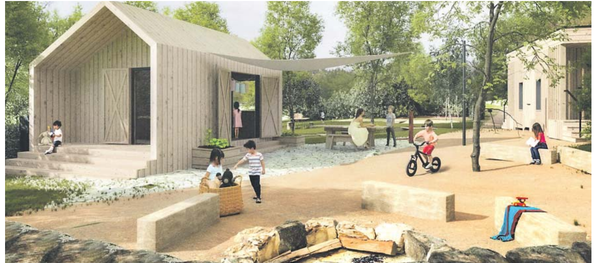
NABÍDKU pro rodiče s dětmi Praha 3 rozšíří vybudováním lesní školky v parku Kapslovna. Vzniknou zde tři dřevěné objekty a nová zahrada.

■ Zastupitelé Prahy 3 schválili rozpočet městské části na letošní rok. Z hlediska běžných příjmů a výdajů je přebytkový o necelých 49 milionů korun. Městská část plánuje investice do rozvoje, například do oprav bytových domů, vybudování lesní školky nebo výstavbu skateparku.