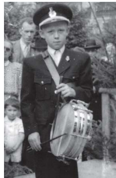
LÁSKA k hudbě ve dvanácti letech.

pán a pošeptal mi: ‚Pane Hybš, zavažte se, že byt opustíte, a to ihned po dostavění svojí vily. A nebojte se ničeho, je to jako bychom to šoupli do komína...‘ Lejstro jsme sepsali a vidíte, bydlím tu pořád. A tu vilu jsem skutečně časem postavil.“ (pokračování příště)