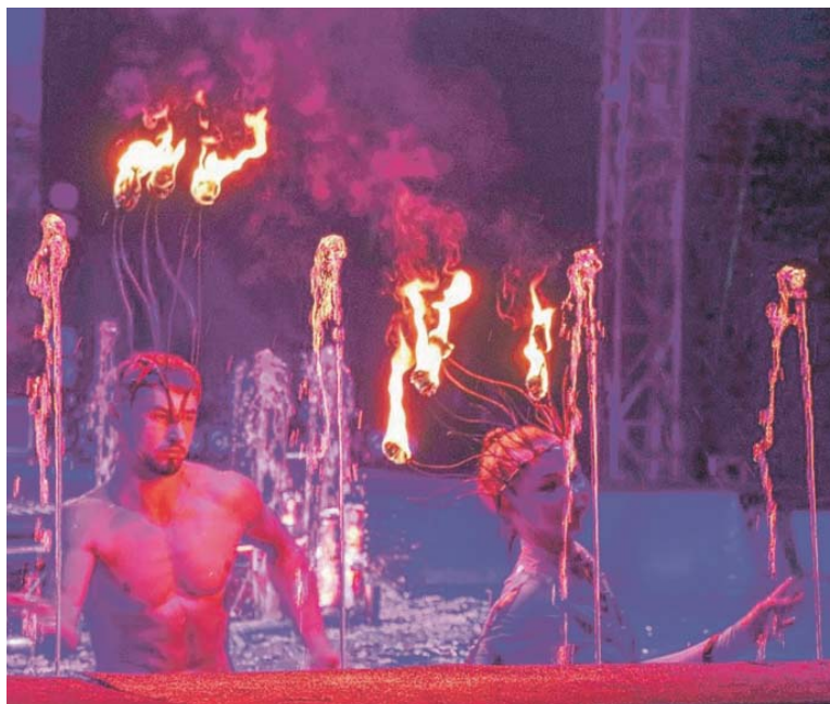
WATERLAND Circus spojuje dva živly – vodu a oheň.

Odpovězte na soutěžní otázku do 17. března na e-mail soutez@ceskydomov.cz a deset výherců získá po dvou vstupenkách na představení Waterland Circus. O výhře budou výherci informováni e-mailem.