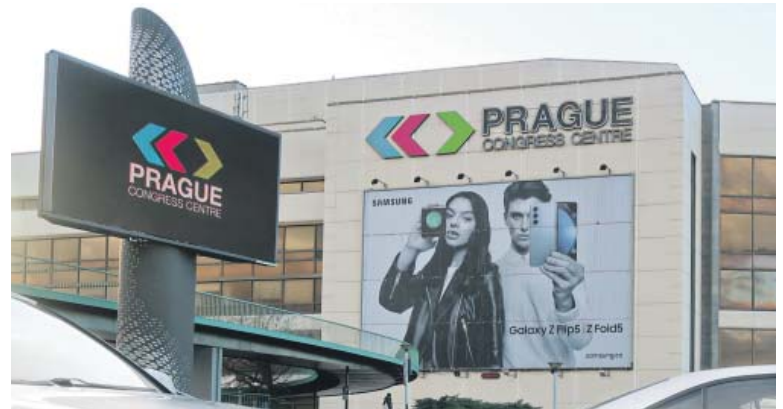
PODLE průzkumu nejvíce Pražanům vadí billboardy/bigboardy a také reklamy na sloupech veřejného osvětlení.

Nejvíce Pražanům vadí billboardy/bigboardy a také reklamy na sloupech veřejného osvětlení.