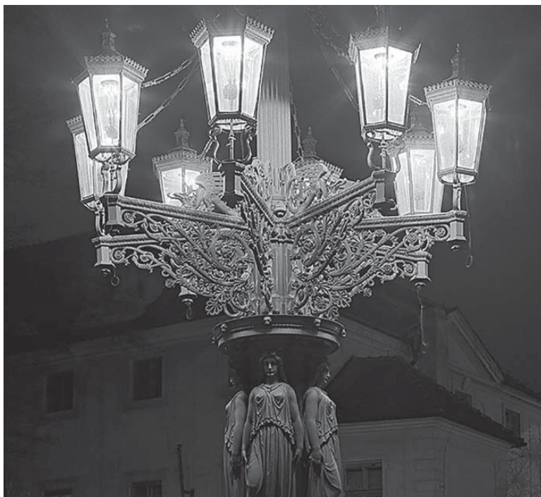
NĚKTERÉ druhy pouličních plynových lamp byly technicky i výtvarně unikátní. Bohužel do dnešních dní se dochovaly pouze tři.

S plynovými lampami se do ulic Prahy vrátila i profese lampáře, který večer lampy ručně rozžínal a ráno zhasínal. Chcete si toto tradiční „plynárenské“ povolání vyzkoušet? Pražská plynárenská pořádá komentované vycházky s historikem plynárenství a vedoucím Plynárenského muzea zaměřené na historii a současnost veřejného osvětlení v Praze, hlavně toho plynového, s ukázkami lampářské profese.