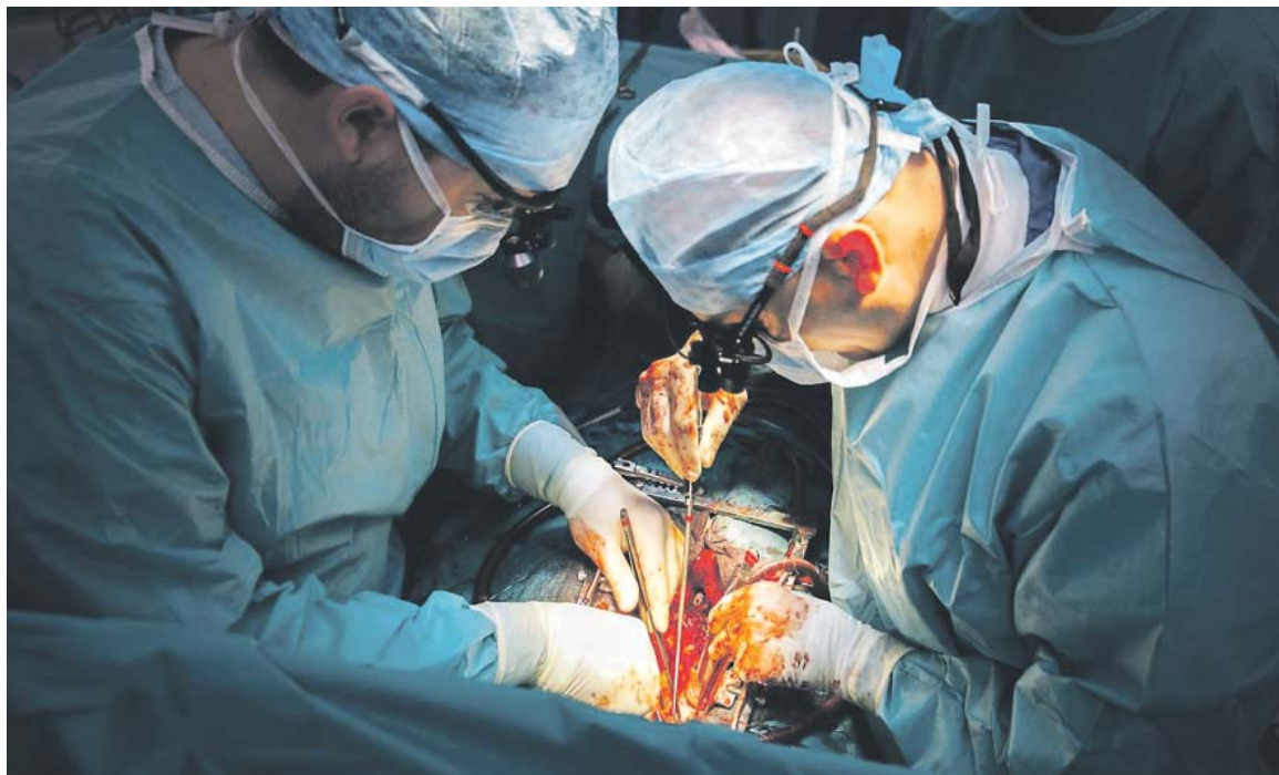
OD ROKU 1984 lékaři v IKEM transplantovali už více než 1390 srdcí.

V současnosti je transplantace srdce zavedenou klinickou metodou léčby terminálních stádií srdečního selhání. Odhaduje se, že srdeční selhání postihuje v ČR více než 350 000 osob (tj. přibližně 3,5 % dospělé populace) a jeho výskyt bude dále růst v důsledku stárnutí české populace a nárůstu některých rizikových faktorů, jako je obezita a diabetes. „U většiny pacientů je toto onemocnění možné efektivně léčit pomocí moderních léků, které jednoznačně prodlouží život pacienta. U řady pacientů pomáhají implantabilní přístroje (kardiostimulátory či defibrilátory) či katetrizační metody léčby arytmií, chlopenních vad nebo zúžení koronárních tepen. Pro pacienty v nejpokročilejší fázi onemocnění, kteří jsou