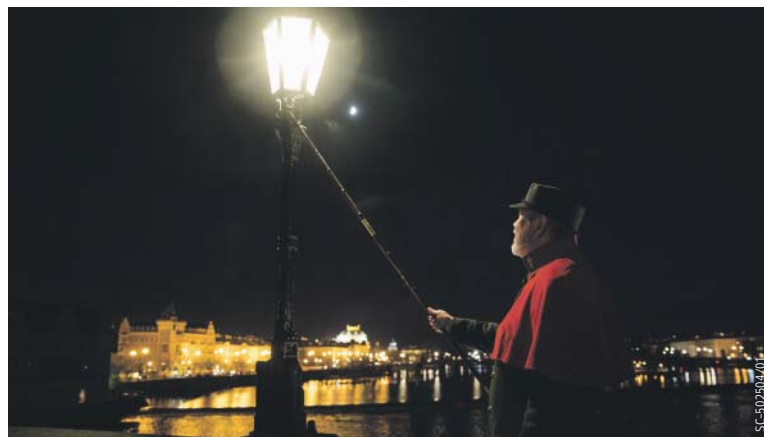
SPOLEČNOST Pražská plynárenská pořádá komentované vycházky s ukázkami lampářské profese.

V roce 1867 byla dokončena první obecní plynárna na Žižkově a rozsvíceno prvních několik stovek nových plynových lamp. Spolu s tím byla provedena velká rekonstrukce veškerého plynového osvětlení města, přičemž některé druhy stožárů byly technicky i výtvarně unikátní. Kromě veřejného a soukromého osvětlování byl plyn užíván pro osvětlování obecních domů, úřadů a ústavů, pro vlastní spotřebu plynárny, kanceláří a strážnic ve městě a skladu lustrů. K dispozici byly trojramenné, čtyřramenné a osmiramenné kandelábrů, svícnové sloupy, lucerny na roubených studnách, lucerny nástěnné a visuté, lucerny na sloupcích dřevěných. Plynové světlo bylo používáno i pro osvětlení pražských parků, ostrovů, zahrad a nábřeží. Zvláštním druhem stožárů byla