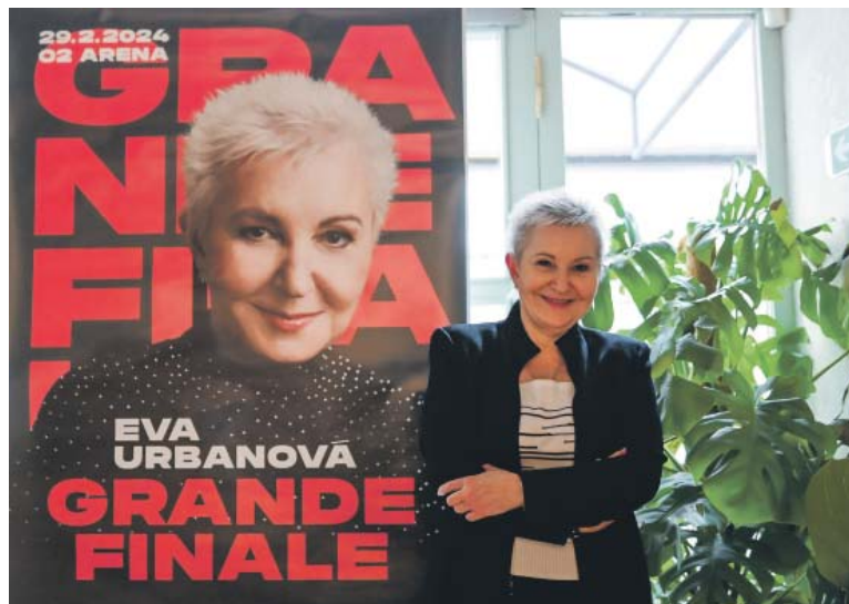
KONCERT ukáže Evu Urbanovou v mnoha zajímavých hudebních polohách.

Odpovězte na soutěžní otázku do 25. 2. 2024 na e-mail: soutez@ceskydomov.cz a do předmětu e-mailu napište EVA. Deset výherců získá po dvou vstupenkách, o výhře budou vyrozuměni e-mailem. POZOR, lístky se musí osobně vyzvednout v Praze! (red)