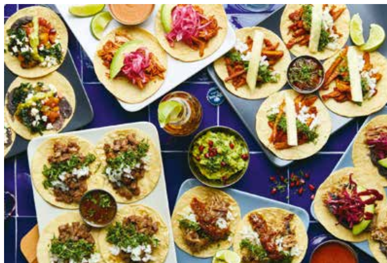
MEXICKÁ kuchyně, to je skutečná pestrost chutí na talíři. Přijďte vyzkoušet!

Milovníci tacos navíc ocení speciální LAS ADELITAS TA-