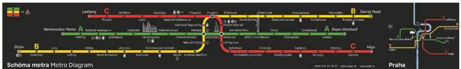
JEZEVČÍKY hleďte na stěnách vedle dveří soupravy metra.

uvedených doplňkových informací. Po zpracování výsledků průzkumu by měly všechny vozy metra získat finální podobu těchto informací na jaře příštího roku. Více o projektu Čitelné Prahy: https://pid.cz/citelnapraha/ . (red)