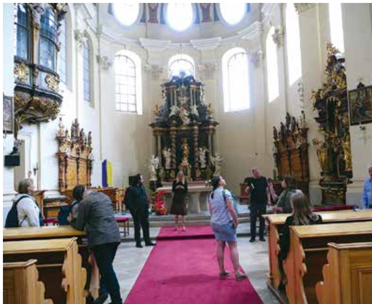
BŘEVNOVSKÝ klášter je spojený s patronem českého národa sv. Vojtěchem, prvním pražským biskupem.