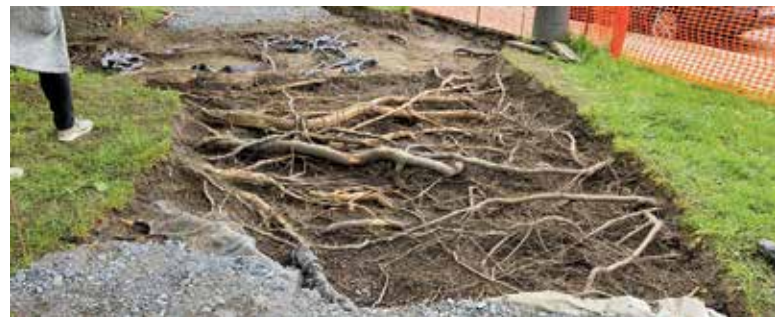
PÉČE o mohutné kořeny prodrážíla obnovu parku o 2,5 milionu korun.

Celkové náklady na stavební práce činily 10,6 mil. Kč. Projekt byl zahájen na sklonku minulého volebního období a je výsledkem aktivní finanční spolupráce městské části s hl. m. Prahou. (red)