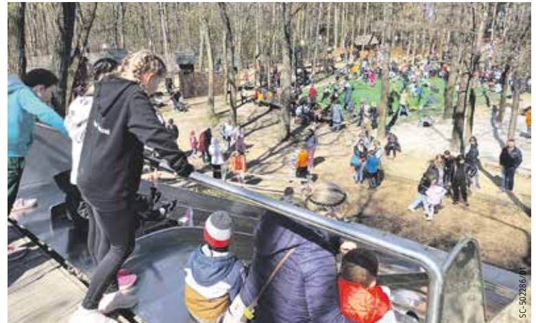
PŘEDVŠÍM dětským návštěvníkům nabízí Krtkův svět spoustu zábavy.

Nicméně příběh dolnoměcholupského podnikatele zaujal scenáristku a režisérku Evu