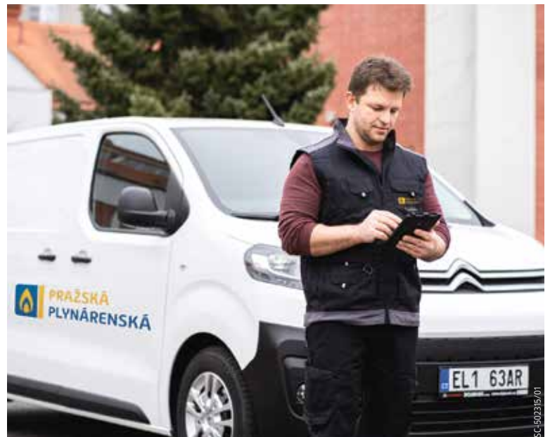
S INSTALACÍ nového kotle vám mohou pomoci pracovníci Pražské plynárenské.

vání komína a následné revize. Navíc si u Pražské plynárenské lze domluvit zajištění každoročního servisu. Pravidelně servisovaný a správně seřízený kotel má vyšší účinnost, je bezpečný, má tišší chod, prodlužuje se mu životnost a v neposlední řadě šetří rozpočet. (red)